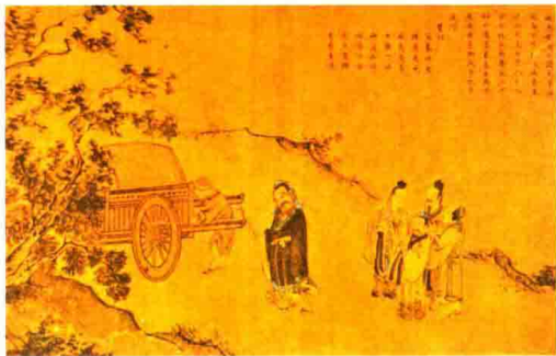
长春文庙文献展出画面