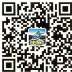
吉林省旅游发展委员会（服务号）