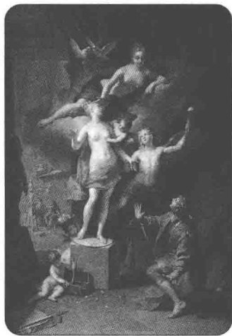
雕像有了生命，空中翱翔着爱神，在朦胧虚幻的环境中，人与神灵交织在了一起。

这个美丽的神话传说将现实与梦幻结合起来，为人们创造了一个充满遐想的瑰丽世界，直到今天，皮格马利翁雕像优美的形象和故事浓郁的诗意仍然长久地留