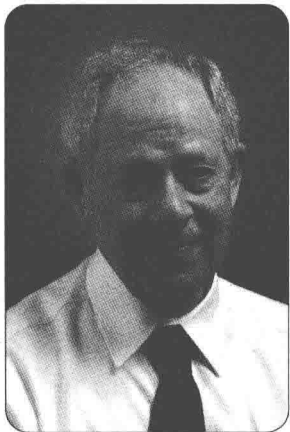
美国心理学家罗伯特·罗森塔尔。

艺术家从自己热爱的艺术作品中获得幸福的幻想生活,这是艺术家共有的特性。皮格马利翁作为一位艺术家,对自己的作品所投入的专注、热烈的情感,最容易感染到其他的艺术家,乃至影响到更广的范围。这个故事传达的是心理暗示的力量——你相信什么,就能实现什么,你期待什么,就能获得什么。