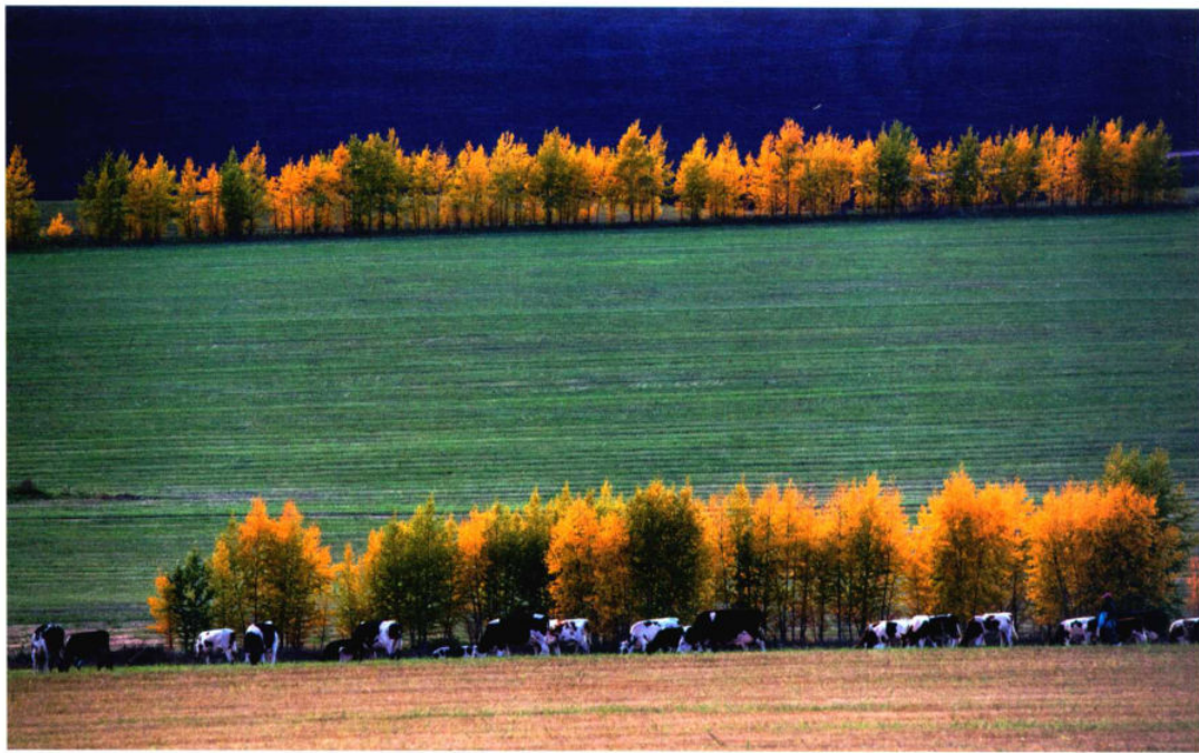
焦距：450mm 光圈：f/8 快门速度：1/800s 感光度：ISO800 曝光补偿：+2.0EV

创作的整个过程。狭义上的摄影构图相对具体，是指将构成画面的一切元素进行恰当的安排和处理，以获得画面最佳布局效果的方法，让画面中的各要素，如点、线、面、质感、色彩、光影等，能形成一定的艺术形式，目的是用恰当的构图形式结合画面内容更好地表达摄影人的思想、情感等，并传递给观者。在实际拍摄中，就是通过构思，确定拍摄对象，寻找拍摄角度，运用光线、影调、色彩、明暗，以及虚实、对比、留白等表现手法，将构图法则具体化，以最富有表现力的画面，凸显作品的主题。