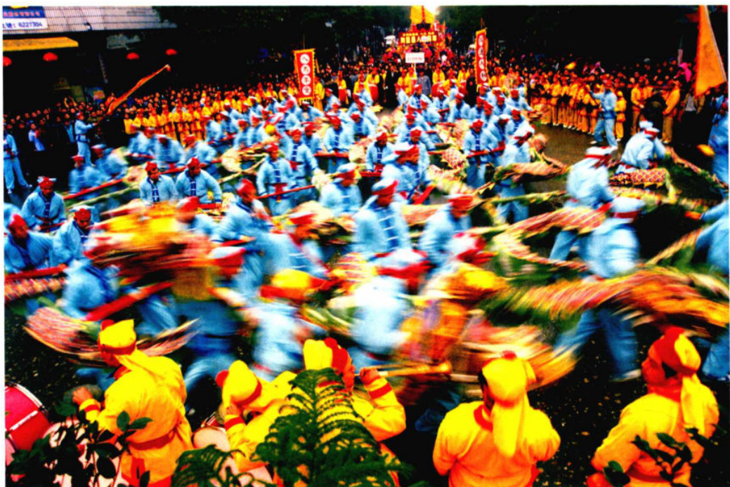
焦距：35mm 光圈：f/8 快门速度：1/60s 感光度：ISO250 曝光补偿：-0.3EV

美国华盛顿街头的大广告很有意思，两位大汉极夸张地张大着嘴，好像彼此冲着对方怒喊着什么，此时一位美女搬着一箱东西经过，当她正好走到两张大嘴的中间时，作者按下了快门，美女看起来有被大嘴“撕咬”的危险，画面诙谐、有趣