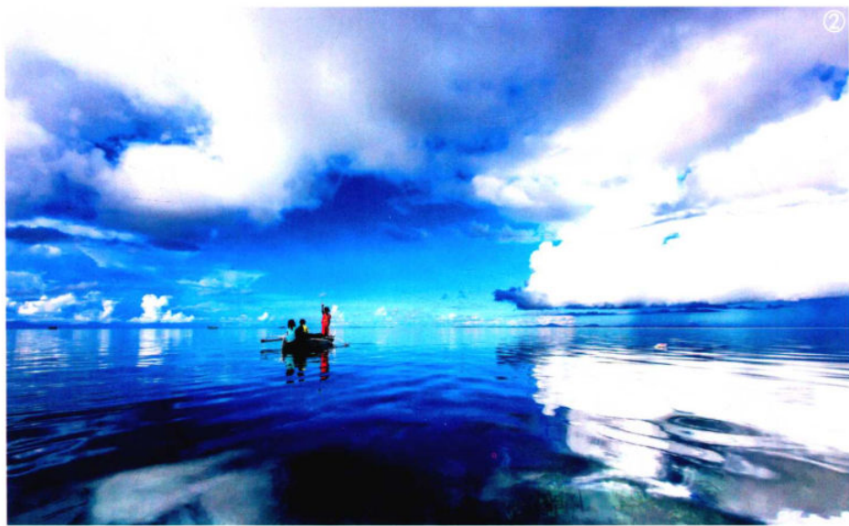
焦距：16mm 光圈：f/14 快门速度：1/640s 感光度：ISO400 曝光补偿：-0.7EV

1 我们在观看图①时，会被画面中的碧水、蓝天、白云所吸引，观者的第一视觉落脚点容易停留在海面与天空的交界处。当然，作品中的白云很抢眼，但不能成为视觉中心点，因此观者最终大部分时间是在观看整幅画面，通过画面整体去感受画面中优质环境带给人的视觉享受。而图②则不同，它有明确的视觉中心点，而且白云汇聚的趋势很强烈，将该视觉中心点包围，使其显得更加突出。我们在观看该幅作品时，会顺着白云的走势向前，然后落在视觉中心点上，多数时候视线都将停留在这一点及其周围较小的范围，很少会去看画面中其他的地方。