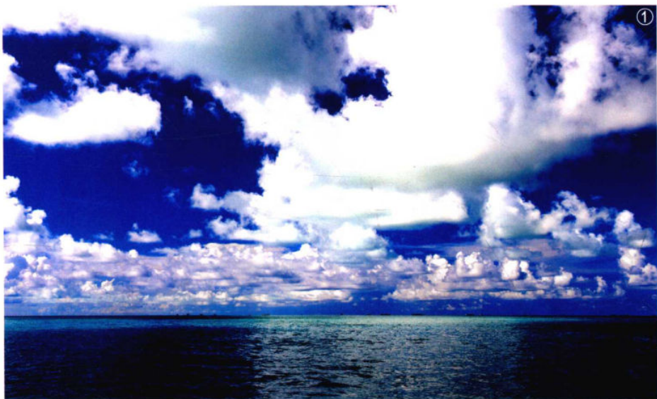
焦距：34mm 光圈：f/8 快门速度：1/500s 感光度：ISO200

有时运用一定的构图技巧，充分发挥构图元素的相关特性，就能引导观者按照一定的顺序或步骤来观看照片。这说明在观看摄影作品时，画面构图具有很强的引导作用。