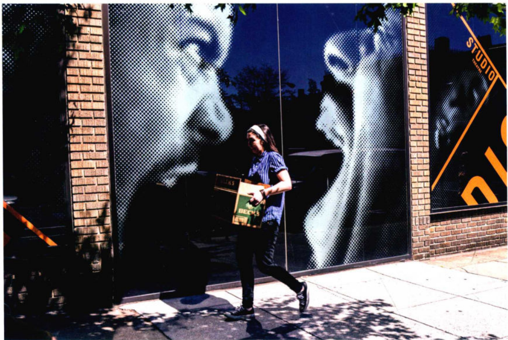
焦距：35mm 光圈：f/6.3 快门速度：1/400s 感光度：ISO100

美国华盛顿街头的大广告很有意思，两位大汉极夸张地张大着嘴，好像彼此冲着对方怒喊着什么，此时一位美女搬着一箱东西经过，当她正好走到两张大嘴的中间时，作者按下了快门，美女看起来有被大嘴“撕咬”的危险，画面诙谐、有趣