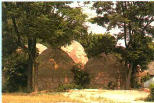
西安半坡仰韶文化遗址