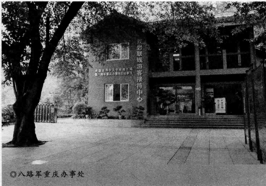
◎八路军重庆办事处

10余幅，毛泽东、周恩来、叶剑英蜡像3尊，艺术景观10个，大型声光电沙盘模型1个，影像室1间，多媒体电脑5台，油画2幅。