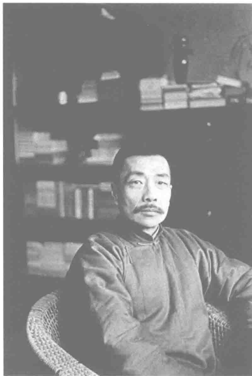
在景云里寓所，1928年3月16日摄