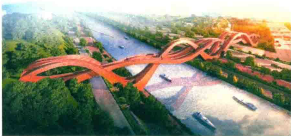
图 1-1 梅溪湖人行桥 ①

型却是宏伟、壮美的,只有中国结的“形”,没有中国结的“韵”。梅溪湖桥是一个有创意的好设计,但这个设计并没有体现中国传统文化的“气质”。