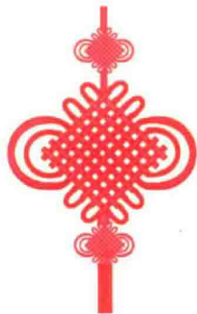
图 1-2 中国结

创作的繁荣有赖于理论的建树和思想的活跃,有赖于历史的比较、分析和研究。尽管对桥梁建筑形式、建筑空间、与场地的结合、象征意义等方面的追求已经成为桥梁设计师的共识,但我国目前对桥梁的价值与意义评判中的主要问题研究几乎是空白。