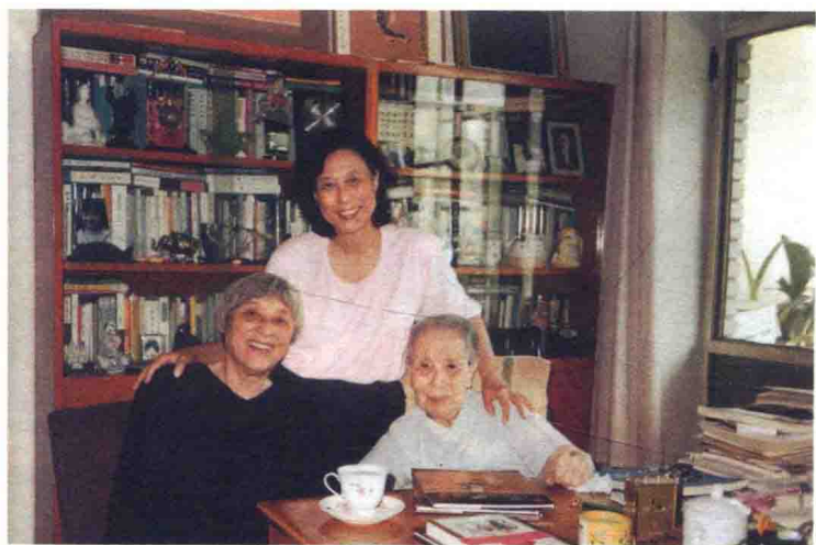
1990年，“冰心奖”创立，韩素音（左）、葛翠琳（中）在冰心家中与冰心（右）合影留念。