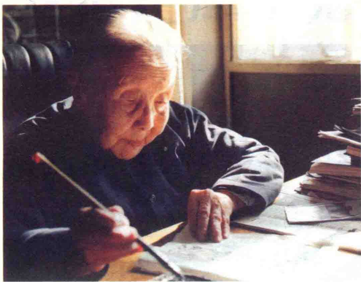
现代作家、诗人、儿童文学家冰心（1900～1999）