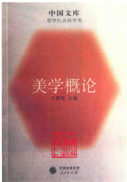
◎ 《美学概论》2005年再版书影