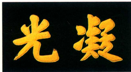
陆润庠题（同治十三年状元，历任国子监祭酒、山东学政、总办苏州商务）