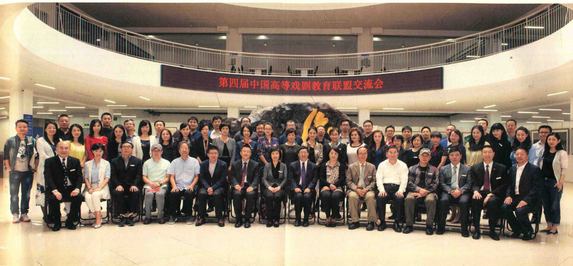
第四届中国高等戏剧教育联盟与会人员合影