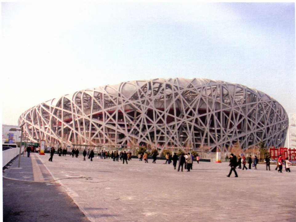
政府投资项目：国家体育场“鸟巢”