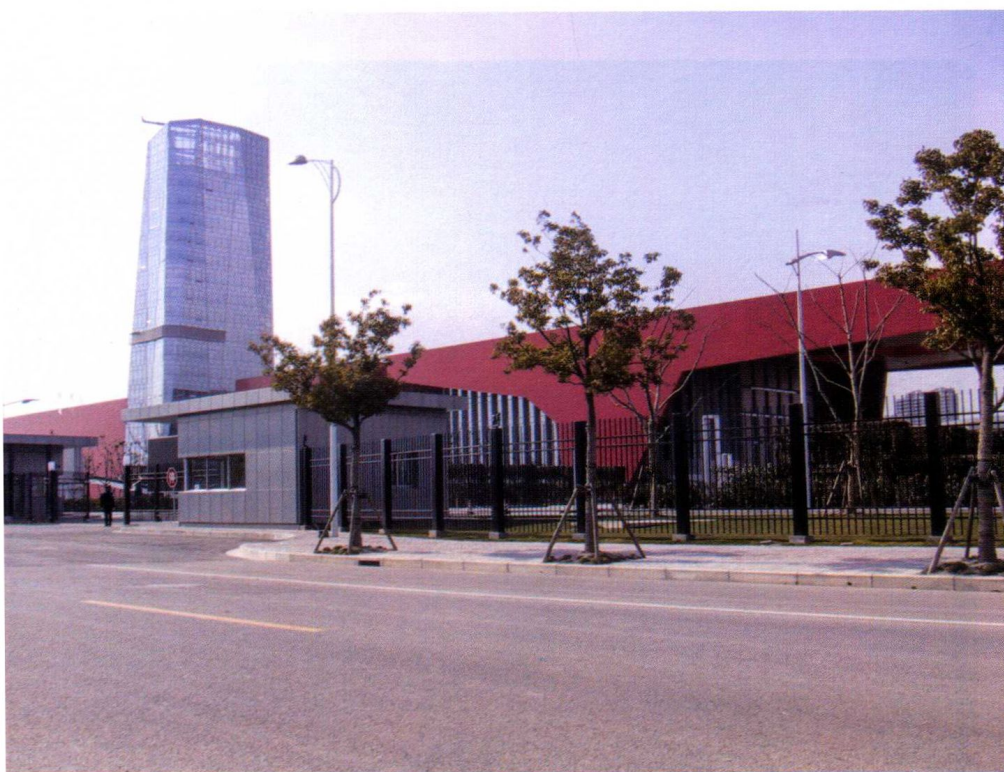
政府投资项目：上海浦东干部学院