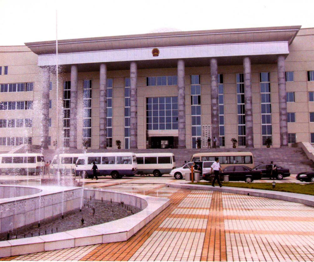
政府投资项目：江西省泰兴市黄桥镇政府办公楼