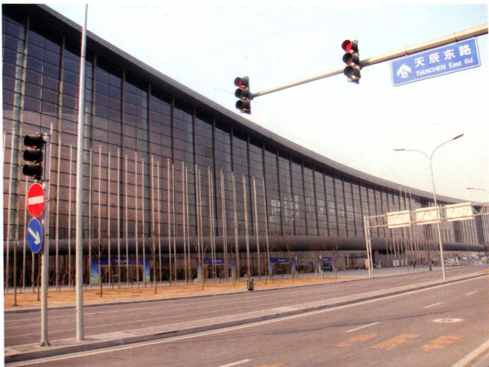
政府投资项目：国家体育馆