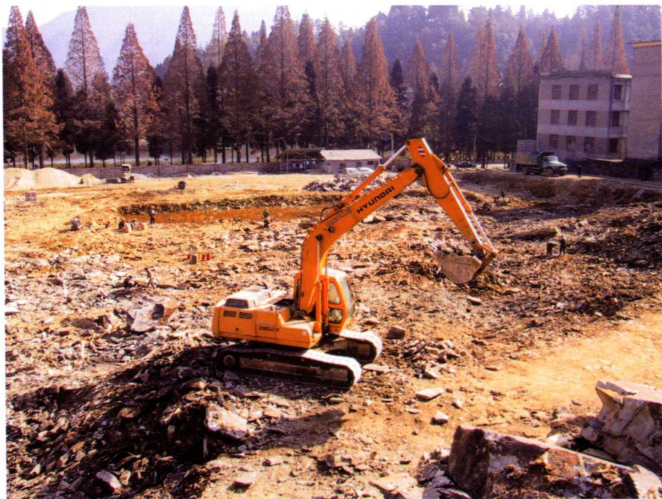
政府投资项目：江西省井冈山革命博物馆新馆建设工程场地平整