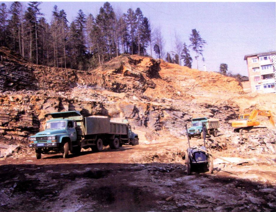
政府投资项目：江西省井冈山革命博物馆新馆建设项目土石方工程