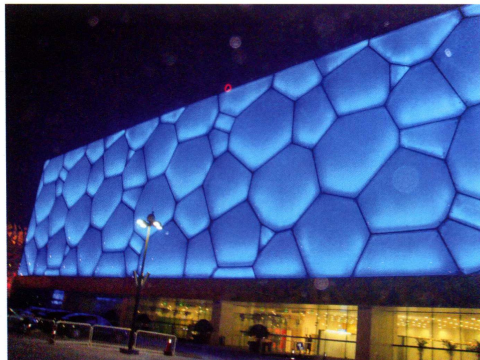
政府投资项目：国家游泳中心“水立方”夜景