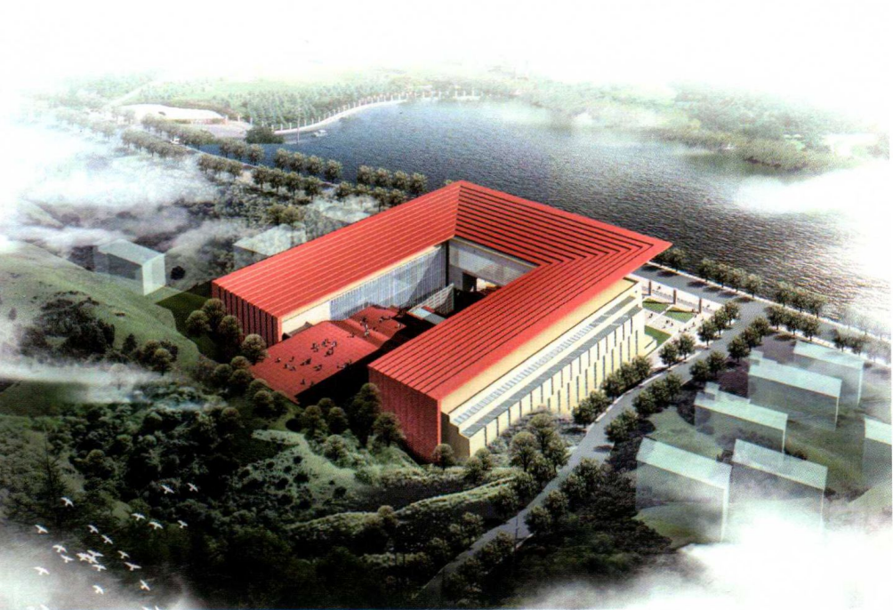
政府投资项目：江西省井冈山革命博物馆俯视效果图