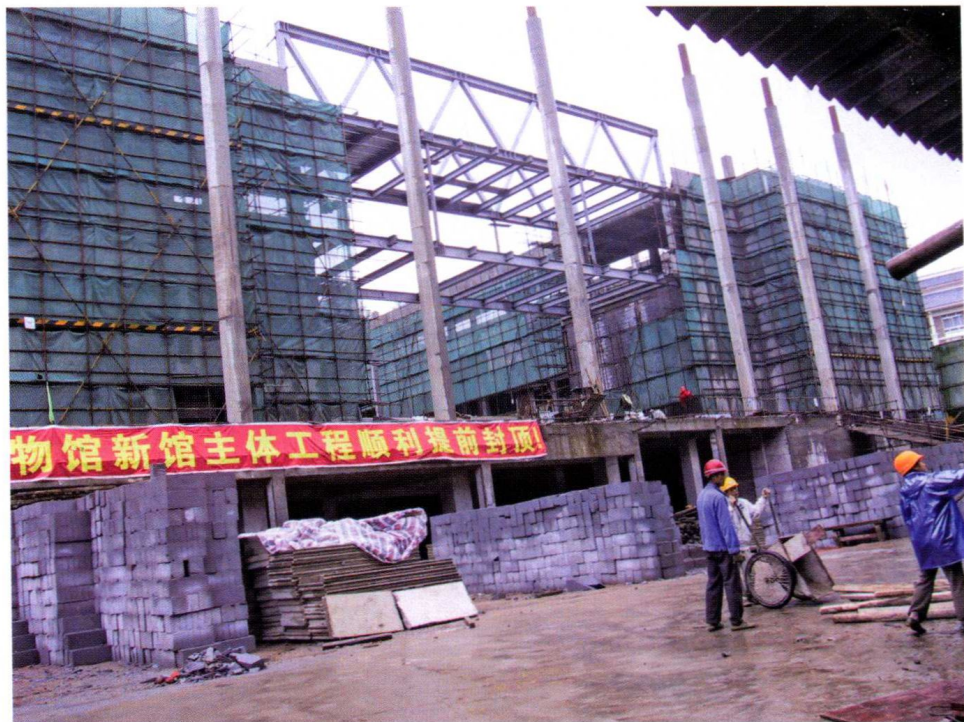
政府投资项目：江西省井冈山革命博物馆新馆主体工程提前封顶