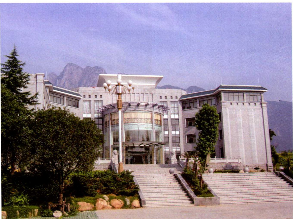
政府投资项目：江西省九江市庐山区海会镇政府办公楼