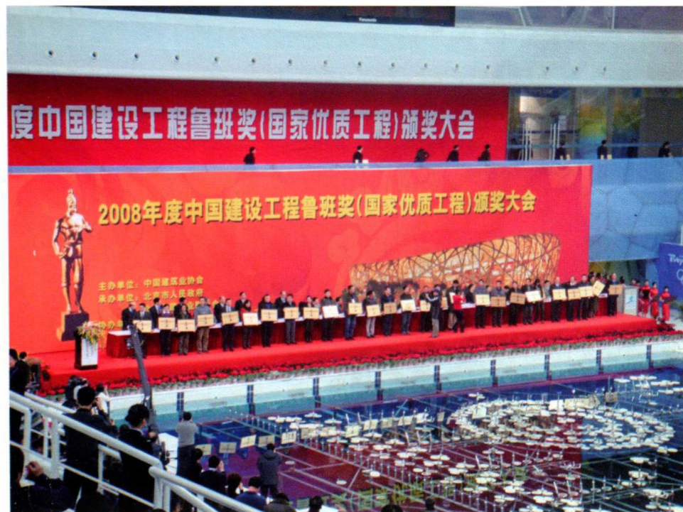
2008 年度中国建设工程鲁班奖颁奖现场