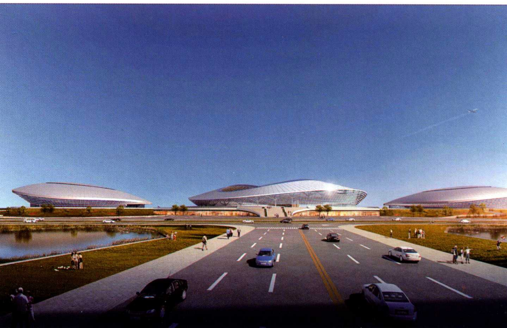
政府投资项目：筹建中的江西省萍乡市奥体中心