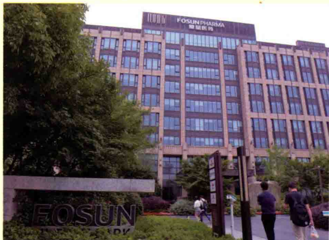
复星医药总部大楼。