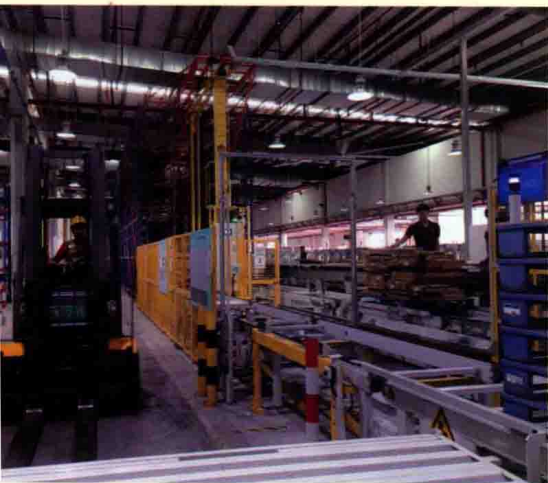
索菲亚厂区生产车间。◀