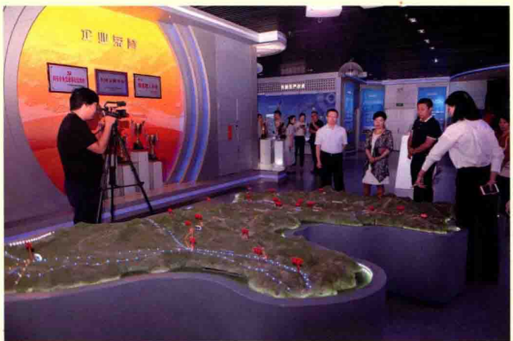
▶ 证券时报“上市公司高质量发展在行动”报道组参观陕天然气展厅。