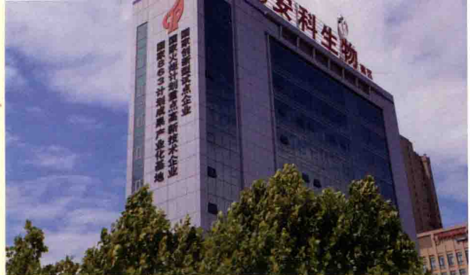
▶ 安科生物研发中心。