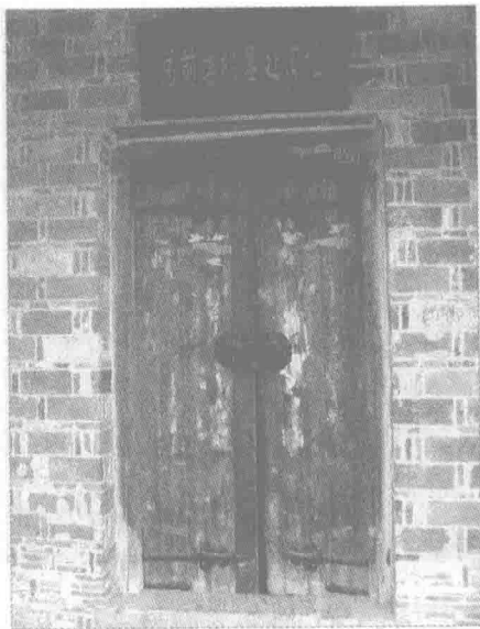
◎总前委机要处旧址