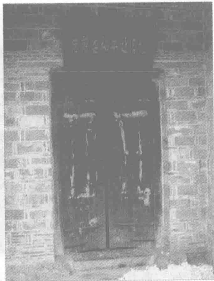
◎总前委秘书处旧址