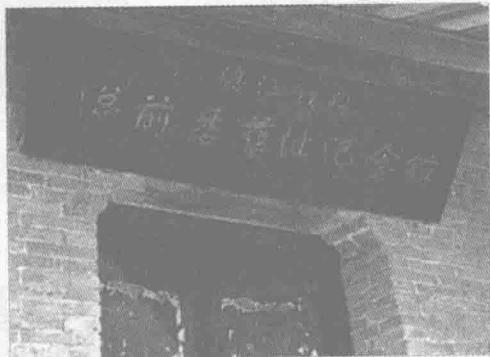
◎渡江战役总前委旧址纪念馆

总前委旧址群占地面积近 4 万平方米，共分为九个部分，分别为总前委旧址、中共中央华东局旧址、总前委参谋处旧址、机要处旧址、秘书处旧址、后勤处旧址、警卫营旧址、医院旧址和《渡江颂》书画展厅。渡江战役总前委旧址纪念馆现有藏品 125 件，多为与渡江战役有关的文物、文献、资料等。其中较为珍贵的有总前委领导人邓小平、