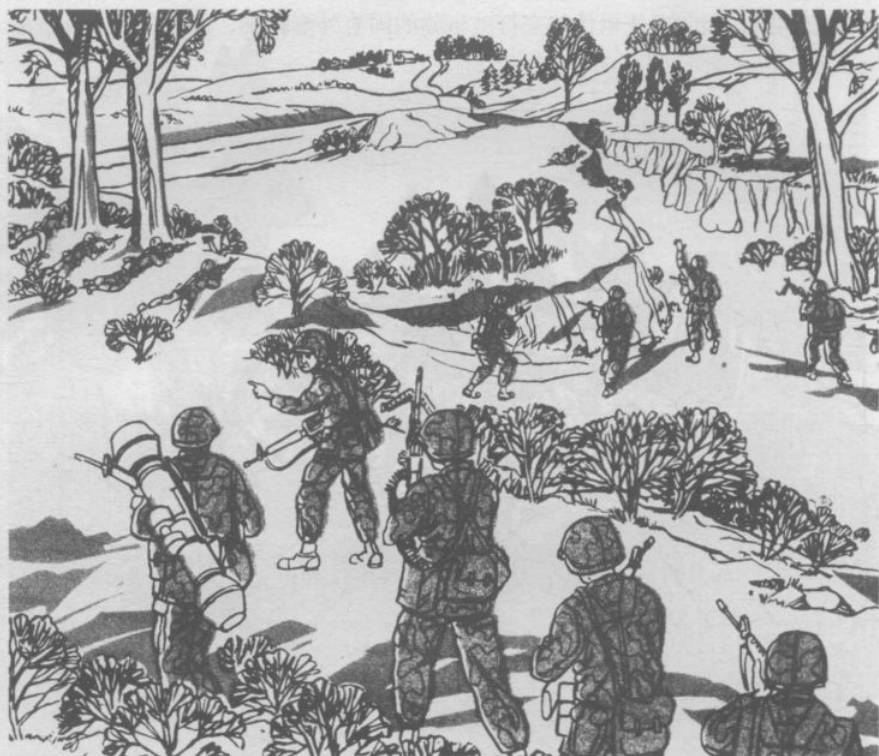
▲分散的行进、部署，不但利于伪装，也利于应付突如其来的攻击。

●如果你的肤色、军装、装备的颜色与背景色反差明显，将很容易被敌军发现。比如在雪地上绿色的军装就容易辨识，因此务必使你自身和随身的装备与周围环境相协调。