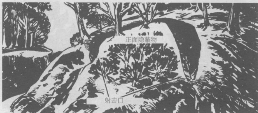
▲ 建于坡地上带有掩体和隐蔽物的阵地。