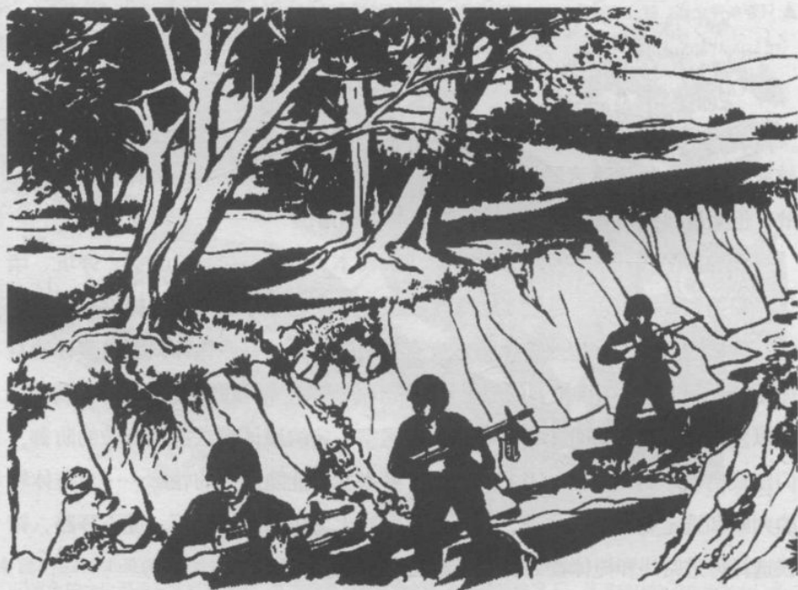
▲ 战场环境下，行军应该依托山沟、洼地等掩蔽环境行进，要做好战斗准备，以应对突发情况。

士兵要尽量避免出现在空旷地带、山顶和山脊上。若在被迫通过开阔地域时，遭到猛烈火力攻击，且无法继续推进，士兵应立刻实施近迫作业（即逼近敌人时在敌火力下构筑掩体的行动，通常在人员接敌运动中通过开阔地，受敌火威胁，需要做短暂停留时实施）。此时的作业姿势要低、动作要快，通常应采用低姿匍匐姿态，使用工兵铲并配合手脚（手推脚踏）在松软地面进行掩体挖掘。与此同时，士兵还要不断观察，随时准备战斗与前进。近迫作业必须在短时间内完成，一般训练有素的士兵能在五分钟内构筑一个单人掩体，八分钟内构筑一个机枪或火箭筒双人掩体。近迫作业一般采取人工作业，对于硬化土层，可使用专用掩体爆破器材。通常，士兵应先构筑卧射掩体，在需要时再加