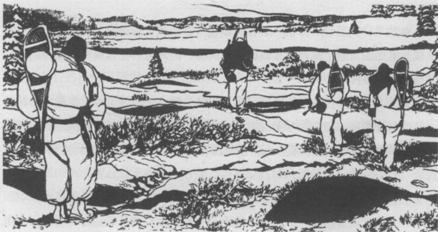
▲ 雪地环境下，必须进行伪装，高反差的环境下，会让任何不协调的颜色、轮廓都变得更加醒目。