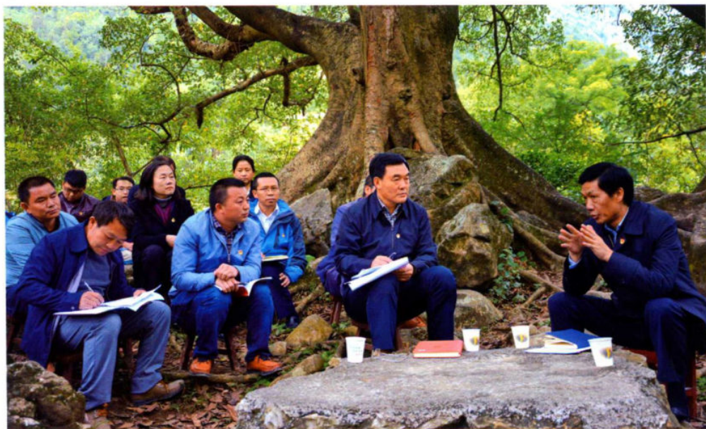
11月18日，市委书记李再勇到盘县保基乡宣讲十八届六中全会精神。他强调要认真学习贯彻党的十八届六中全会精神，坚决维护以习近平同志为核心的党中央权威，坚定不移推进全面从严治党，充分发挥各级党委领导核心作用、基层党组织战斗堡垒作用和党员先锋模范作用，把学习成果转化为决战脱贫攻坚的创造力、发展动力