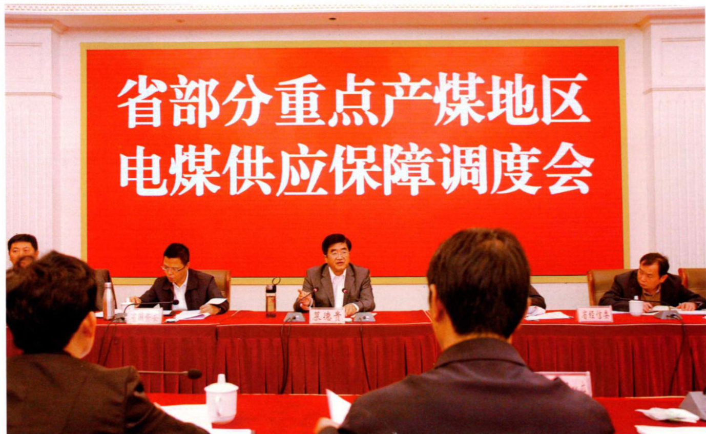
10月20日，省重点产煤地区电煤供应保障调度会在盘县召开，省委常委、副省长慕德贵出席会议