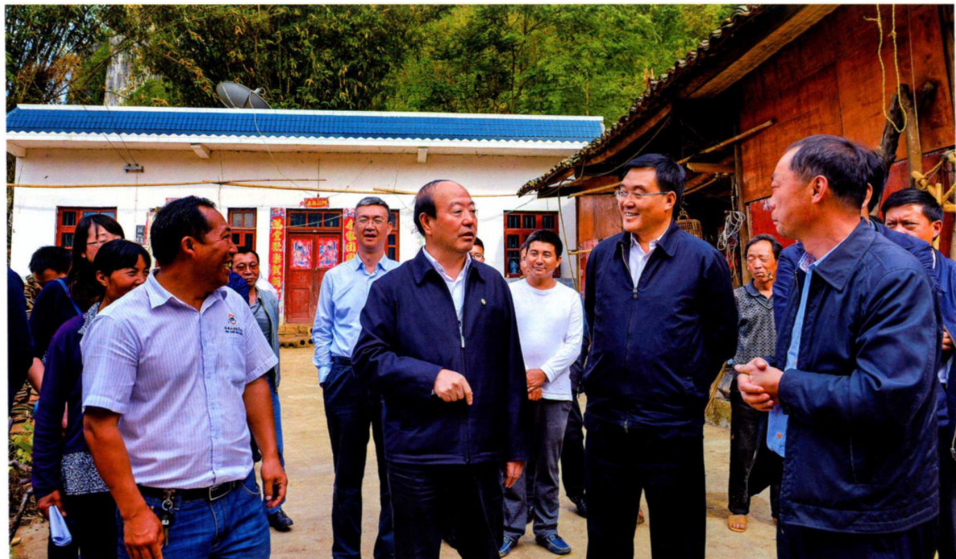
4月27日，市人大常委会副主任傅传耀到盘县普古乡舍烹村调研精准扶贫和“三变”改革等工作。市人大常委会主任黄金，市委常委、县委书记付国祥，市人大常委会主任谢承厚，市扶贫局局长王成刚，市人大常委会副主任龙琳陪同调研