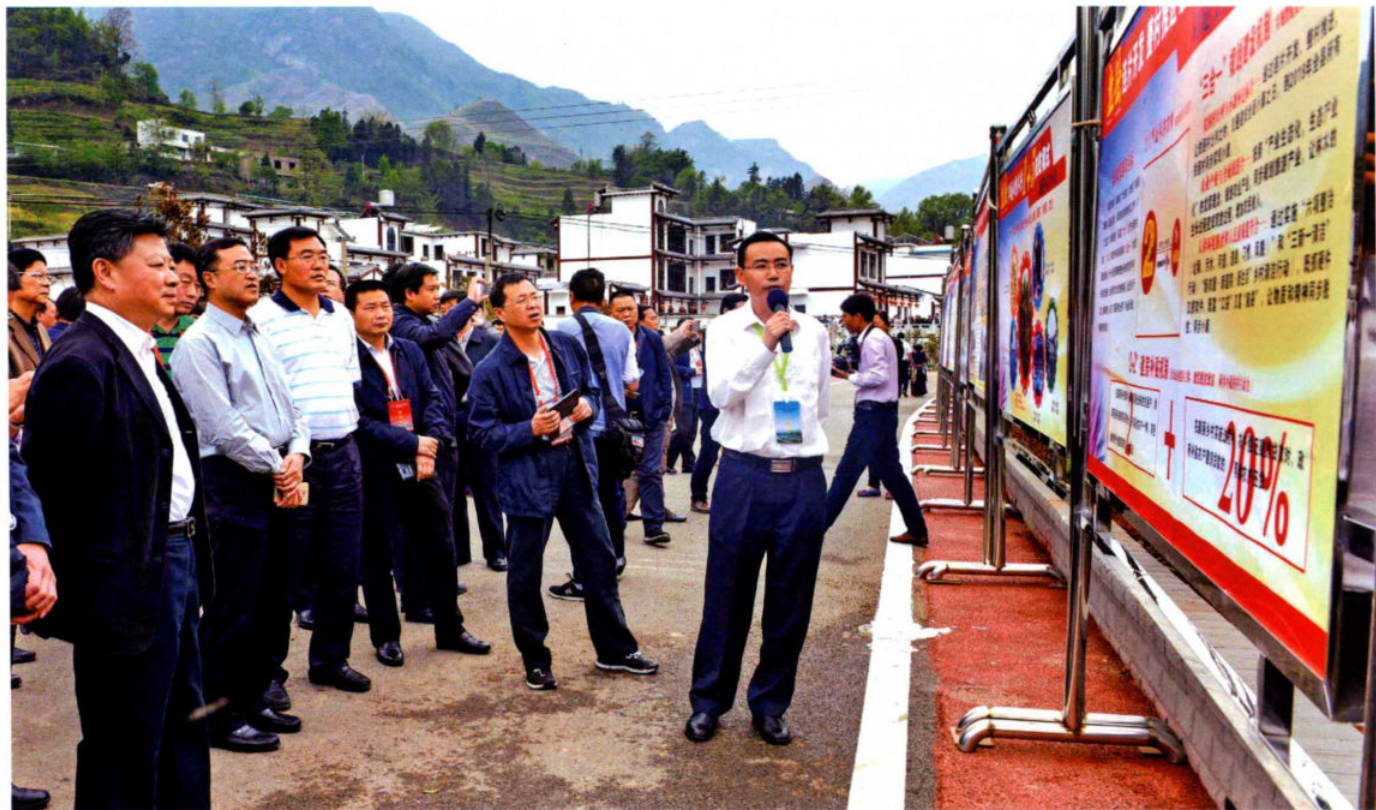
4月8日，省政府副省长陈鸣明、省政协副主席陈海峰率2016年全省第一次项目建设现场观摩会第九组到盘县观摩。市领导杨宏远、魏雄军、付国祥、郑建国、付昭祥参加观摩，县领导杜军、杨显龙、路振等陪同观摩。与会人员先后到英武特色小镇等参观（左一秦海峰，左二陈鸣明）