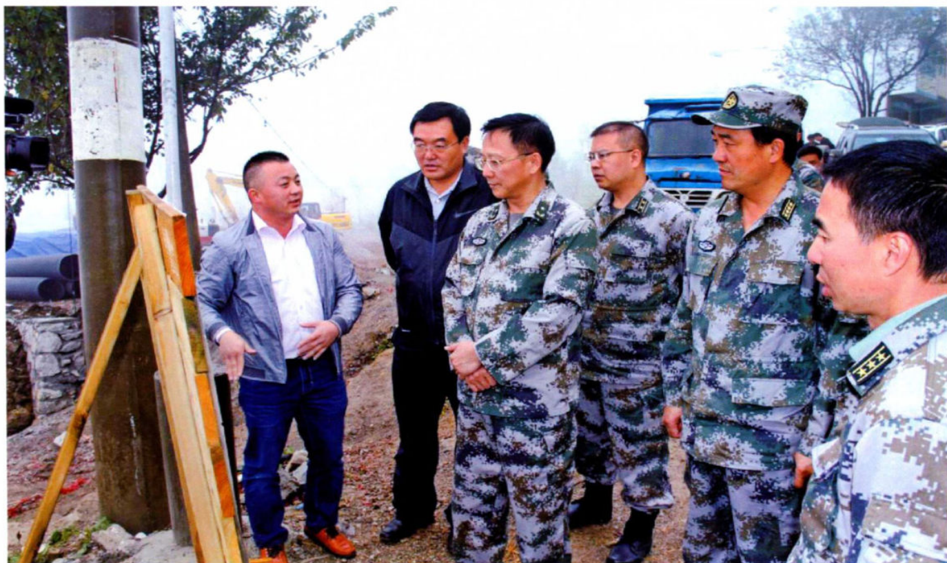
10月10日，省委常委、省军区司令员王盛槐（左三）到盘县保基乡开展扶贫工作调研