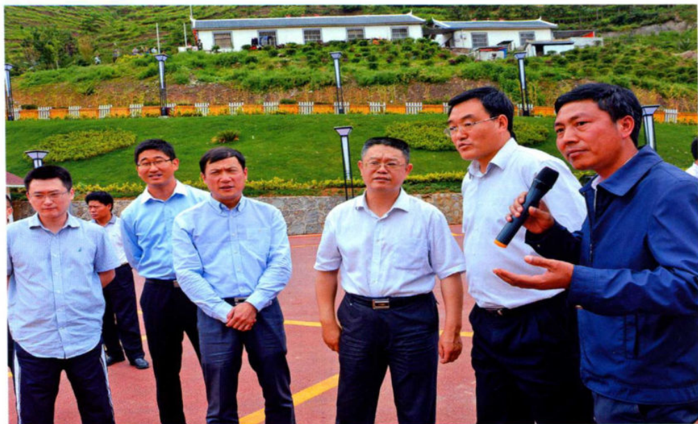
6月3日，中央组织部研究室副主任张强（右三）率调研组到盘县调研领导干部能上、能下工作情况，市委副书记魏雄军，市委常委、县委书记付国祥陪同调研。图为张强在羊场乡调研