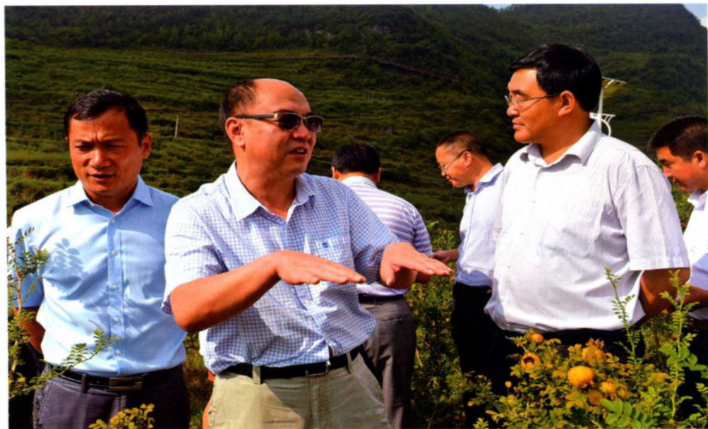
8月23日，国务院扶贫开发办开发指导司司长海波一行到盘县开展精准帮扶典型案例现场观摩活动。省扶贫办党组书记、副主任王贵，市委副书记魏雄军，市委常委、县委书记付国祥，市委常委、市政府副市长张兵，市委副秘书长、市“三变”办主任何友座，县政府副县长简正隆陪同观摩