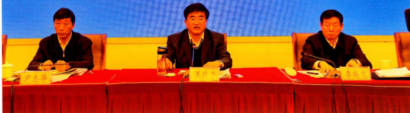
2016年11月8日，全省瓦斯治理工作现场会在盘县召开，省委常委、副省长慕德贵出席会议