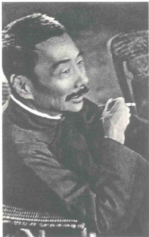
鲁迅在木刻展览会上，1936年10月8日摄于上海