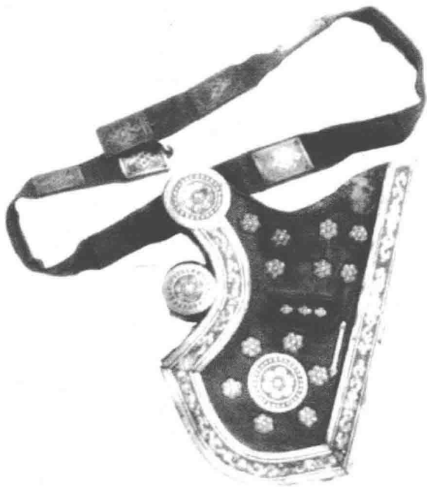
蒙古骑兵用的箭袋

公元 10—12 世纪，蒙古高原各部先后受辽、金的统治。他们逐渐西迁，与定居在蒙古草原上的突厥部落相接触，并从原始的狩猎民族转变成游牧民族，但社会组织形式中仍然残留着相当的原始氏族制度，并对其社会诸方面有着重大的影响和制约。在家庭组织形式中，一个男人，能供养多少妻子，就可以娶多少妻子。长妻的地位在众多妻子中最高。在 12 世纪较大的部落有塔塔儿部(斡孛黑)、泰赤乌部、克烈部、乃蛮部和蔑儿乞部。12 世纪后期，原始的集体游牧方式逐渐为个体游牧代替。私有财产积聚，出现贫富分化，在蒙古氏族成员中产生出显贵家族，其代表人物被称为“那颜”。那颜拥有自己的战士，他们被称为“那可儿”。那可儿为那颜服役、征战，“那颜”则供给他