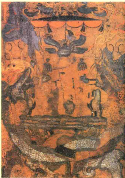
中国古代宗教相信人骑鹤升天，天上有鹤

1) 轻薄的素纱禅衣。马王堆一号墓出土；交领、右衽、直裾式；用精缫丝织造，其丝缕很细。其衣长128厘米，袖长90厘米，腰宽48厘米，下摆宽49厘米。