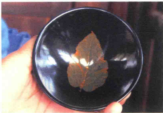
江西吉州窑烧制的木叶碗

绉裙。王熙凤是女性，其穿的丝绸更加华丽，袄子的大红云缎上有百蝶穿花，裙子上是碧绿色的无数的花朵（即撒花）。再看两个女孩的腰带，史湘云腰里束一条蝴蝶结子长穗五色宫绦；林黛玉系一条青金闪绿双环四合如