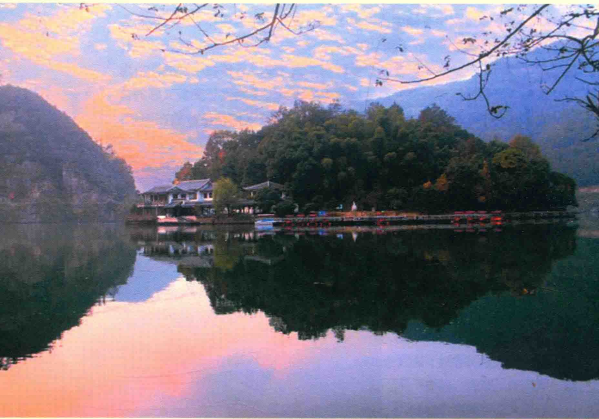
桐庐富春江风光：一折青山一扇屏