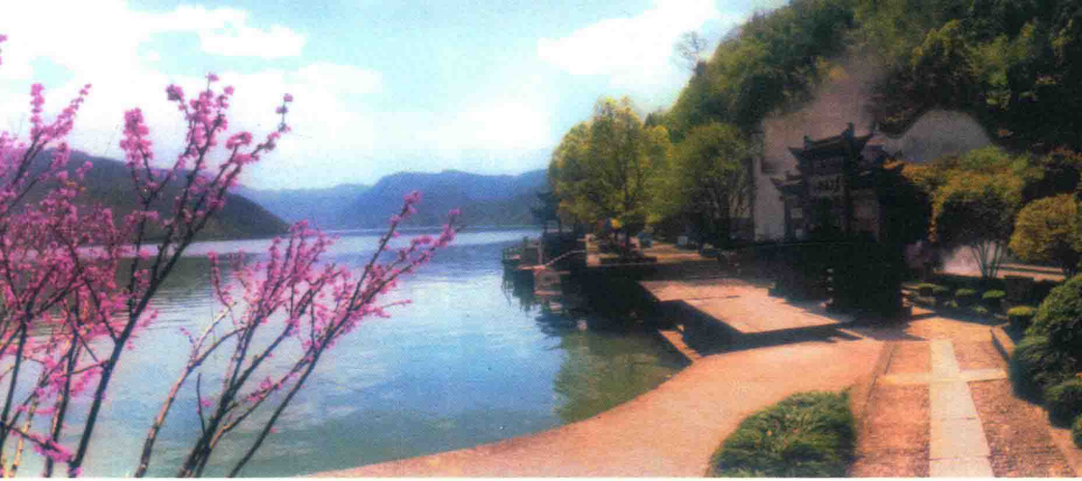
桐庐富春江风光：一湾碧水一条琴