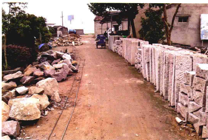
乌石村河道砌砌工程所用优质石材