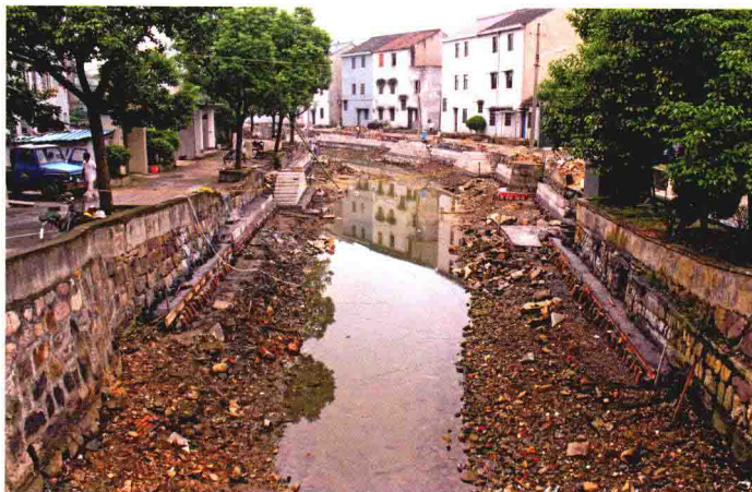
2012年河道砌砌施工现场