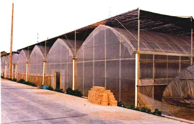
先进的蔬菜大棚设施