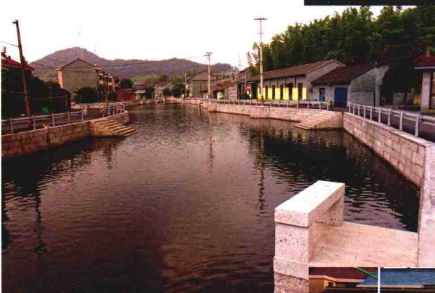
乌石村沿山下生活区