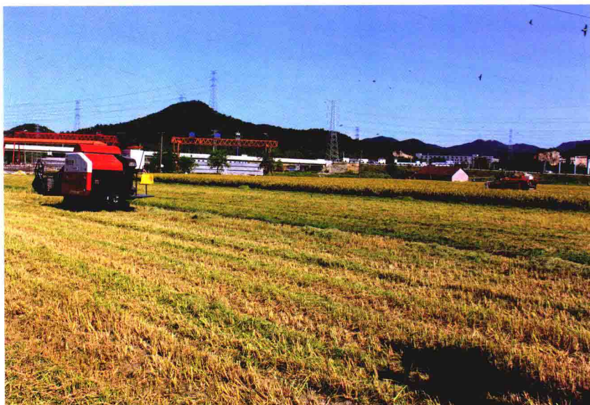
种粮大户正在收割晚稻