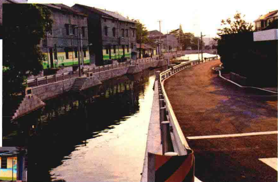
乌石村上七亩生活区