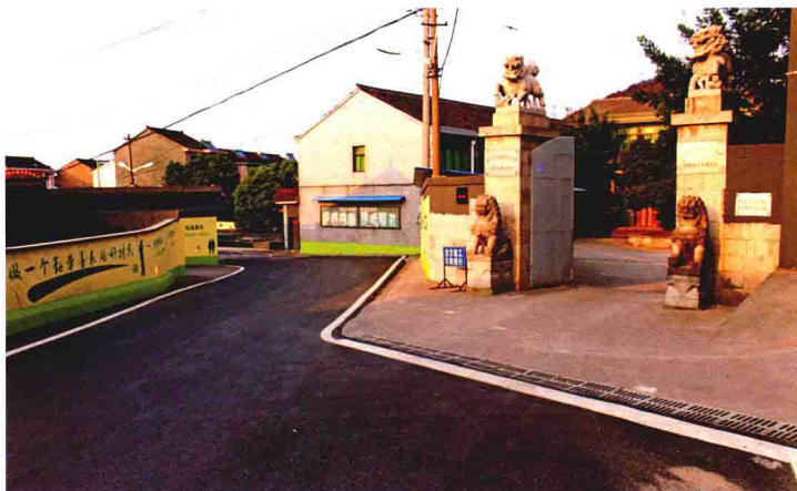
村两委会办公所在地外景