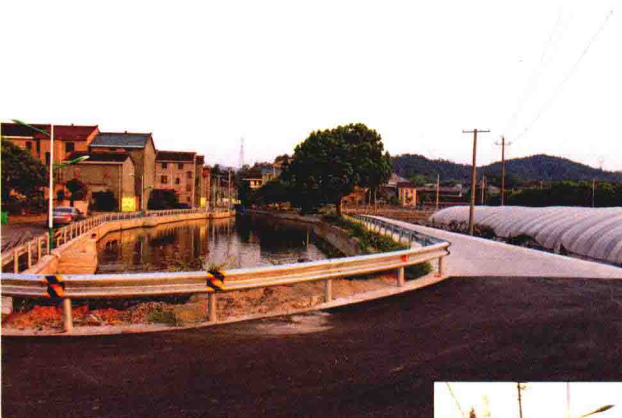
乌石村王家楼生活区