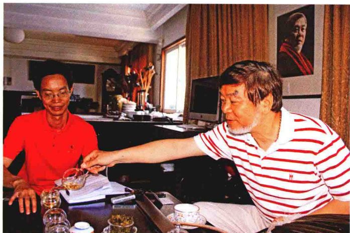
卢江良与著名画家、全国政协委员、浙江省美术家协会副主席何水法合影