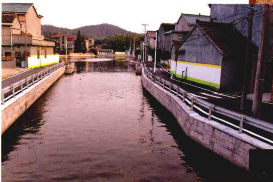
乌石村郑家生活区