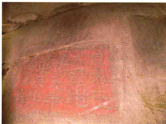
建初买地刻石现状