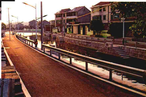
乌石村庙桥头生活区