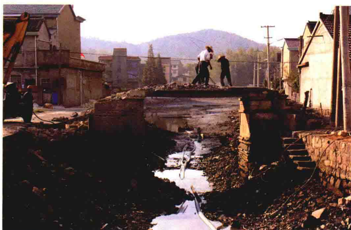
老桥改造施工现场