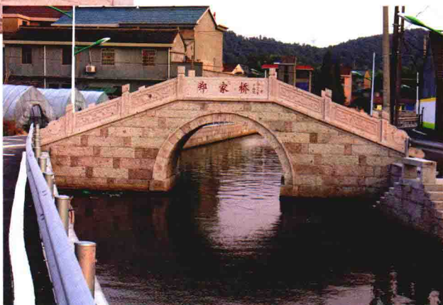
重建后的乌石村郑家桥