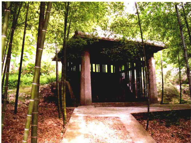
建初买地刻石保护亭