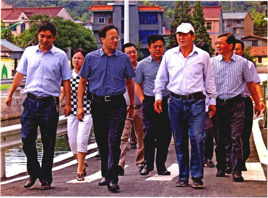
县、镇领导视察乌石村