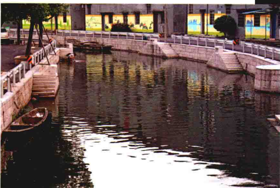
乌石村塘路生活区