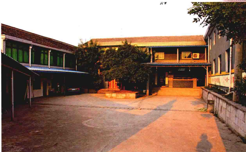
村两委会办公场所