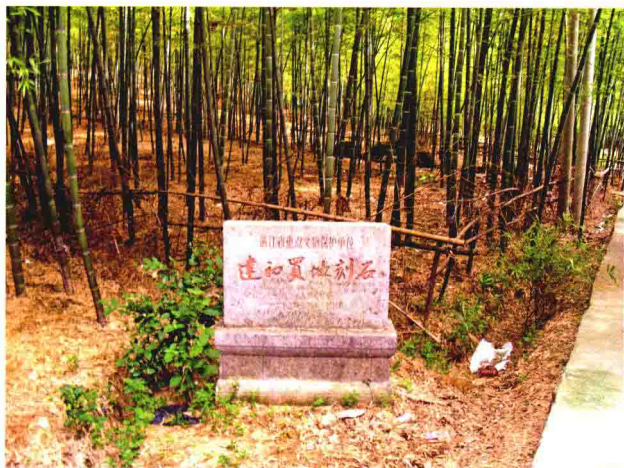
建初买地刻石所在地——乌石跳山