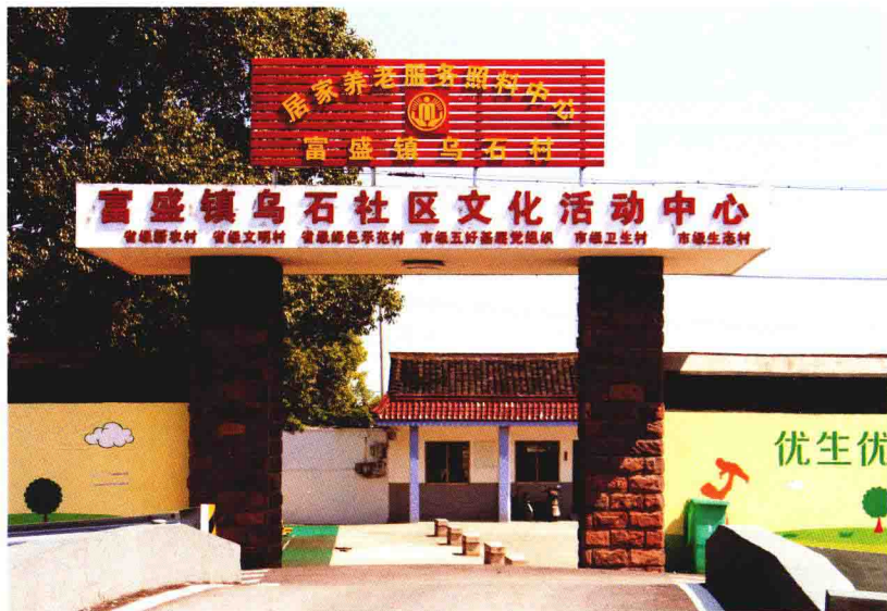
乌石社区文化 活动中心外景