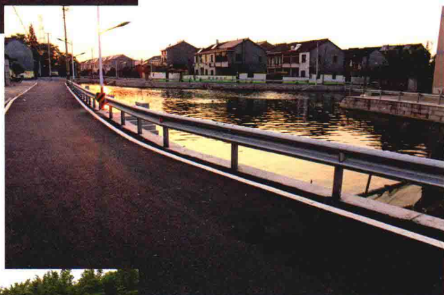
乌石村小桥头生活区(卢家)