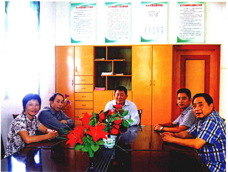
村两委会班子成员