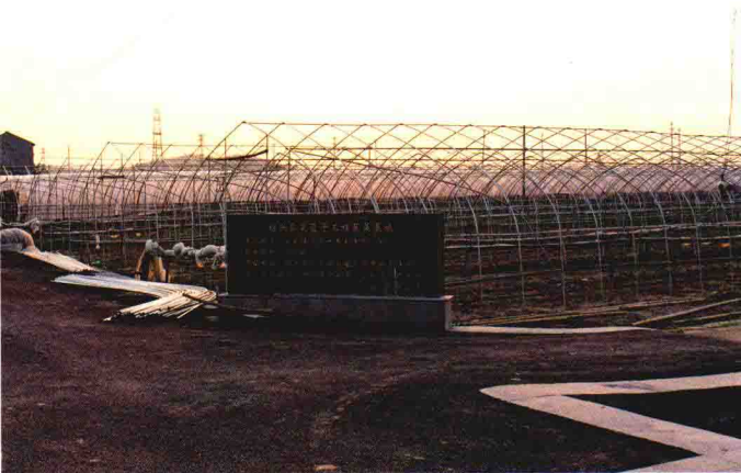
绍兴县菜蓝子工程蔬菜基地