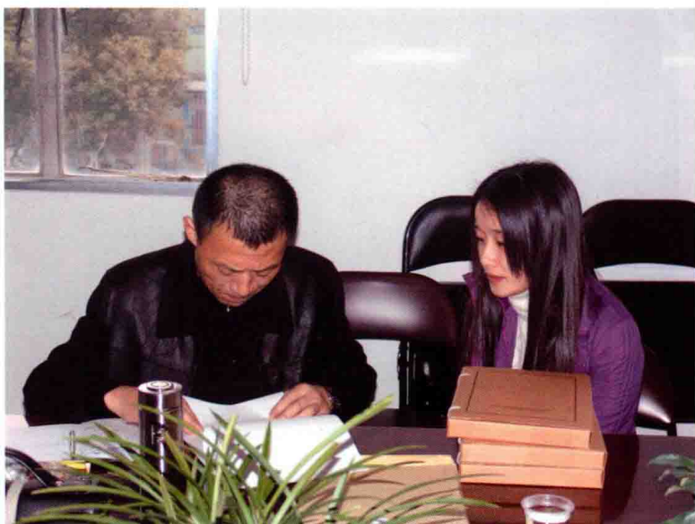
2006年12月14日, 余杭镇 村(社区)档案年检