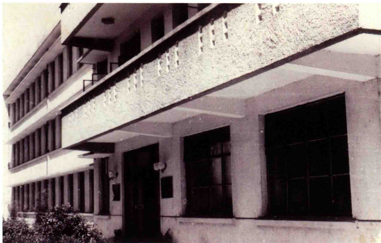
1984年6月建成的县档案馆建筑外景