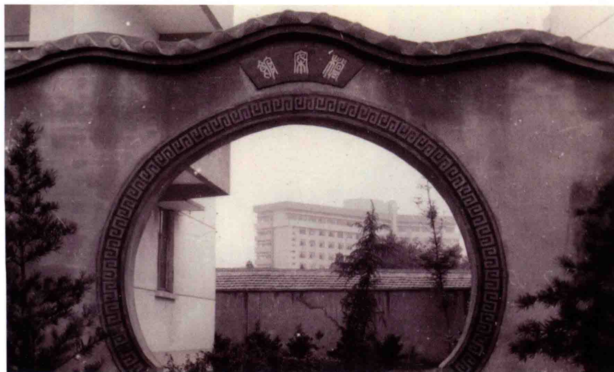
县档案馆圆形院门