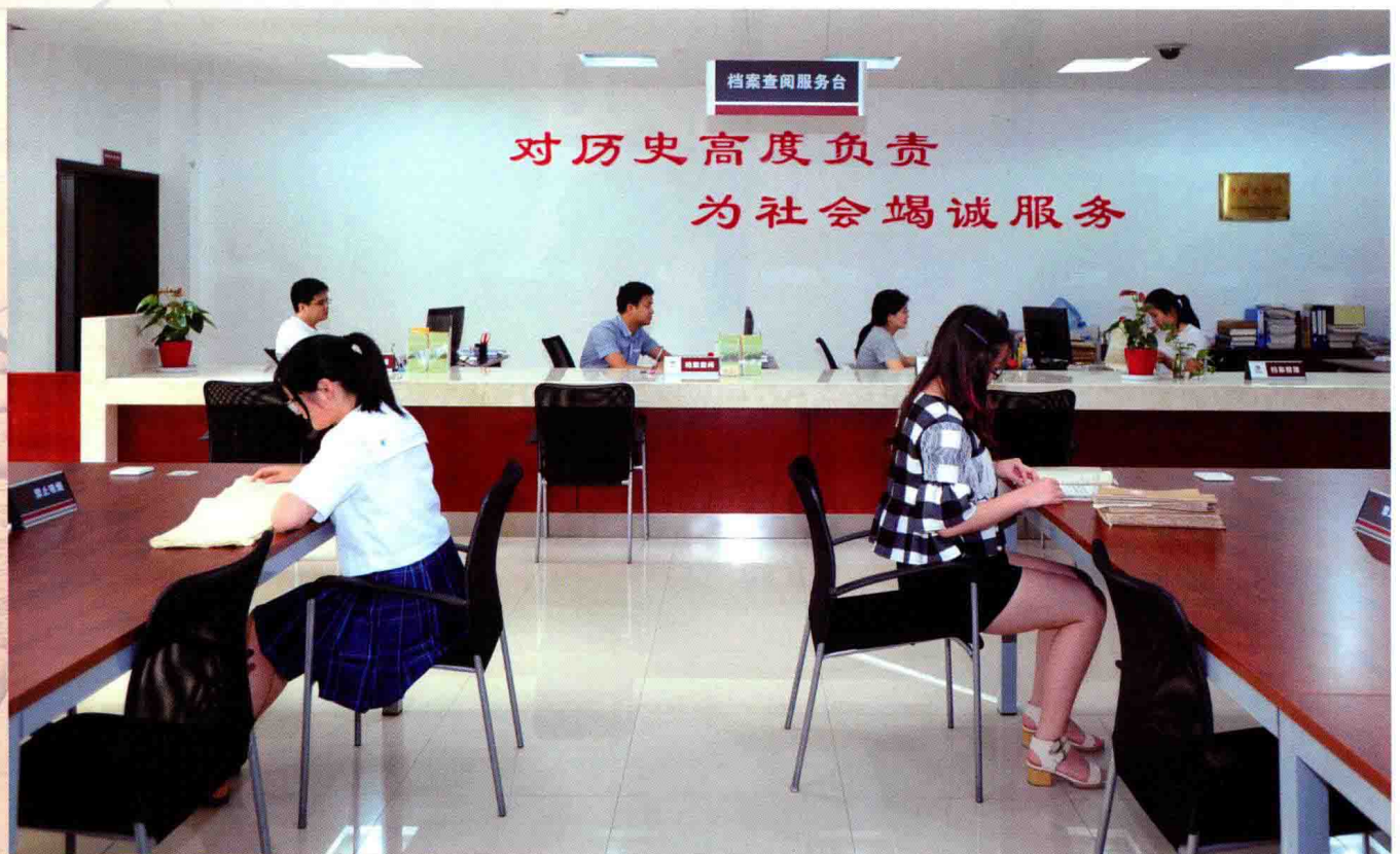
区档案馆查阅大厅(2015年)