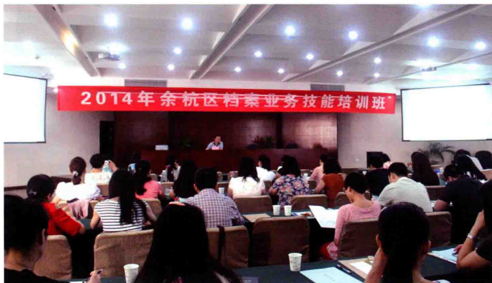
2014年6月, 余杭 区档案业务技能培训班