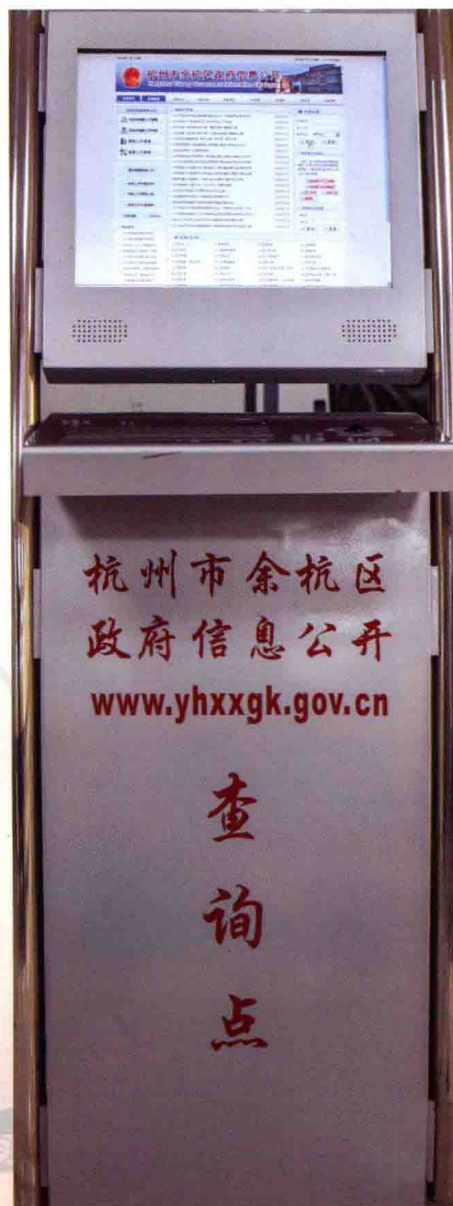
政府信息公开自助查阅机