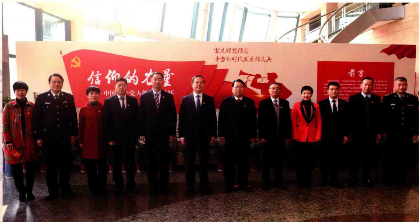
2018年1月30日，区委常委参观“信仰的力量”展览后全体合影