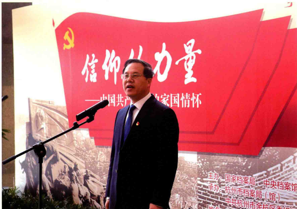
2018年1月30日，参观展览后杭州市委常委、区委书记毛溪浩发表讲话