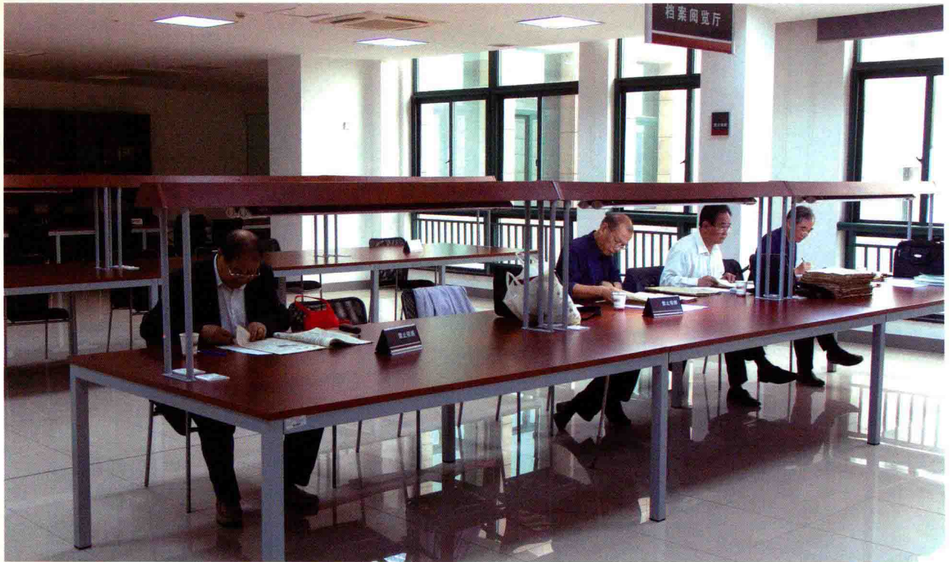
运河丛书编纂小组成员查阅档案(2011年)