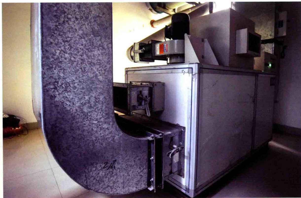
库房新风系统(新馆)