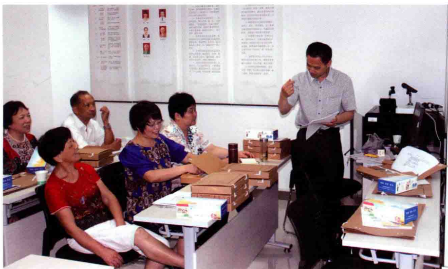
2014年6月13日, 在 塘栖水北社区开展家庭 建档讲座