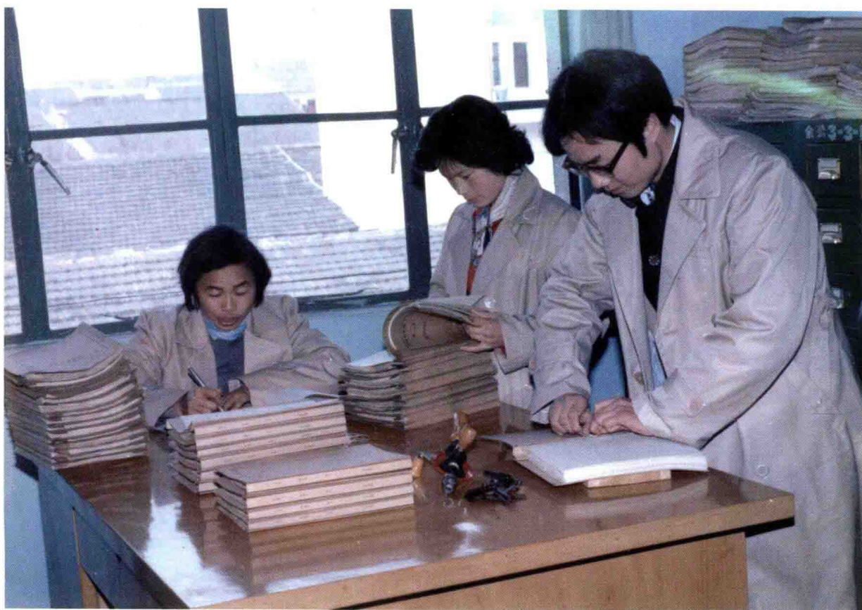
县档案馆工作人员在整理档案(1987年)