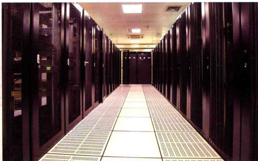
数据备份中心机房