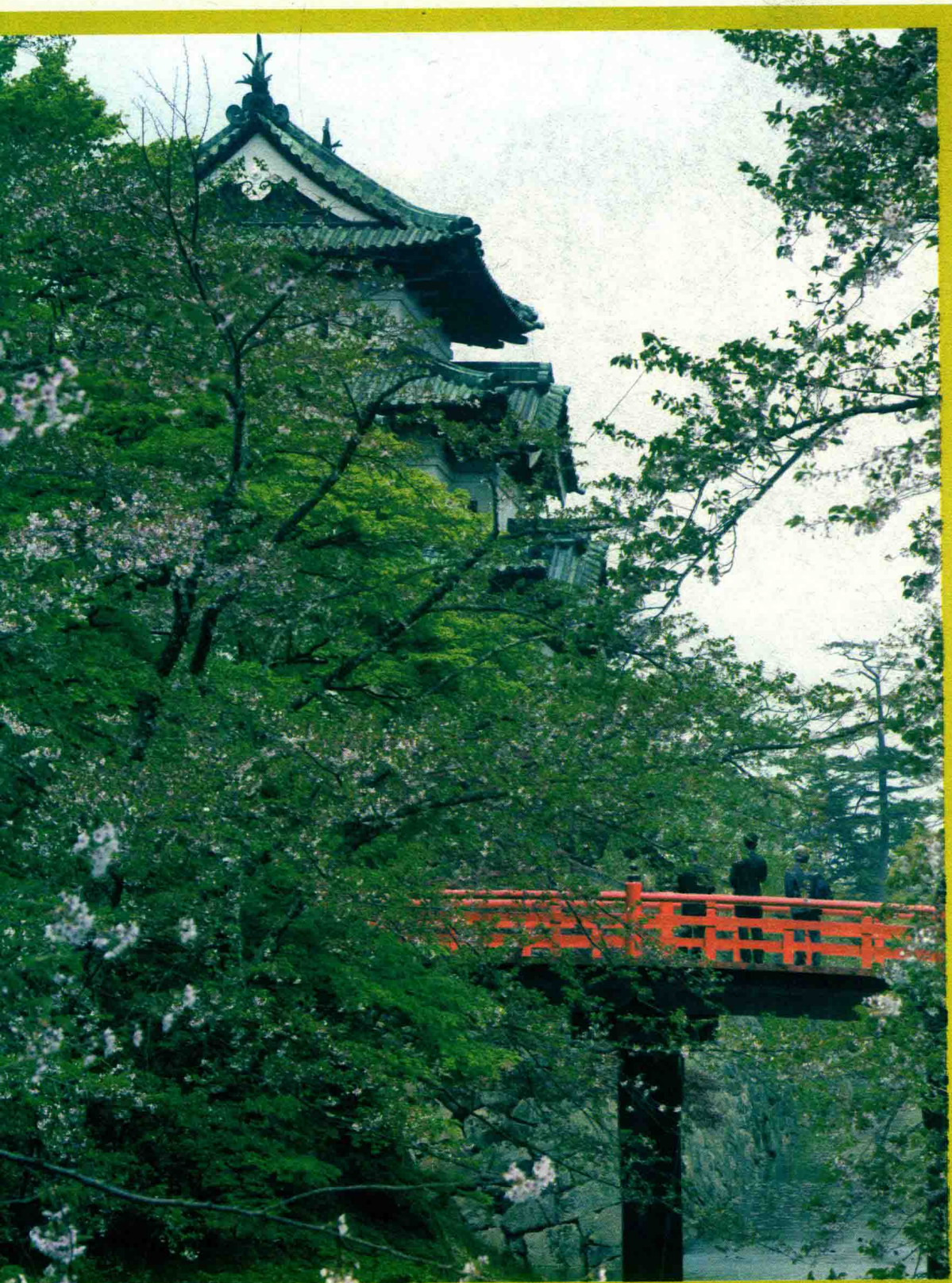
青森县弘前城公园