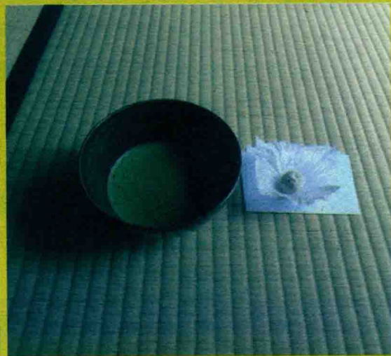
野村家屋敷茶室及抹茶点心

第一次在野村家屋敷的日式庭院阁楼茶庭里尝试了日式抹茶和点心，感觉茶很浓郁，味苦，但配上很甜的点心正好合适。茶座房间好小，特别是入口处的门，对于我来说太矮了一些。