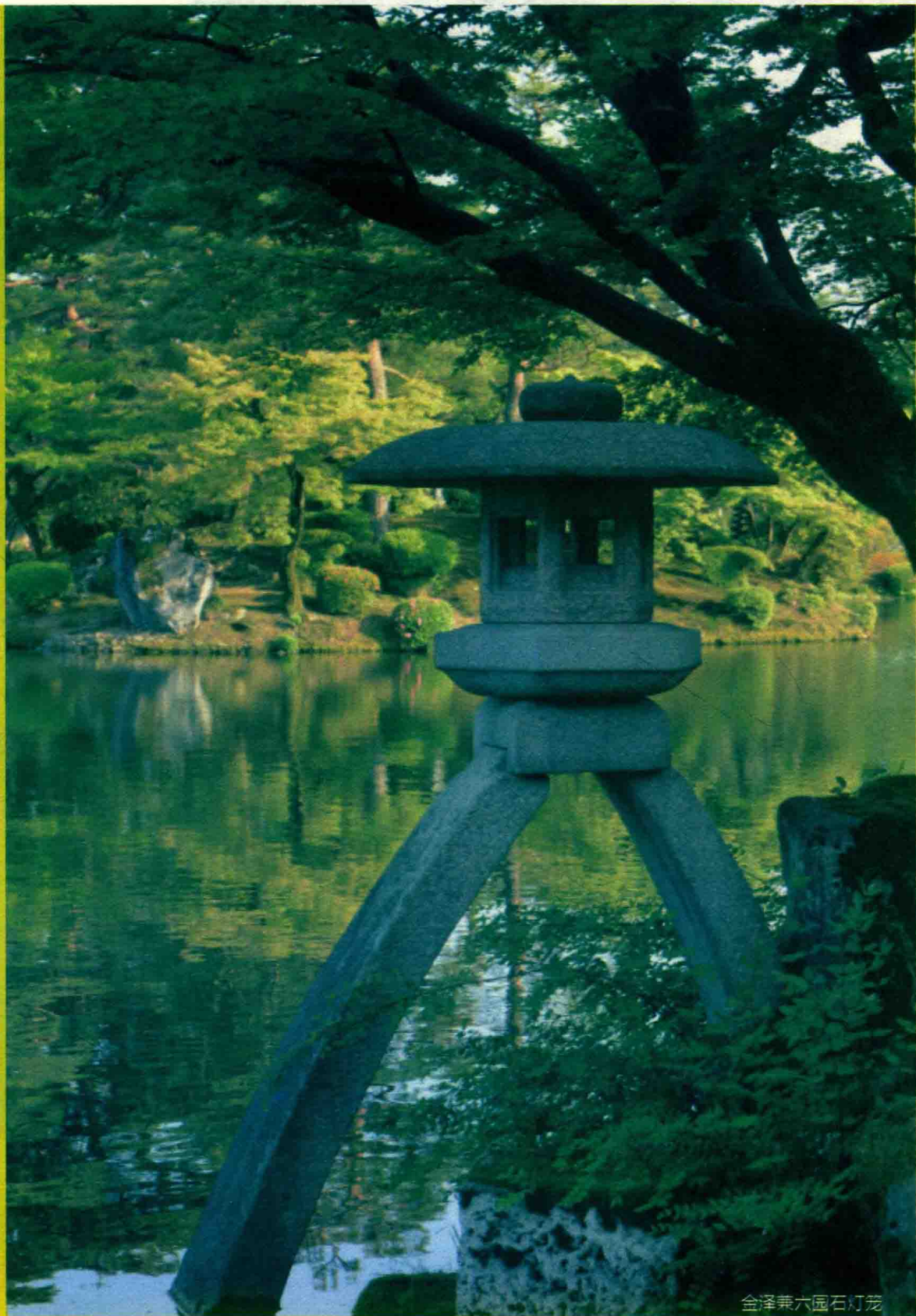
全澤兼六園石灯笼