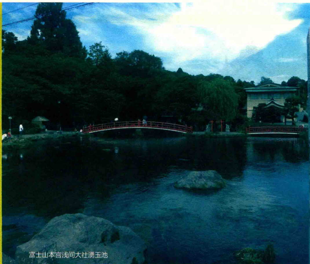
富士山本宮浅間大社湧玉池