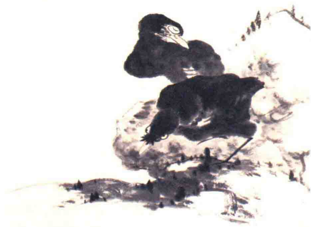
清 八大山人 《花鸟山水册》(之五)