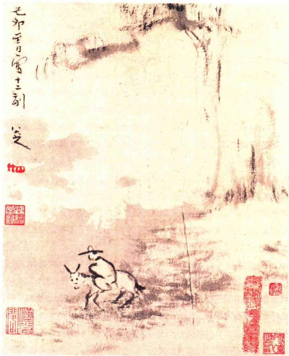
清 八大山人 《山水图册》(之十二)