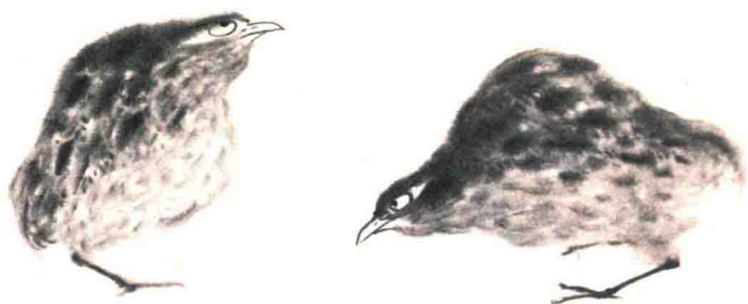
清 八大山人 《花鸟山水册》(之三)