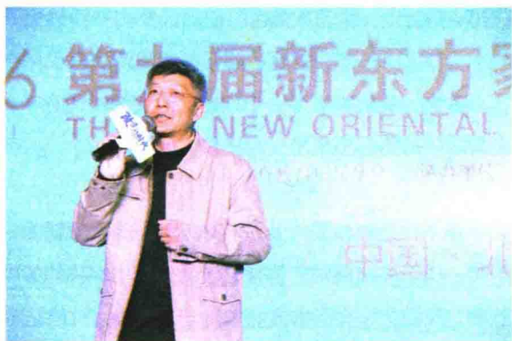
演讲人：秦春华 北京大学考试研究院院长