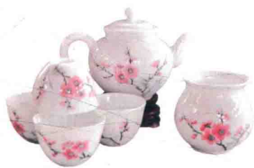
P 71 7501毛瓷翠竹红梅图案茶具套件