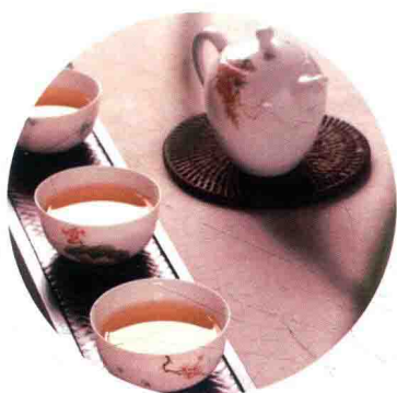
P 165 自慢堂精品粉彩茶具