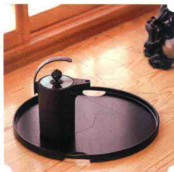
P215 黑川雅之IRONY艺术设计铁壶