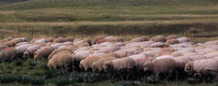
高山美利奴种公羊群

甘肃省绵羊繁育技术推广站于1957年制定育种计划开始培育细毛羊，1980年育成了甘肃高山细毛羊，并受到国务院嘉奖，1995年被正式列入《世界动物品种志》。甘肃高山细毛羊经过长期不懈的改良和培育，羊毛品质指标居国际先进、国内领先水平。新疆、内蒙古、西藏、青海4个地区30年间累积引入甘肃高山细毛羊10万多只，改良当地细毛羊1000多万只。育成甘肃高山细毛羊后持续不断对其品种进行选育升级，于2015年12月21日经国家畜禽遗传资源委员会审定通过又育成了高山美利奴羊，丰富了羊品种资源的结构。