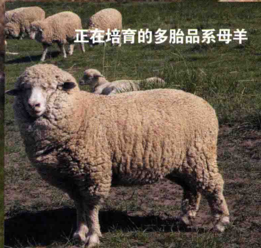
正在培育的多胎品系母羊