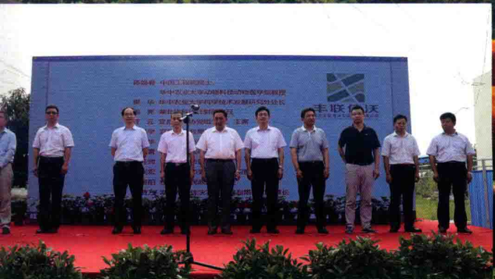
院士专家工作站正式挂牌成立