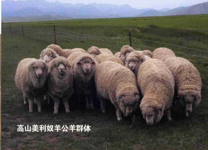
高山美利奴羊公羊群体