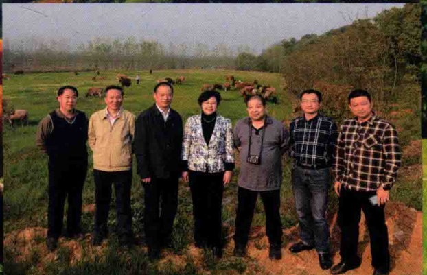
国家肉牛牦牛产业技术体系专家来宜调研