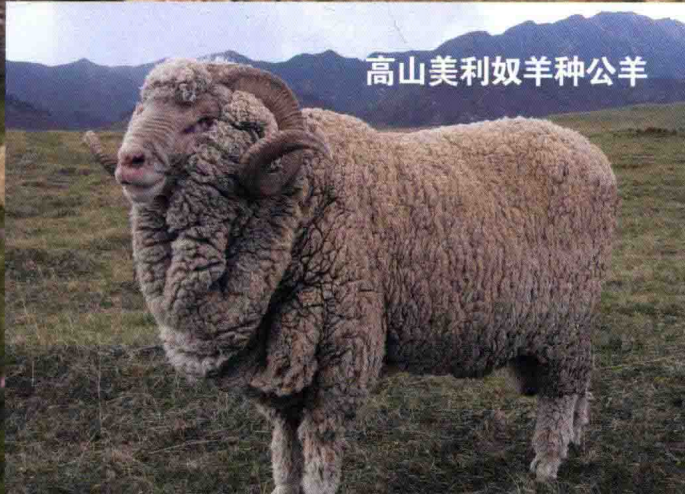
高山美利奴羊种公羊