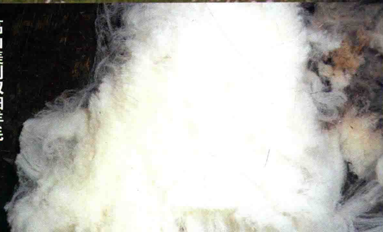
高山美利奴羊细羊毛

高山美利奴羊于2016年被农业部列为全国农业主导品种，国家绒毛用羊产业技术体系、中国农业科学院将其作为“十二五”标志性重大成果。由甘肃省绵羊繁育技术推广站主持完成的“高山美利奴羊新品种培育及应用”项目荣获甘肃省科技进步一等奖。