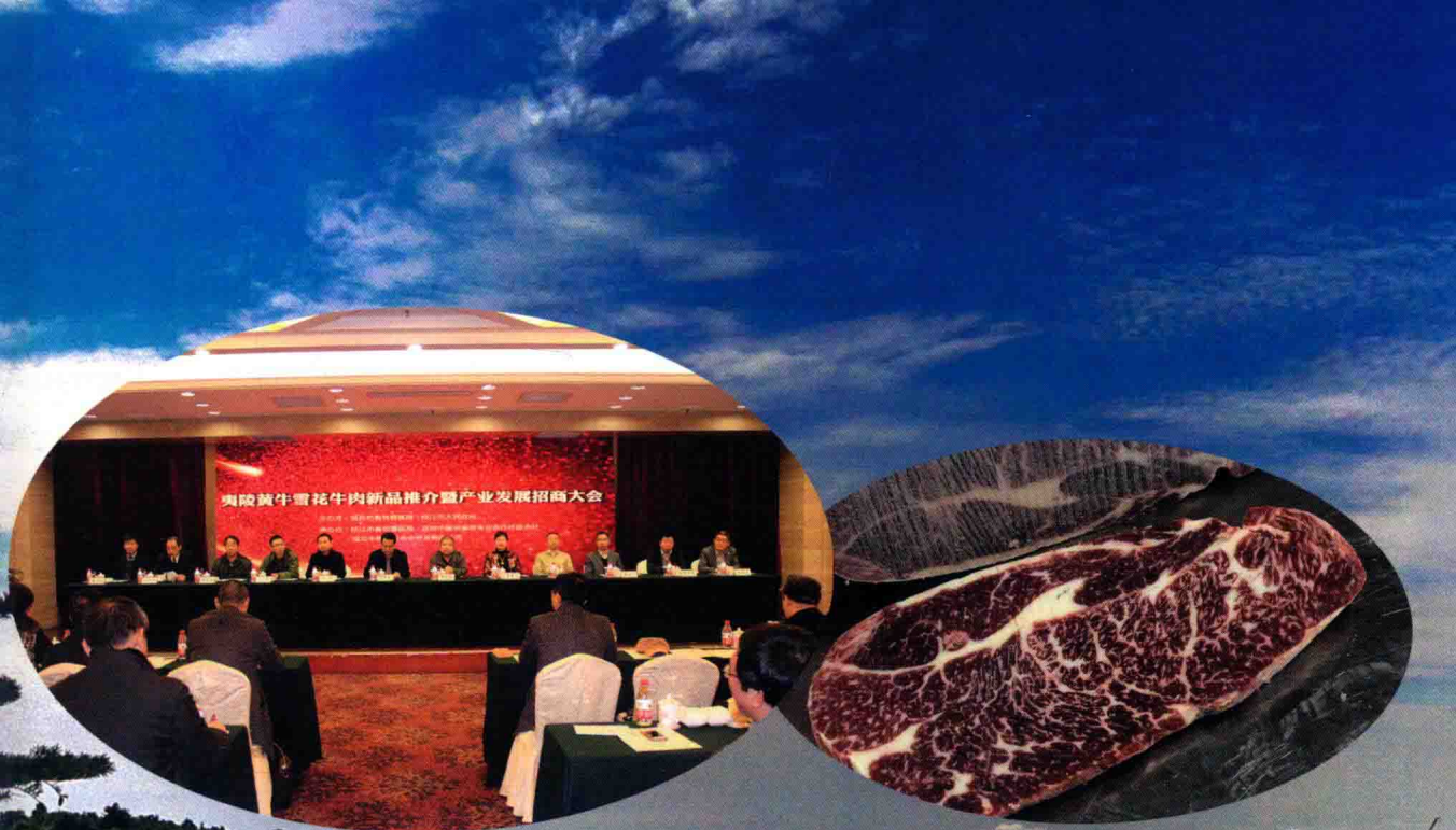
夷陵牛雪花牛肉新品推介暨产业发展招商大会