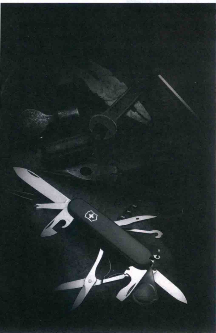
图1.2.2 《以一当十》本图片用富士F85便携式数码相机拍摄。感光度ISO100, 光圈5.3, 快门1/40秒, 光源为85W荧光灯加柔光罩