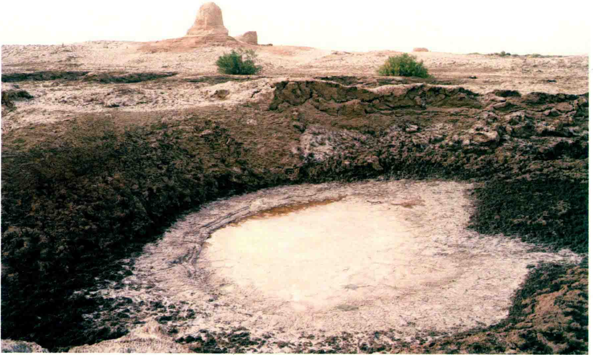
碱滩与古代烽火台, 甘肃瓜州, 2017