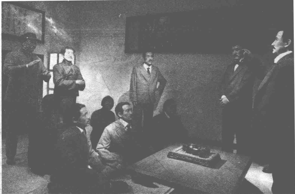
◎孙中山成立同盟会时的情景再现(塑像)

1911年10月10日晚，宁静的武汉上空一声枪响，武昌新军第八营的革命党人打响了武昌起义的第一枪。一夜之间，革命党人占领了武昌。三天之内，武汉三镇光复了。随后，武装反抗清政府的势力如春风吹遍大江南北、席卷长城内外，全国13个省份响应号召，宣布自治。这一年是中国的旧历辛亥年，这场革命被称作“辛亥革命”。