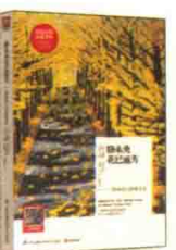
路未央花已遍芳——那些动人的英文诗 【英】威廉·华兹华斯 等著 9787553754628