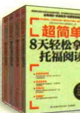
超简单轻松拿下托福考试 【韩】巴克志语言教育中心 著 9787553734675