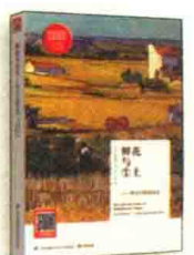
鲜花与尘土——泰戈尔哲理诗选 【印】泰戈尔 著 9787553754734