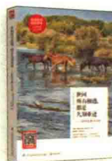
世间所有相遇，都是久别重逢——纪伯伦散文诗选 【黎巴嫩】纪伯伦 著 9787553754741