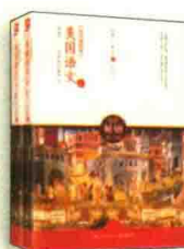
美国语文（双语插图版） 【美】威廉·H·麦加菲 著 9787214127600