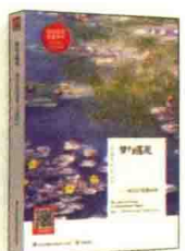
梦与莲花——泰戈尔浪漫诗选 【印】泰戈尔 著 9787553754727