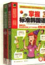
掌握标准韩国语2(全2册) 【韩】首尔大学韩国语文化教育学院教材开发部 著 9787553755915