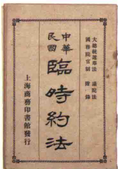
1912年3月颁布的《中华民国临时约法》是中国历史上第一部具有资产阶级共和国宪法性质的法典