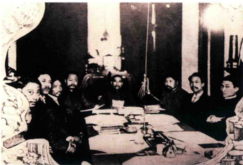
中华民国南京临时政府成立后，孙中山主持召开第一次国务会议，蔡元培出任第一任教育总长

1840年鸦片战争后，无数仁人志士在救亡图存的道路上艰辛探索，试图找到一条拯救中华民族于水火的发展道路。林则徐、魏源等人的“师夷长技以制夷”主张，太平天国洪秀全的“天朝田亩制度”，洋务运动中的“中体西用”，以及百日维新的变法思想，都无法改变中国的命运。孙中山领导的辛亥革命虽然推翻了清朝统治，建立了中华民国，制定了