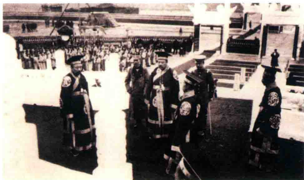
袁世凯在天坛 举行祭天活动，为 复辟帝制造势

具有资产阶级共和国宪法性质的《中华民国临时约法》，但最终也没有改变中国半殖民地半封建的社会性质。近代以来，“中国人向西方学得很多，但是行不通，理想总是不能实现” ① 。人们曾以为足以救亡并使中国起衰振弱的种种措施都尝试过，结果都不能解决中国的任何实际问题。以袁世凯为代表的北洋军阀政府上台后，中国陷入更加痛苦的水深火热之中。