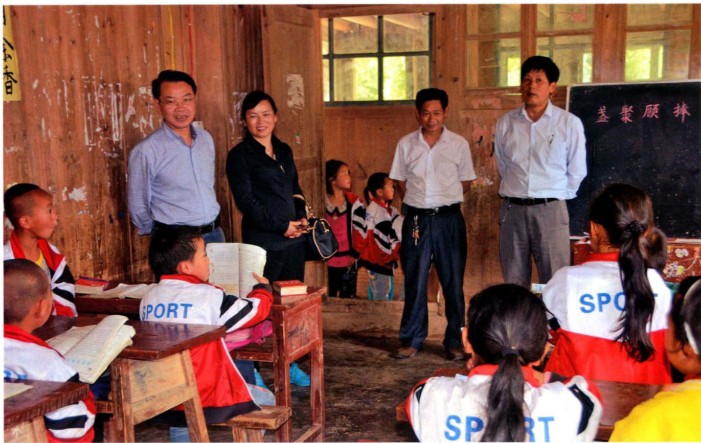
州教育局长贺代明、副县长金文凤在局长杨胜成的陪同下深入村级小学看望学生。