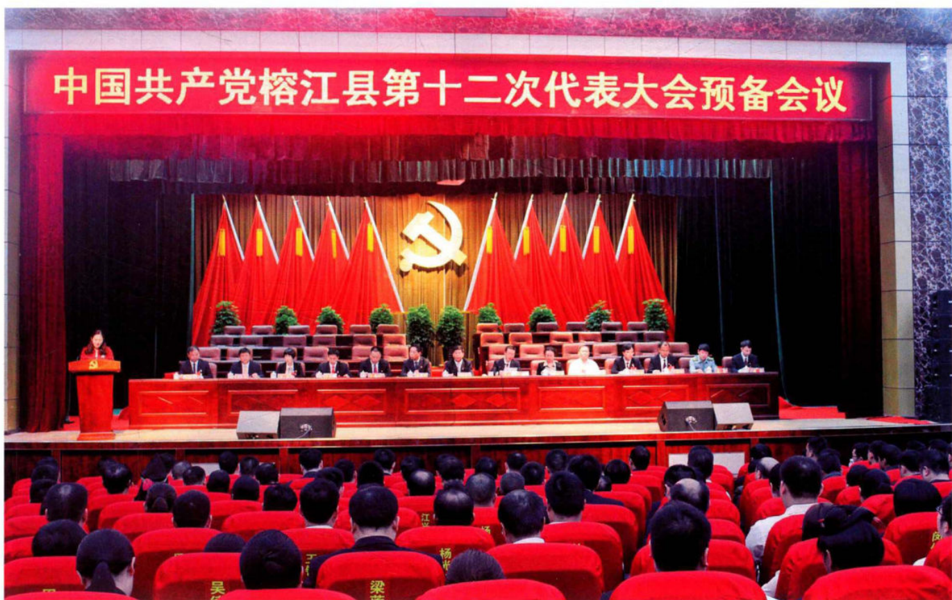
中国共产党榕江县第十二次代表大会预备会议。