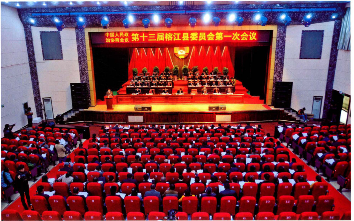
政协榕江县第十三届一次会议开幕式。