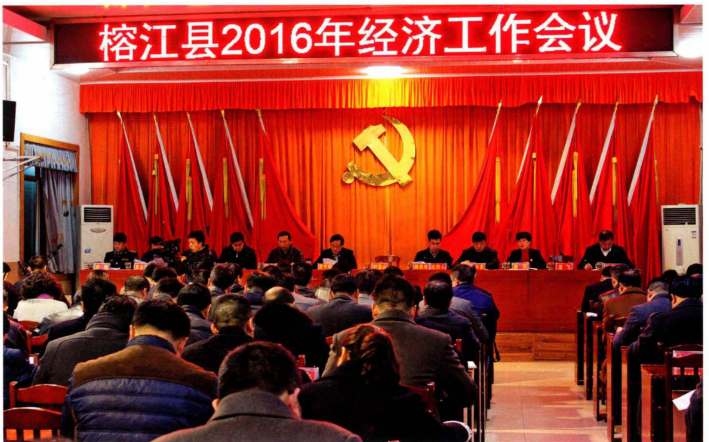
县委书记贺代宏出席榕江县2016年经济工作会议。