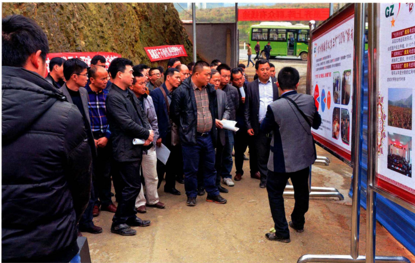
县长侯美彪到古州镇听取脱贫工作介绍。