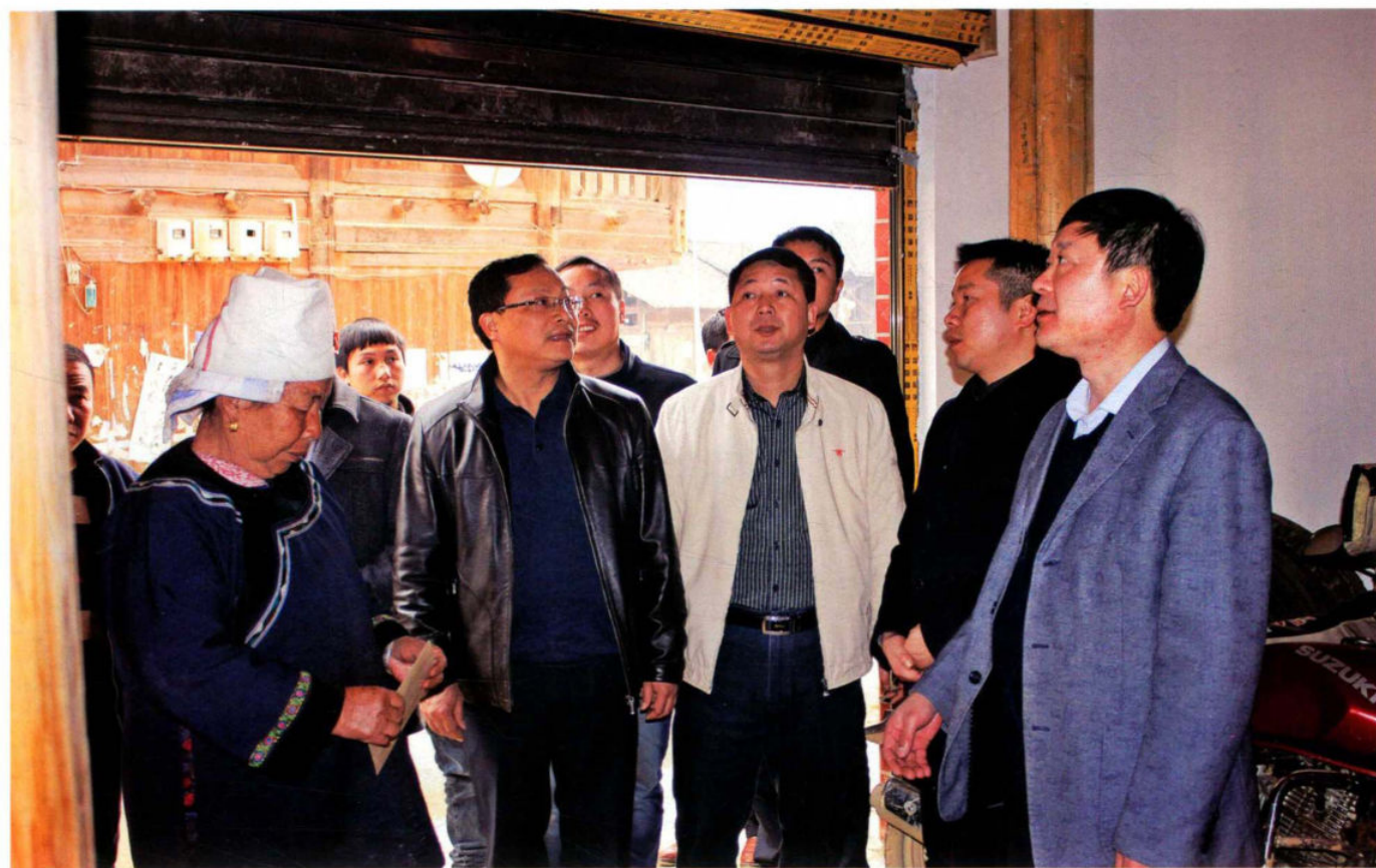
县长李昌钦到水尾乡调研。