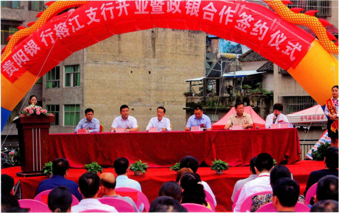
县委书记贺代宏出席贵阳银行榕江支行开业暨政银合作签约仪式。