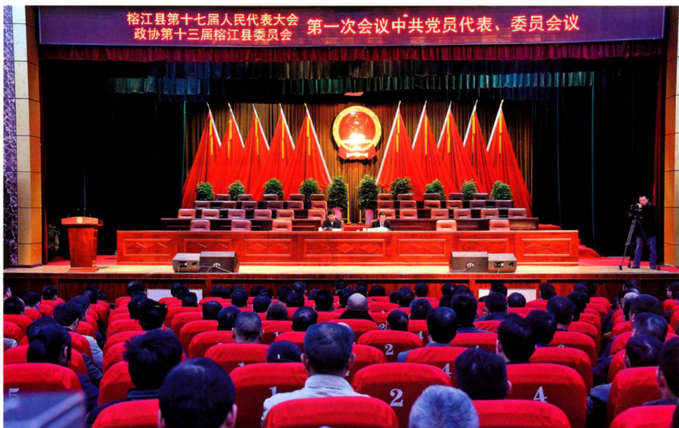
2016年11月26日召开榕江县第十七届人民代表大会、政协第十三届榕江县委员会第一次会议中共党员代表、委员会议。