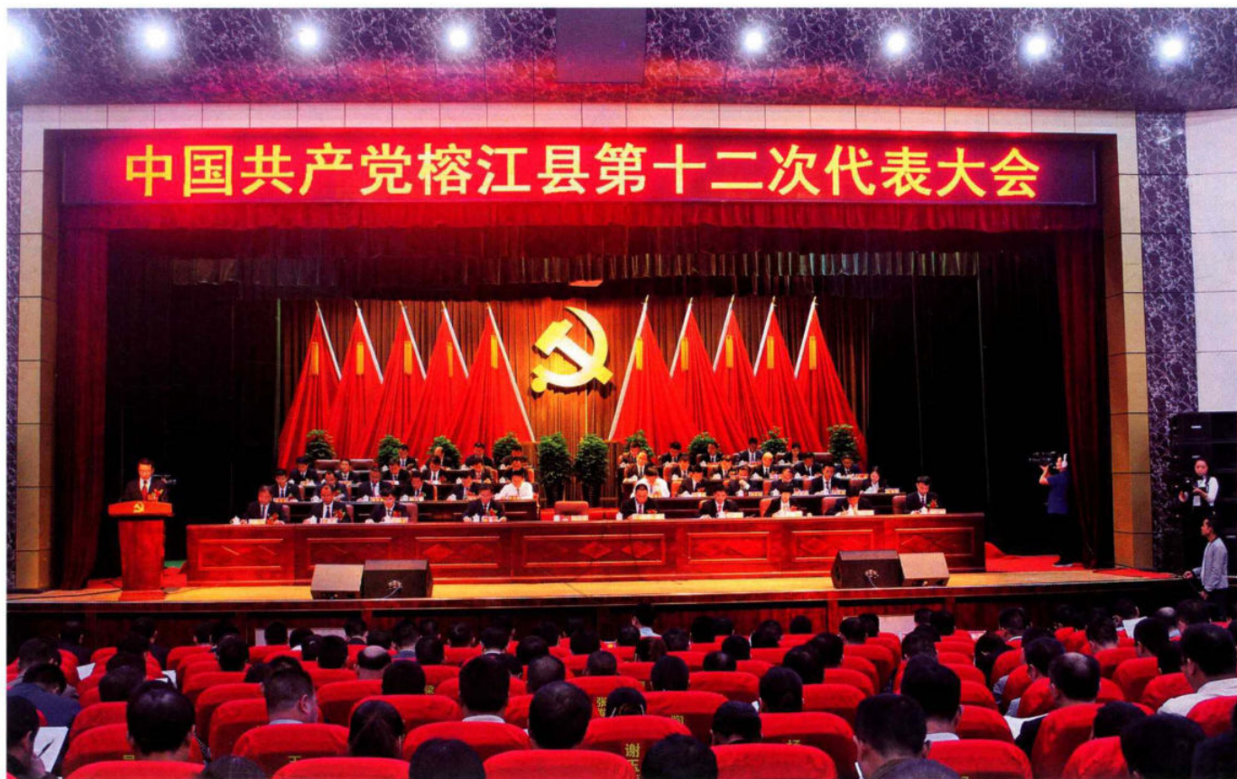
中国共产党榕江县第十二次代表大会。