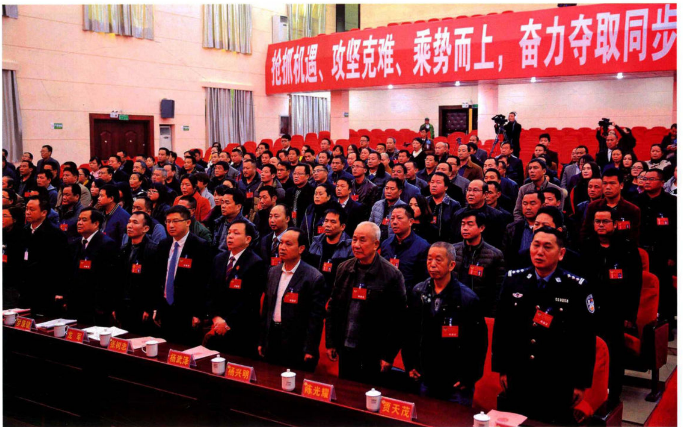
政协榕江县第十三届一次会议开幕式（主席台下）。