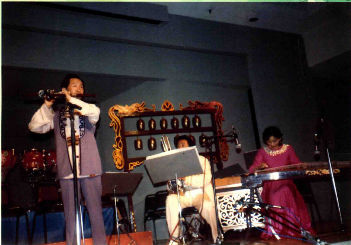
1984年，王铁锤在美国演出