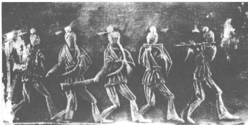
由左至右：汉砖雕刻，鼓 笙 笙 角 角 排箫 横吹

竹笛在汉魏六朝时称“横吹”。“横吹”是以鼓、横笛、排箫、笙、角等合奏音乐的一种形式，因常用“横吹”（笛）作为主奏乐器而称“横吹”乐队。下图为河南省新通桥发掘出土的汉代空心砖刻“横吹”乐队演奏图。