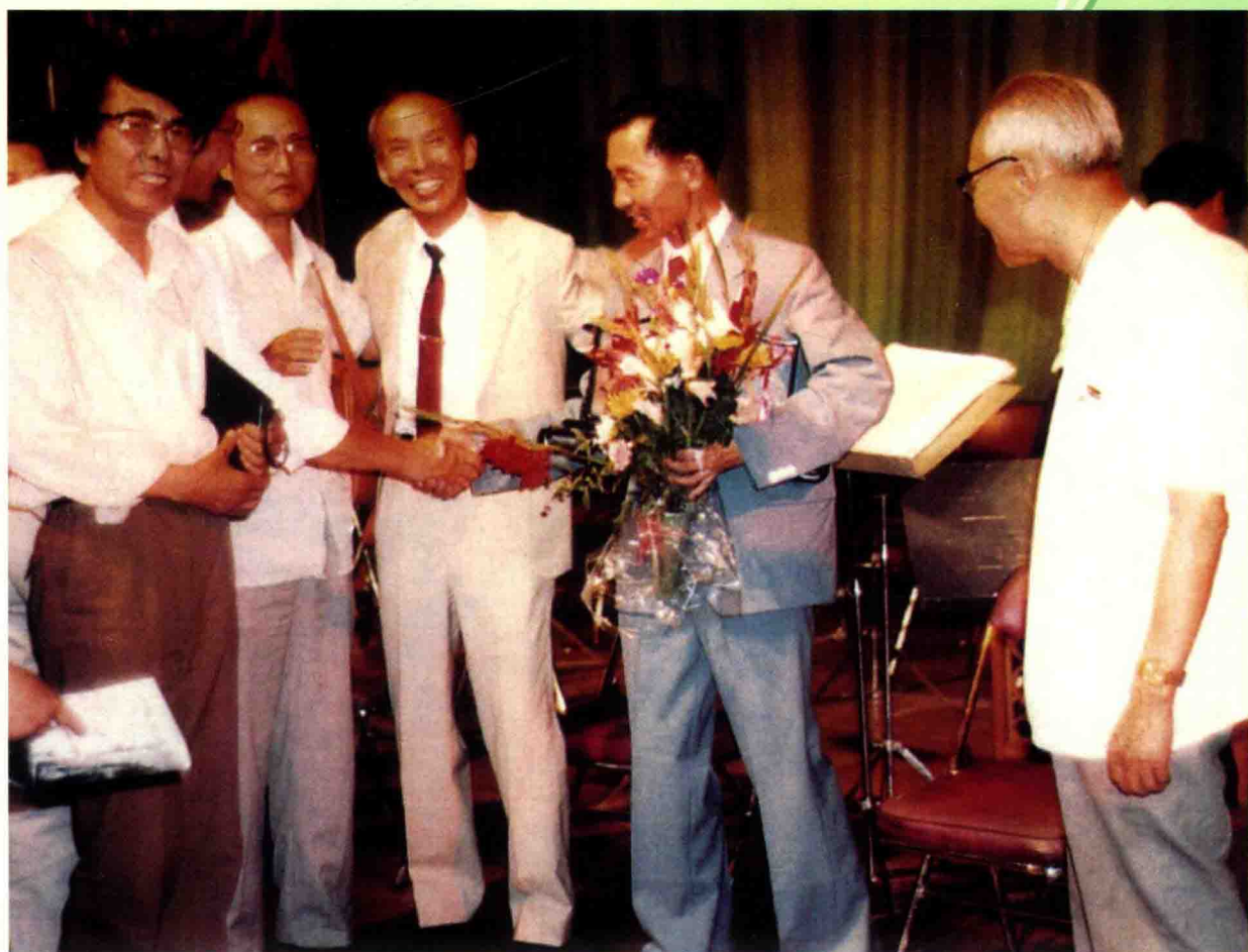
1986年，王铁锤独奏音乐会后，著名笛子演奏家陆春龄、古筝演奏家曹正、作曲家刘文金上台祝贺演出成功