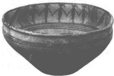
图 1-3 青海出土的舞蹈纹彩陶盆

画家、民俗学者靳之林通过对中国民间艺术和民间风俗的研究，发现彩陶上的图像就是流传在黄土高原民间剪纸中的抓髻娃娃——中华民族的保护神与繁衍之神。他说道：