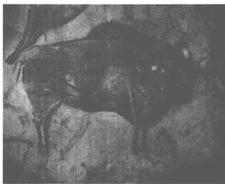
图 1-2 西班牙阿尔塔米拉洞穴的野牛图

然而，所谓艺术起源的模仿说注重的是艺术的表层形象，缺乏对艺术本质与社会功能的探索，只能从某一层面对原始艺术进行阐释。例如，中国西安半坡出土的彩陶上的双鱼（图 1-1），如果只是对生活的模仿，那仅仅只看到了艺术的表象，而没对艺术本质进行关照。