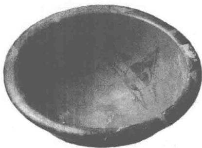
图 1-1 西安半坡出土的双鱼人面彩陶盆

模仿说在中西方艺术史上都产生过巨大影响。这一学说对解释人类早期的原始艺术有一定合理性。比如属于史前洞穴艺术的雷·空巴莱尔洞穴中上百个绘画形象，包括：马 116 匹，野牛 37 头，熊 19 只，驯鹿 14 只，羊 9 只，狼 4 只，狐狸 1 只以及 39 具人体。 ② 这些动物和原始人的日常生活息息相关，不是他们的食物来源，就是他们生命的威胁。因此从某种意义上说，模仿说有一定道理。