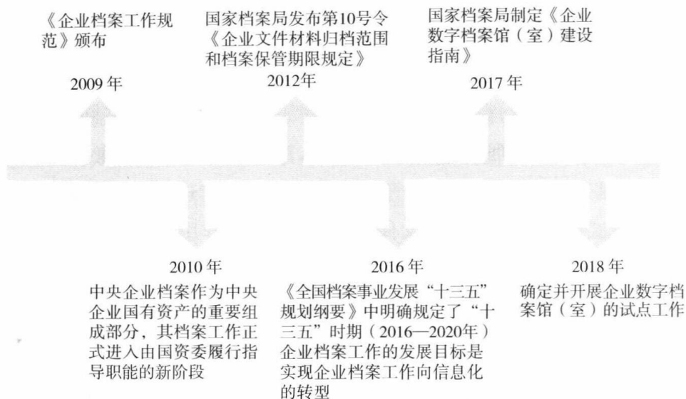
图 0-2 近十年我国企业档案工作发展关键时间节点图

存价值的企业文件。企业文件伴随企业活动而生,是事务处理的工具,是活动过程的记录;有价值的企业文件归档保存形成企业档案。企业文件与档案因其产生和形成过程而蕴含了“事务处理”和“活动过程”中不同表现形式以及不同形态的数据、信息、知识,文件与档案也凝聚了特殊的信息价值、工具价值、凭证价值。当前,从整个社会到组织,再到个人,对文件与档案价值的认识在深度、维度、力度等方面存在一定的不够深入、不够全面等表现。然而,企业文件与档案对于数据时代企业知识共享的实现具有不可替代的作用。