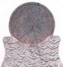
板芙金钟山郊野公园