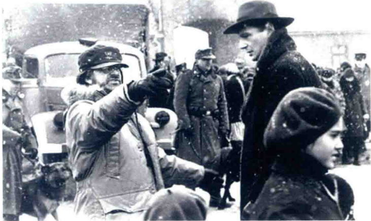
电影制片人、导演斯皮尔伯格在片场

美国的主流电影是商业电影，它的制作是符合商品特性的。在这种商业体制下，执行电影商品性的核心权力人物就是制片人。制片人会根据观众的需求，根据当时社会人们的心理