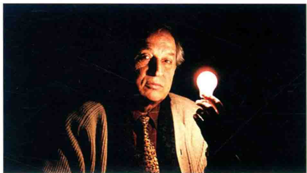
电影摄影大师 斯托拉罗

这似乎同样暗示了在电影业高度发达的美国，除了技术和艺术发展对电影摄影创作的影响至关重要之外，电影的产业发展和它的商品本性对电影摄影创作的影响同样不可忽略。依此看来，电影史并不只是电影的历史，而美国电影摄影发展变革的真正动因也不仅仅是技术的进步和电影本体美学的发展，美国电影摄影创作实际上是受美国电影产业影响的，有的时候是决定性的影响。例如在90年代，电影摄影大师阿尔芒都和斯托拉罗退出了主流电影摄影舞台，后期拍摄作品都为低成本电影，这就是受90年代美国电影产业变化影响的结果，在本书的90年代部分我们会详细论述相关问题。美国电影产业在60年代确立了制片人制，制片人拥有主流影片生产流程的一切最终权利，这是不能回避的事实，而电影摄影精英作品全部产生于主流大制作影片中，所以研究美国电影摄影精英的历史，就不能摆脱对美国电影产业发展的研究，这也是本书的一个新的研究视点。希望通过新的角度去发现美国电影摄影创作众多现象后面存在的问题本质。