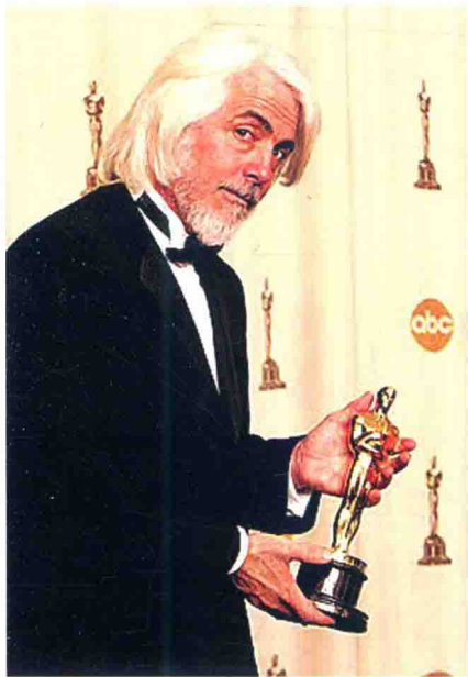
电影摄影师 理查德森

从史学的角度来看，研究美国当代电影摄影史就是研究美国电影摄影精英的历史。本书将选取被普遍认同最具影响力的美国奥斯卡最佳摄影奖名单中的作品作为研究对象（美国在1927年便设立了这个由美国电影艺术与科学学院颁发的奖项），并从这个具有权威性的名单里，窥见美国电影摄影史的诸多规律和现象。