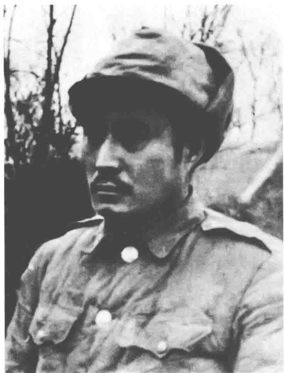
国民党第十二兵团中将副司令官黄维