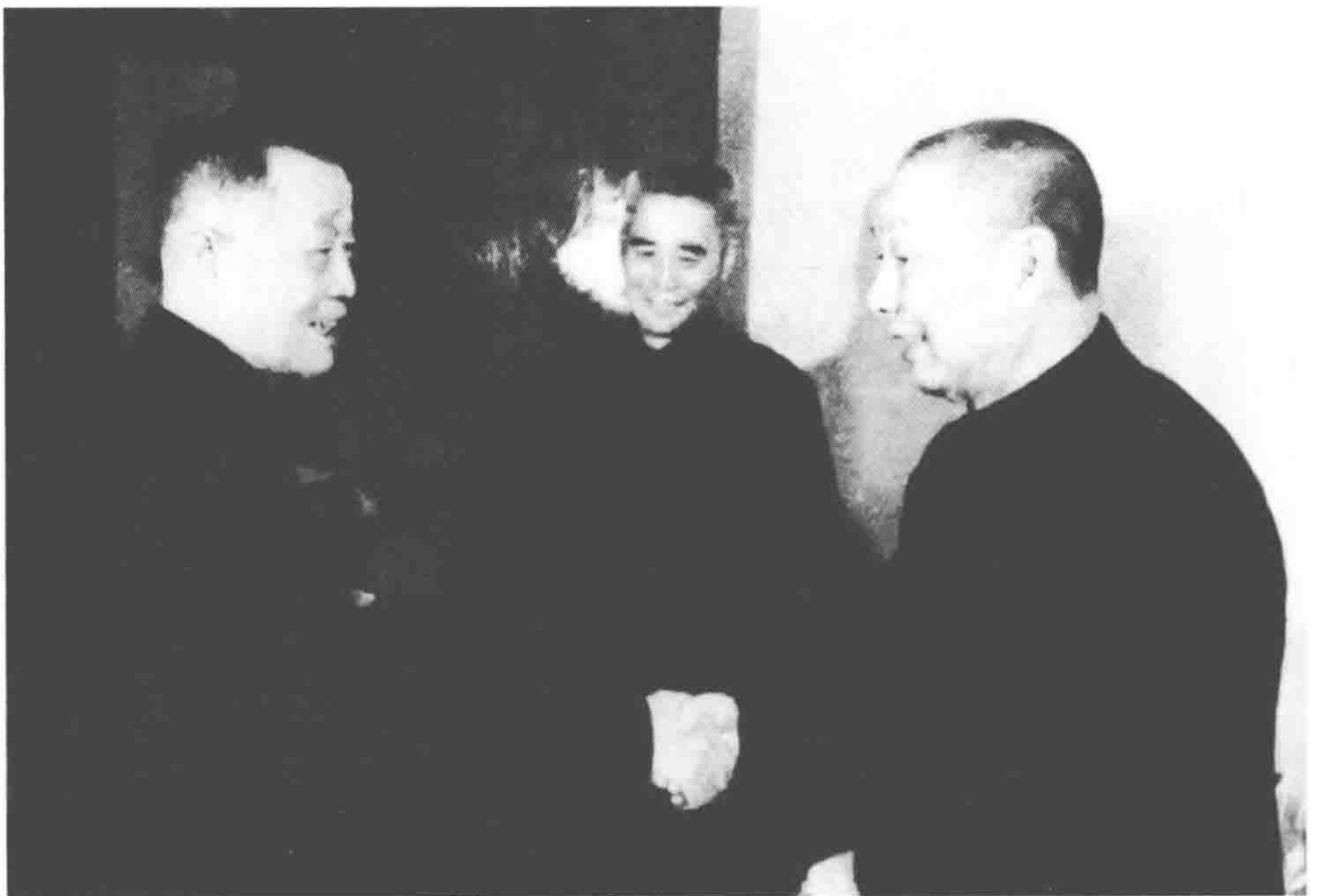
全国政协原委员杜聿明（左）会见新被特赦的黄维（中）和李九思（右） （一九七五年三月）