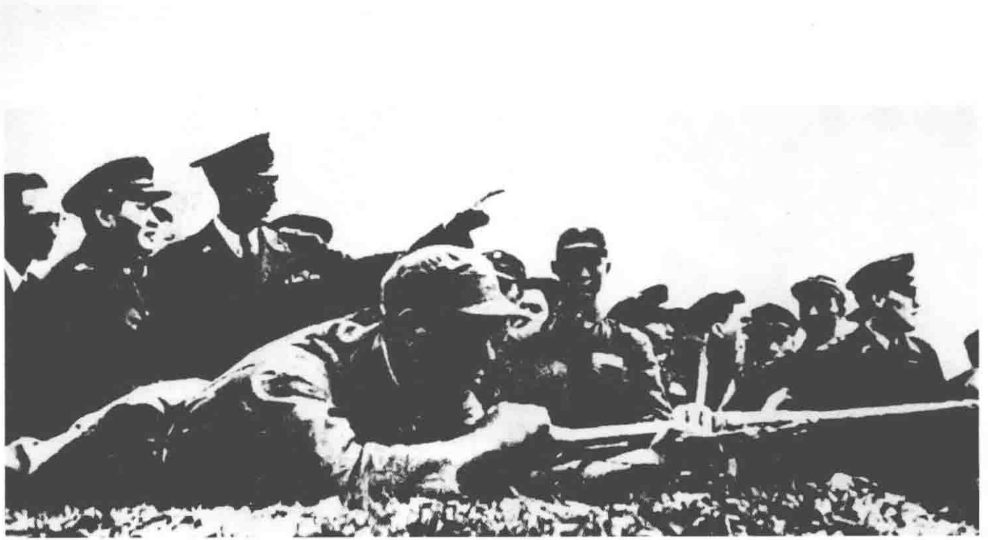
美国军官帮助国民党军训练