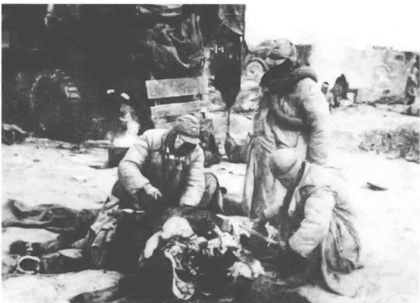
国民党军被解放军围困在陈官庄地区，靠宰杀骡马充饥。