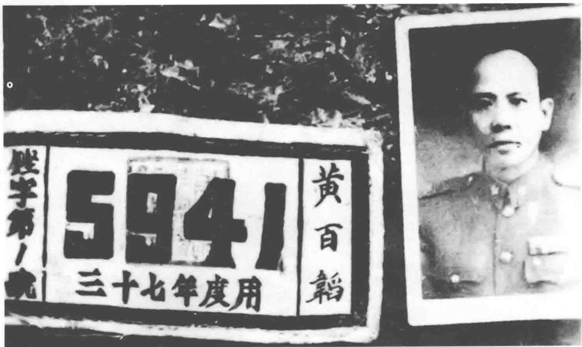
国民党第七兵团中将司令官黄百韬