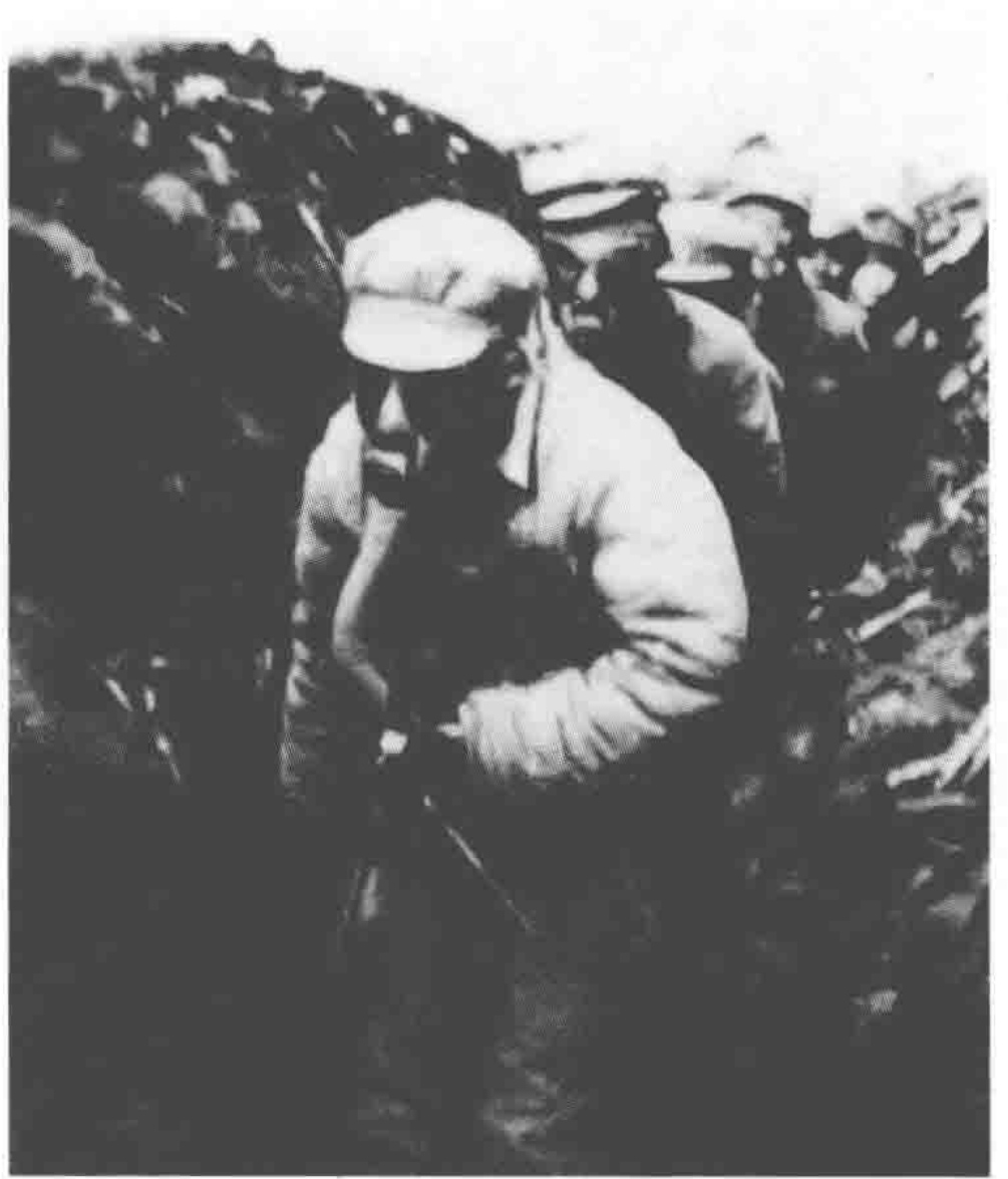
国民党军施放毒气，解放军被迫戴 上了防毒面具。