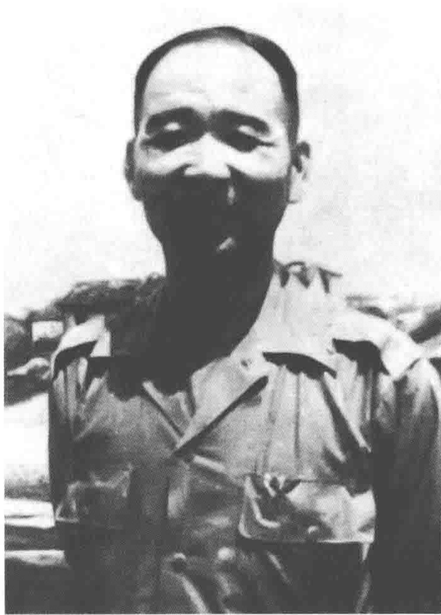
国民党第十二兵团中将司令官胡璉