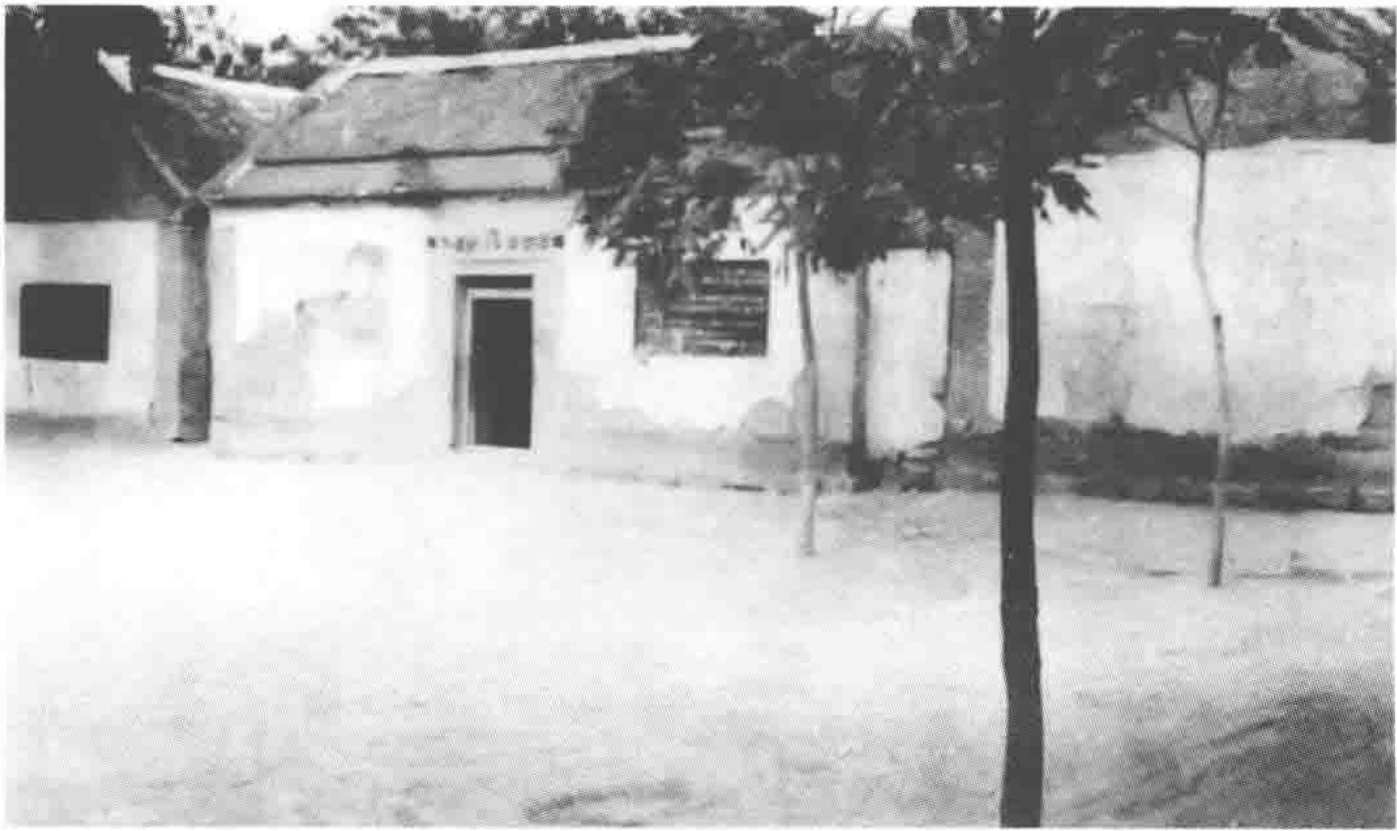
国民党徐州“剿总”前进指挥部旧址（河南省永城县陈官庄，现为小学校）