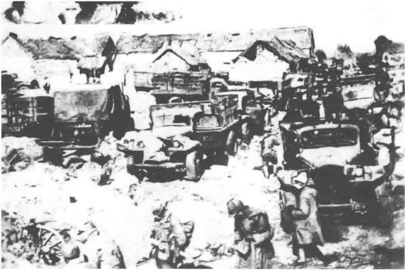
国民党第七兵团在碾庄圩地区全军覆没