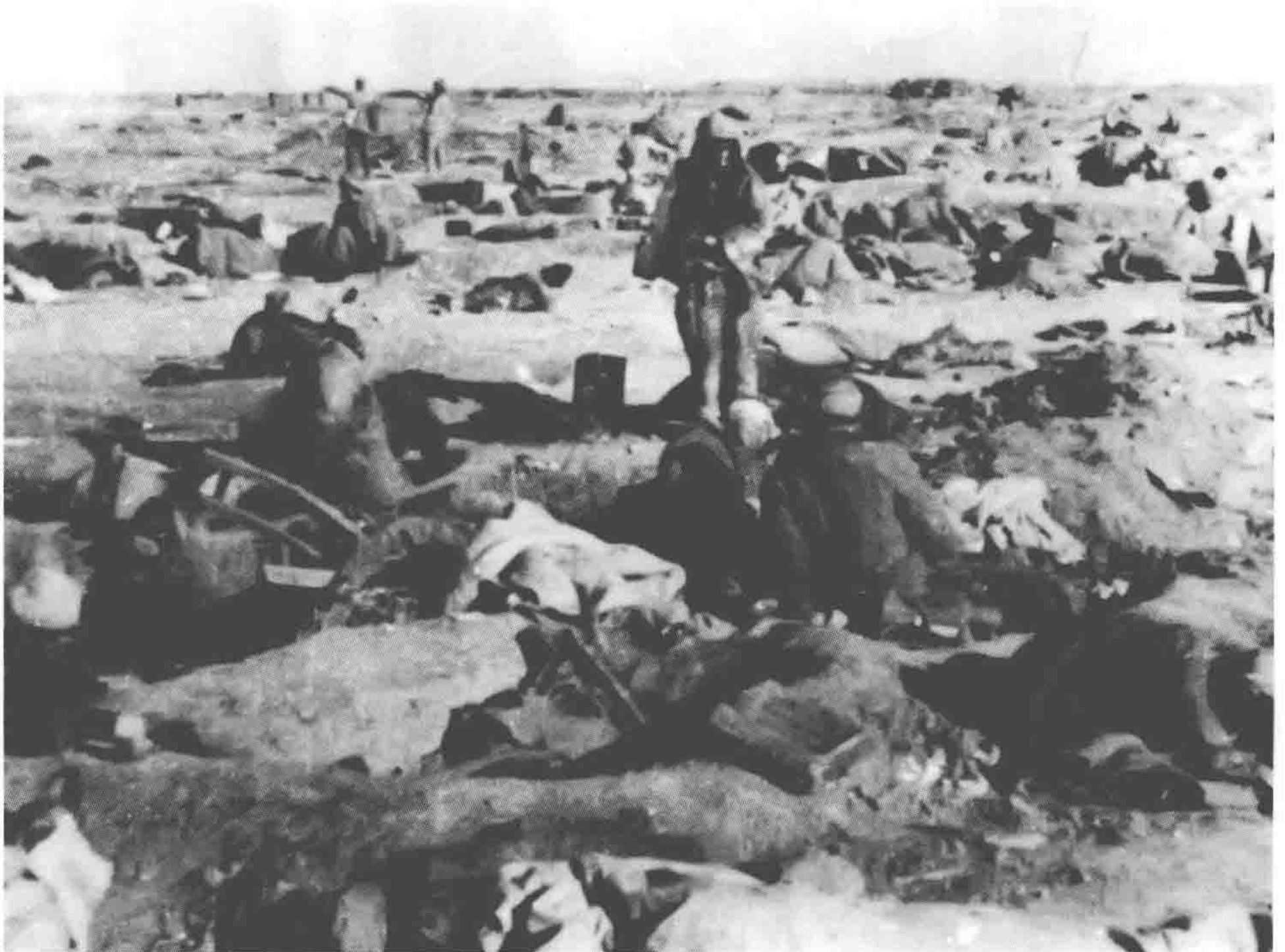
黄维兵团的野战医院