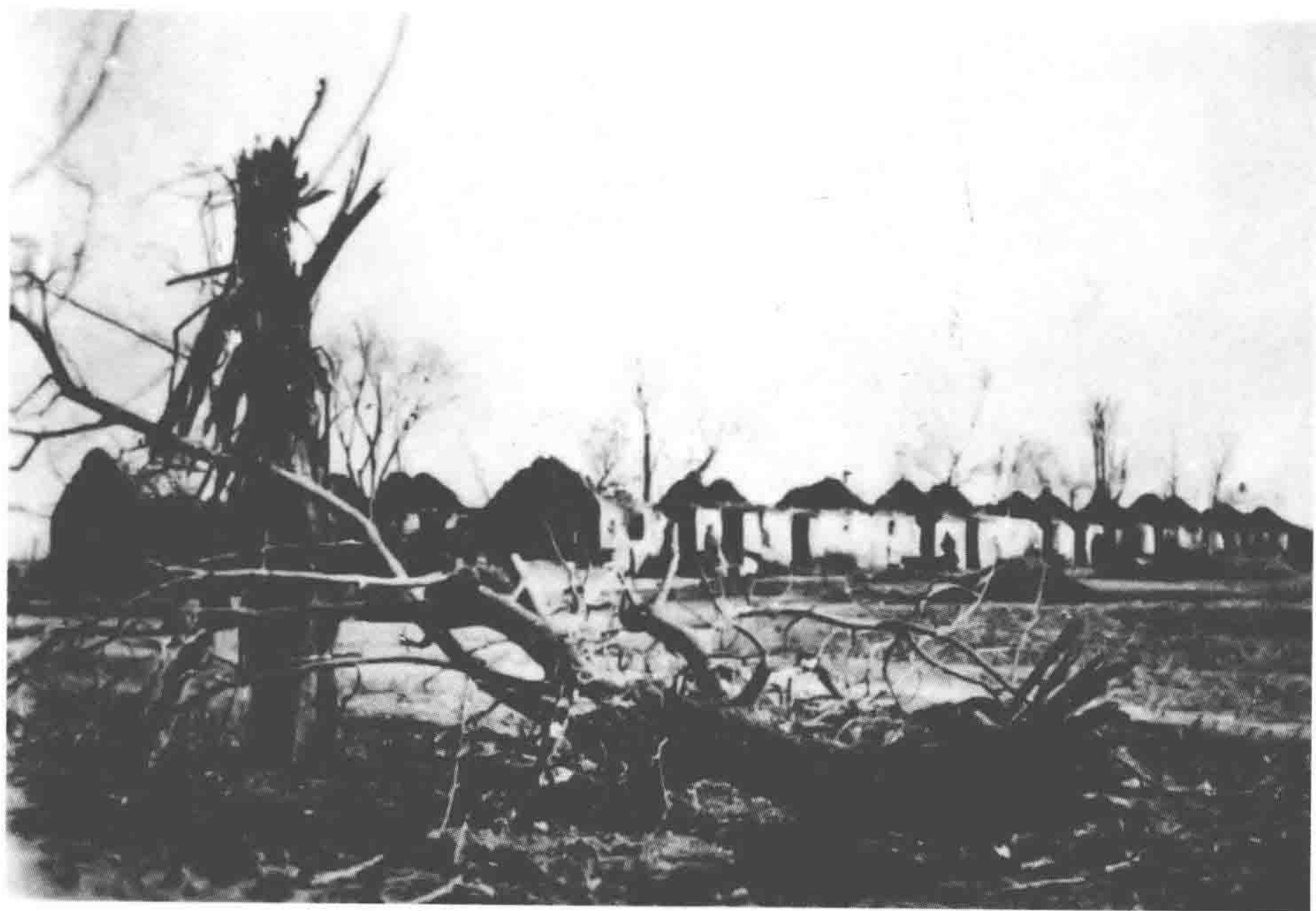
国民党军无柴烧，老百姓房屋遭殃。