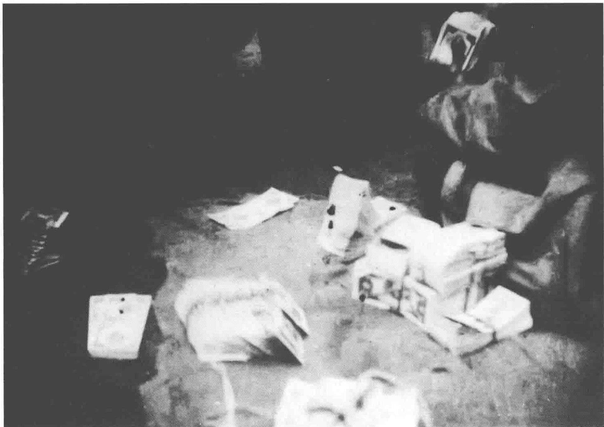
蒋介石靠空投金圆券鼓舞士气，国民党兵渴望的却是一顿饱饭。