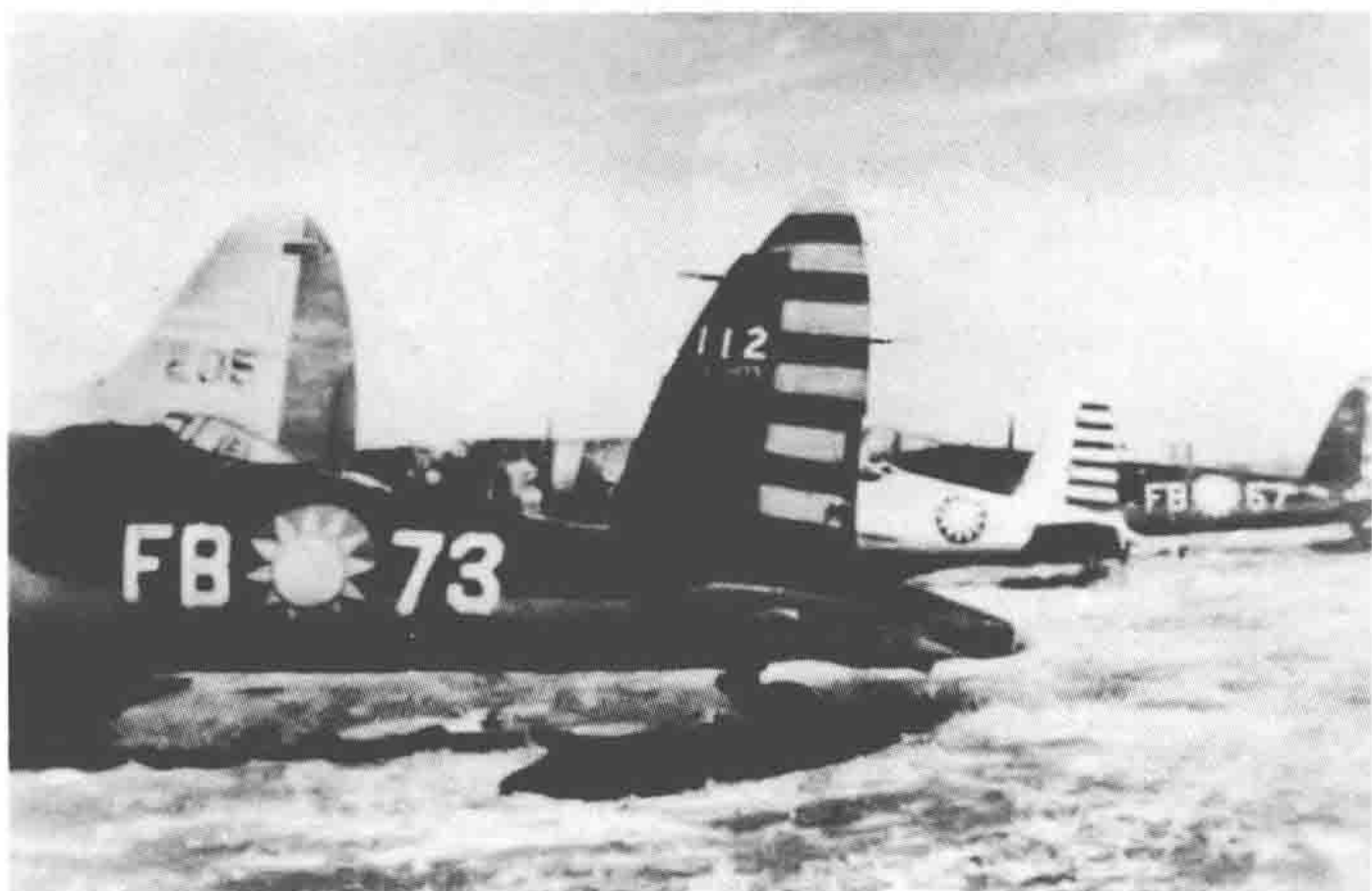
解放军缴获的 国民党军用飞机之 一部