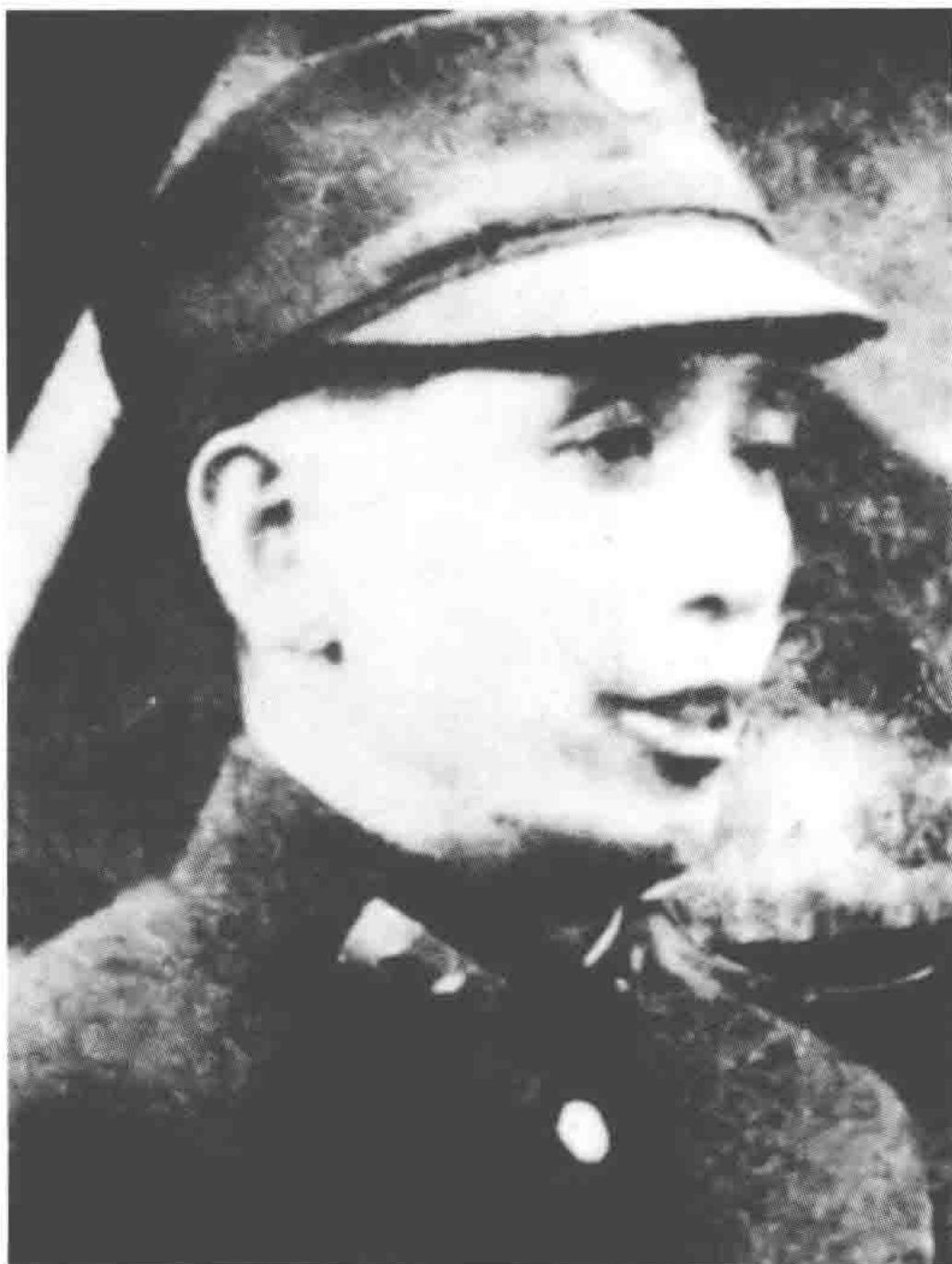
国民党第十六兵团中将 司令官孙元良