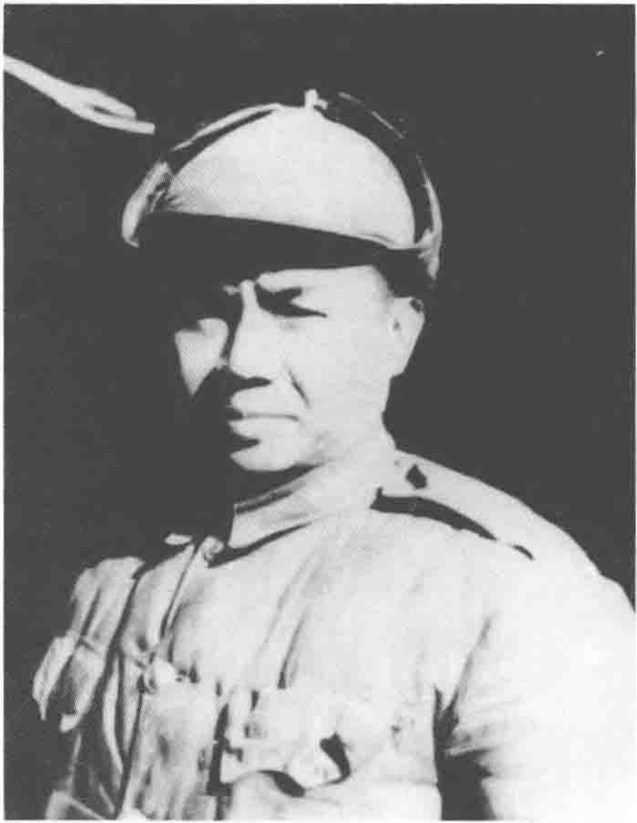
国民党第十二兵团中将副司令官 吴绍周