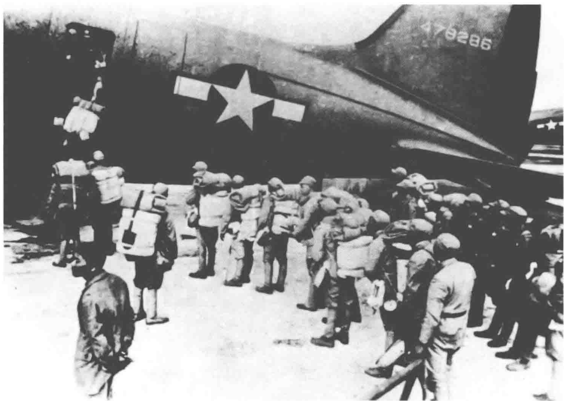
美国飞机帮助国民党军往徐州地区运兵