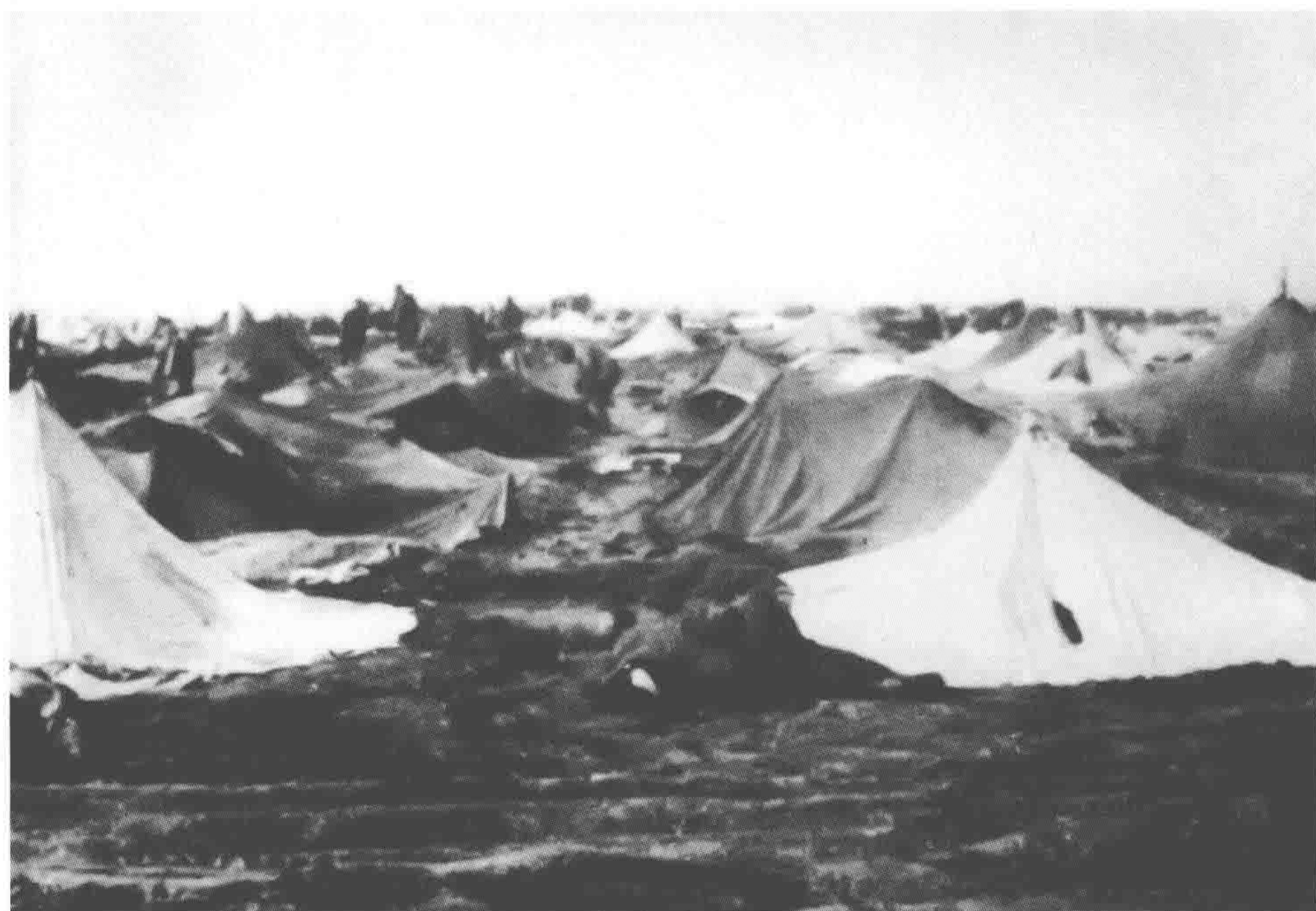
国民党军用降落伞搭的野战医院