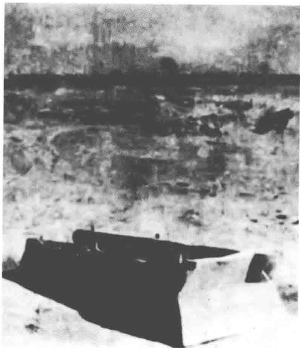
被围困的国民党军挖棺木作燃料