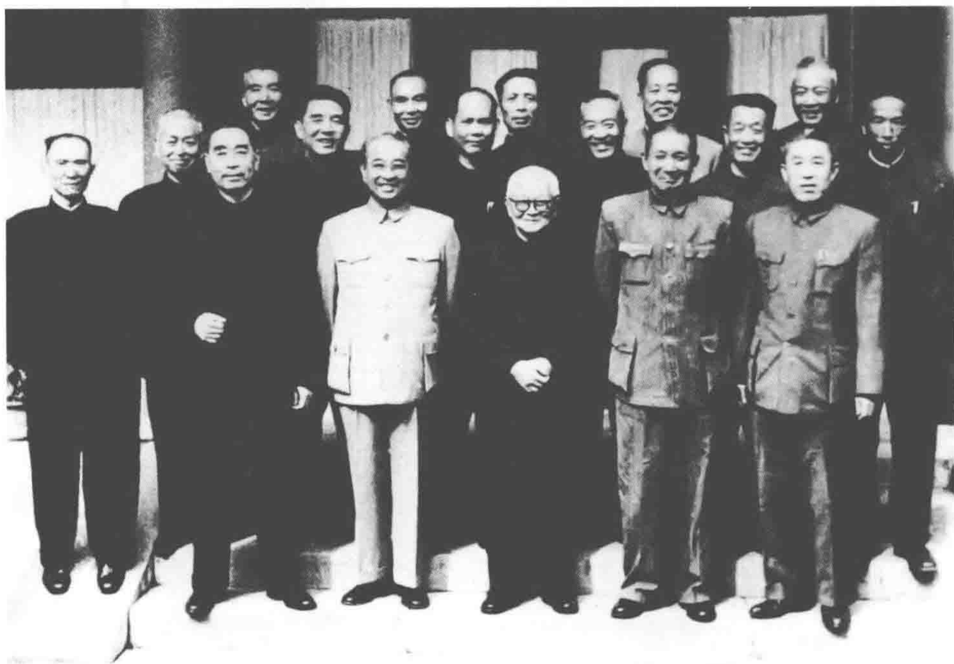
周恩来总理和黄埔军校师生在一起（一九六〇年十月十九日于颐和园介寿堂）