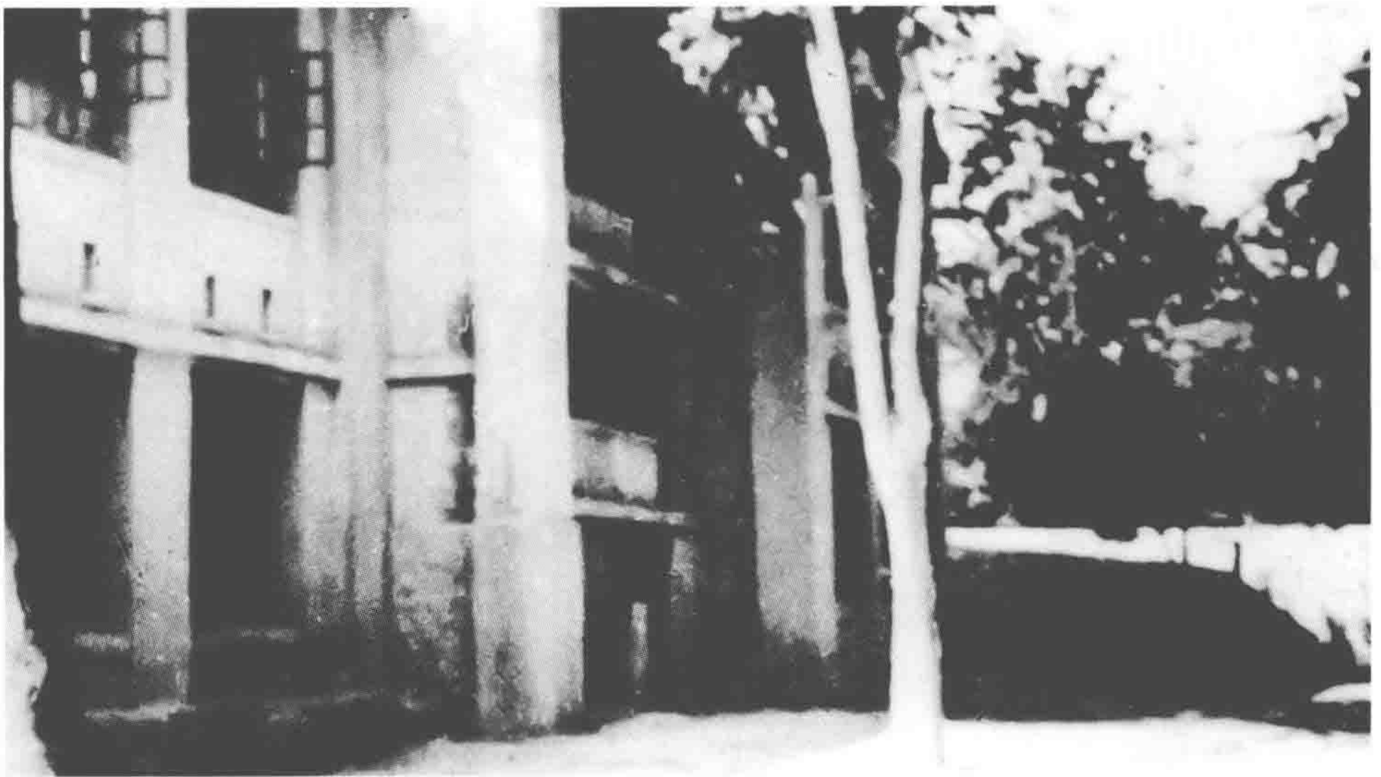
国民党徐州“剿总”前进指挥部旧址（现为徐州市第三中学校舍）