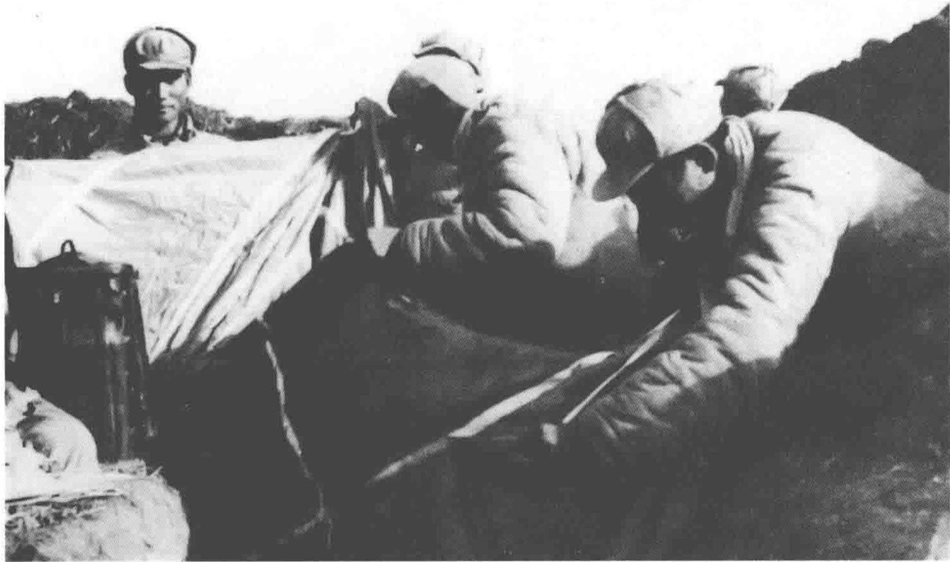
国民党军的空投补给品很多落在解放军阵地上