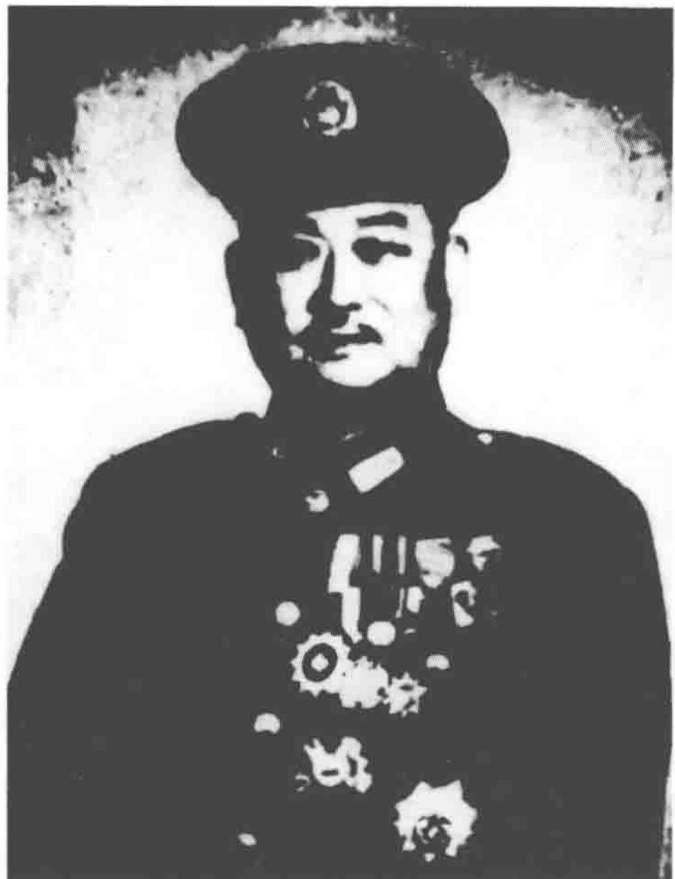
国民党徐州“剿总”上将总司令刘峙