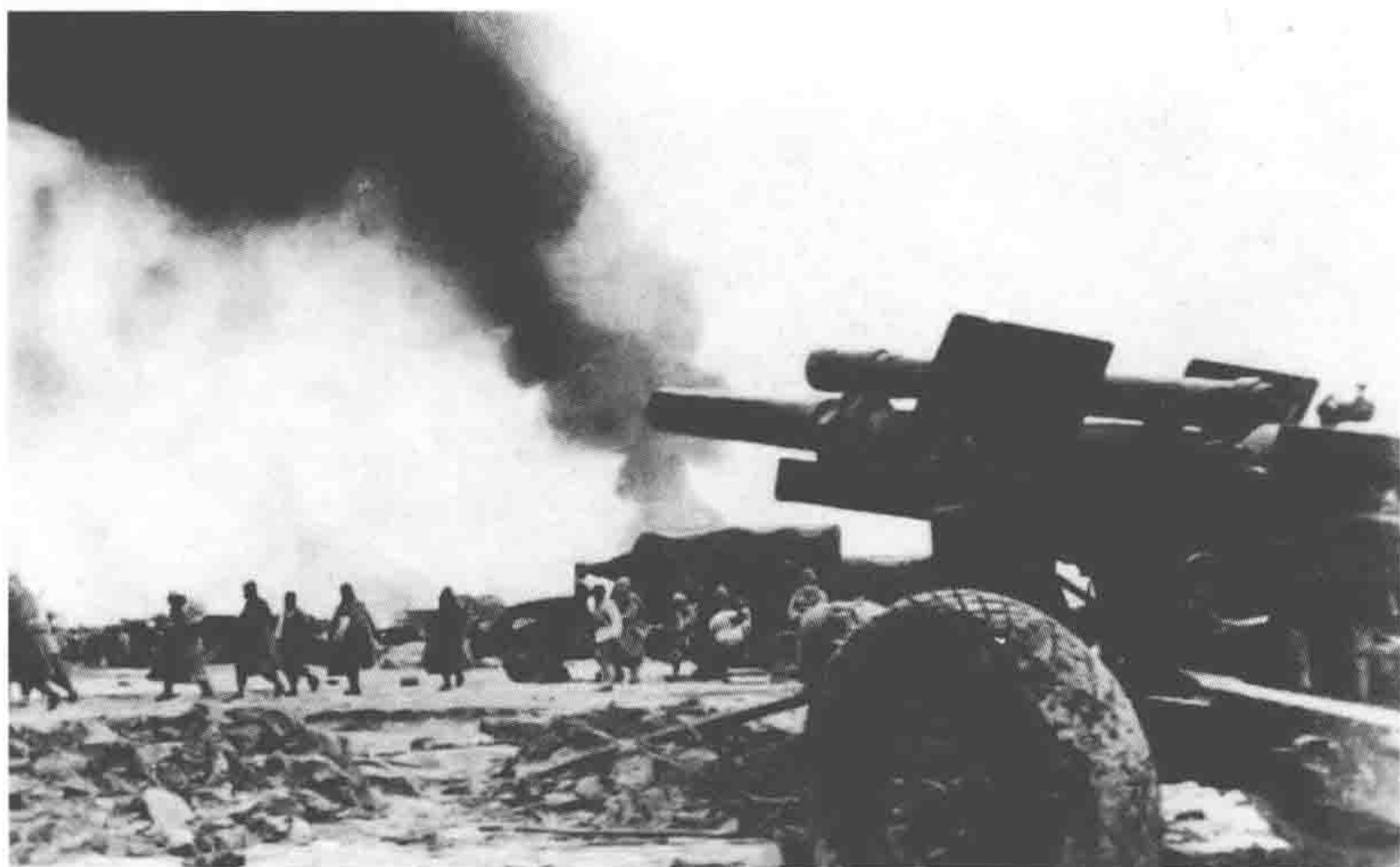
杜聿明集团在陈官庄地区被解放军全歼