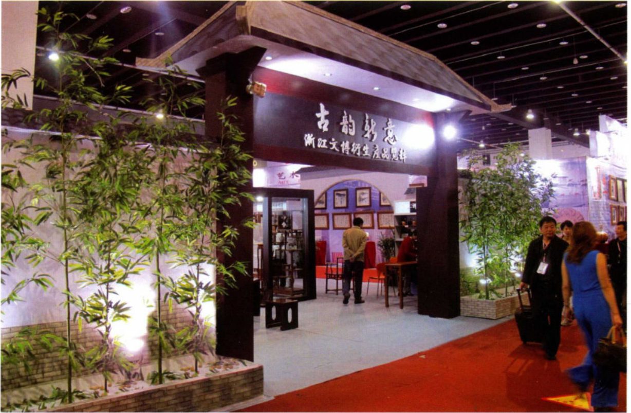
4月28日,我省文博系统首次组团参加中国义乌(第九届)文化产品交易会。