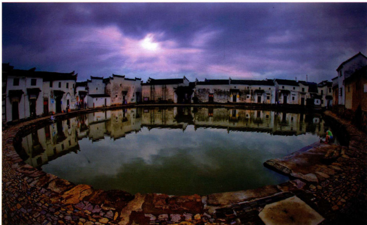
2014年,我省启动实施全省国保、省保集中成片传统村落保护利用工程。