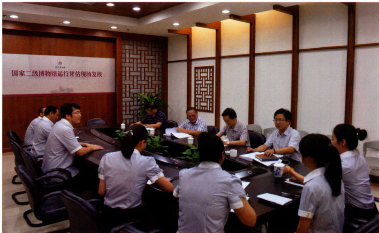
2014年,我省组织开展(2013年度)全省国家二、三级博物馆运行评估和第二届全省博物馆免费开放最佳做法推介。