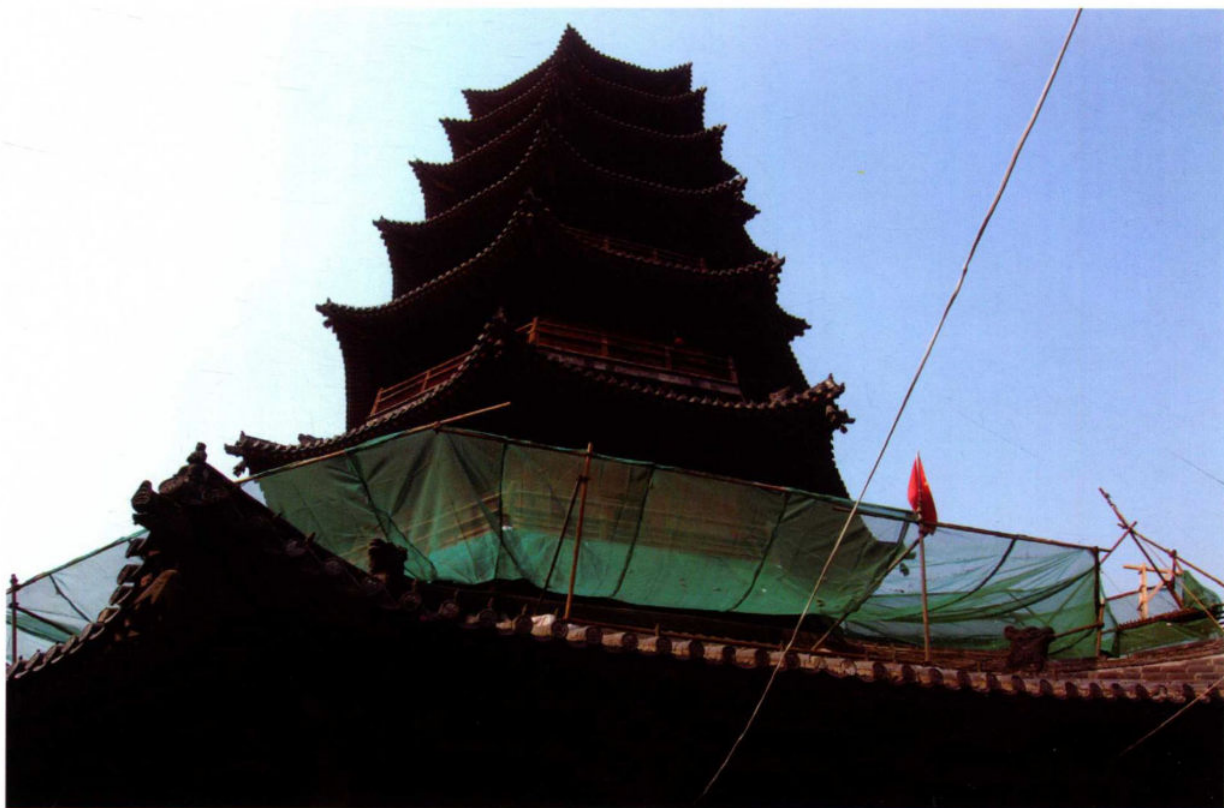
7月24日,湖州市被列为国家历史文化名城,这也是我省第八座国家历史文化名城。