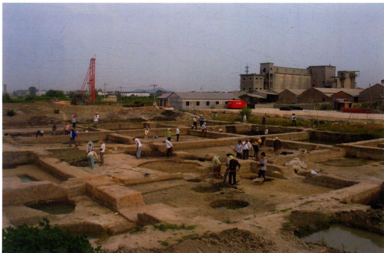
11月14日至16日的环太湖地区新石器时代晚期文化暨钱山漾遗址学术研讨会上,“钱山漾一期文化遗存”正式被命名为“钱山漾文化”。