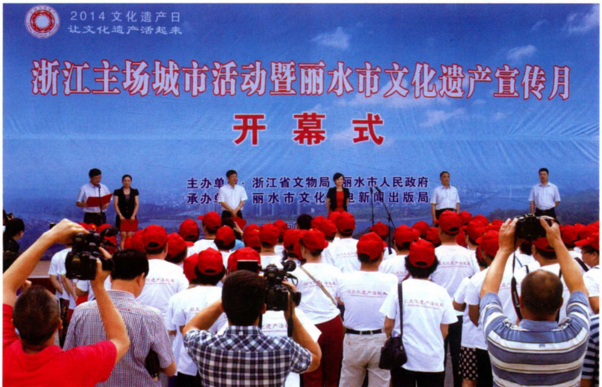
6月14日,2014文化遗产日浙江主场城市活动在丽水举行。