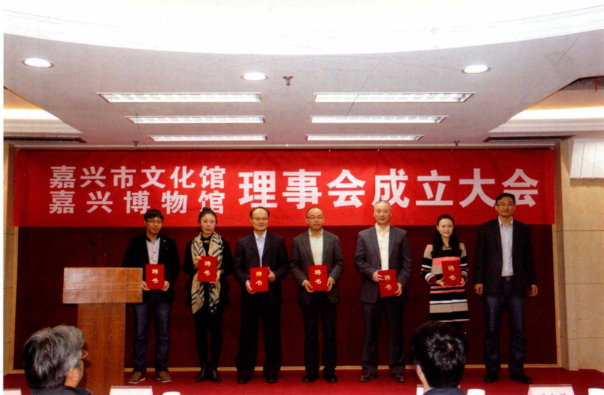
11月15日,我省首个博物馆理事会在嘉兴博物馆成立。