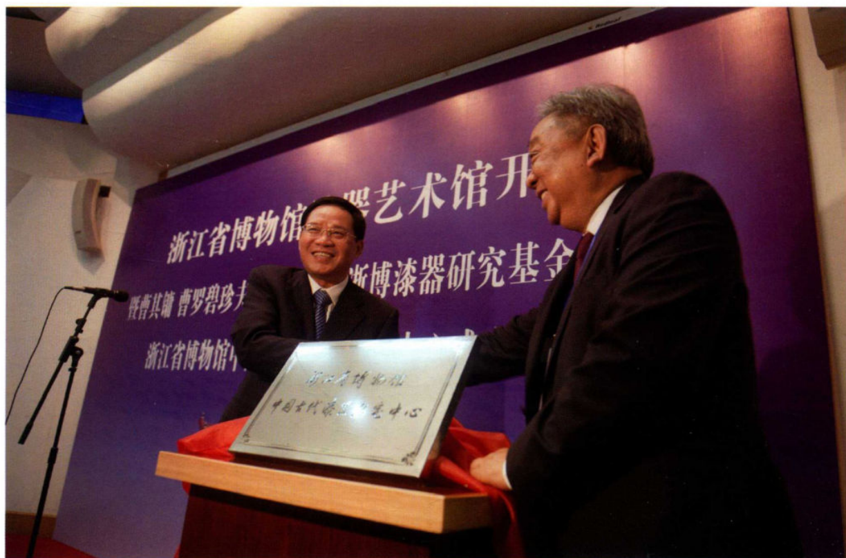
10月28日,浙江省博物馆漆器艺术馆暨中国古代漆器研究中心成立。