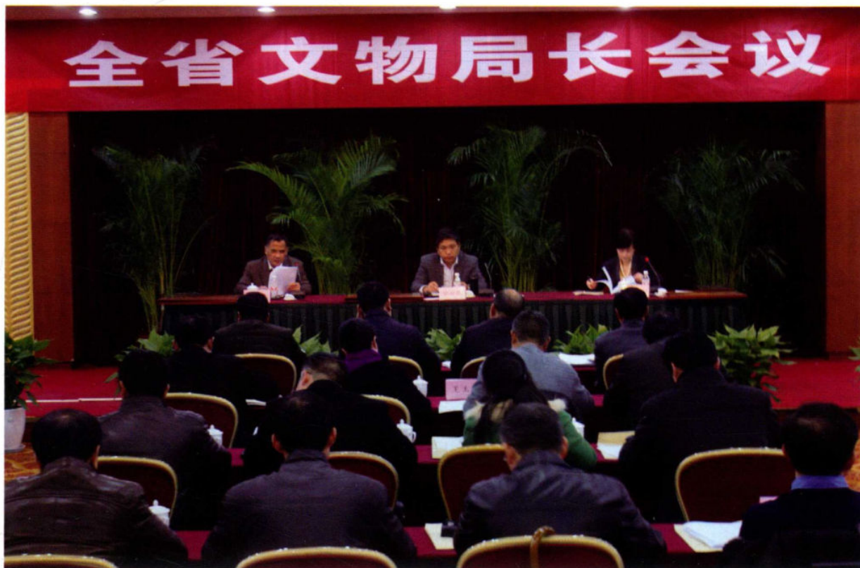
2月24日至25日,浙江全省文物局长会议在杭州召开。