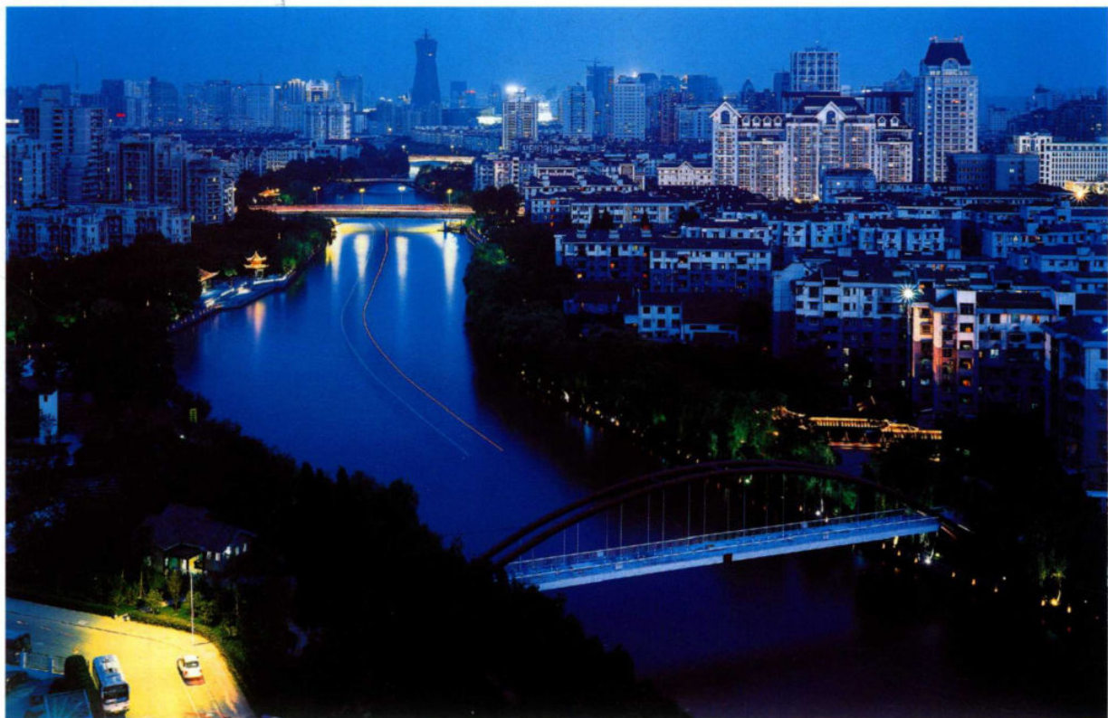
6月22日,中国大运河项目被列入《世界遗产名录》。