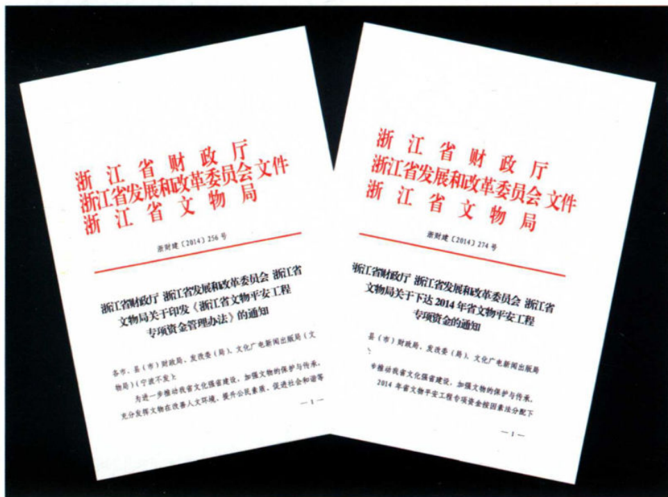
12月1日,全省文物平安工程推进会在杭州召开。省财政自2014年起,每年补助3000万元文物平安工程专项资金。