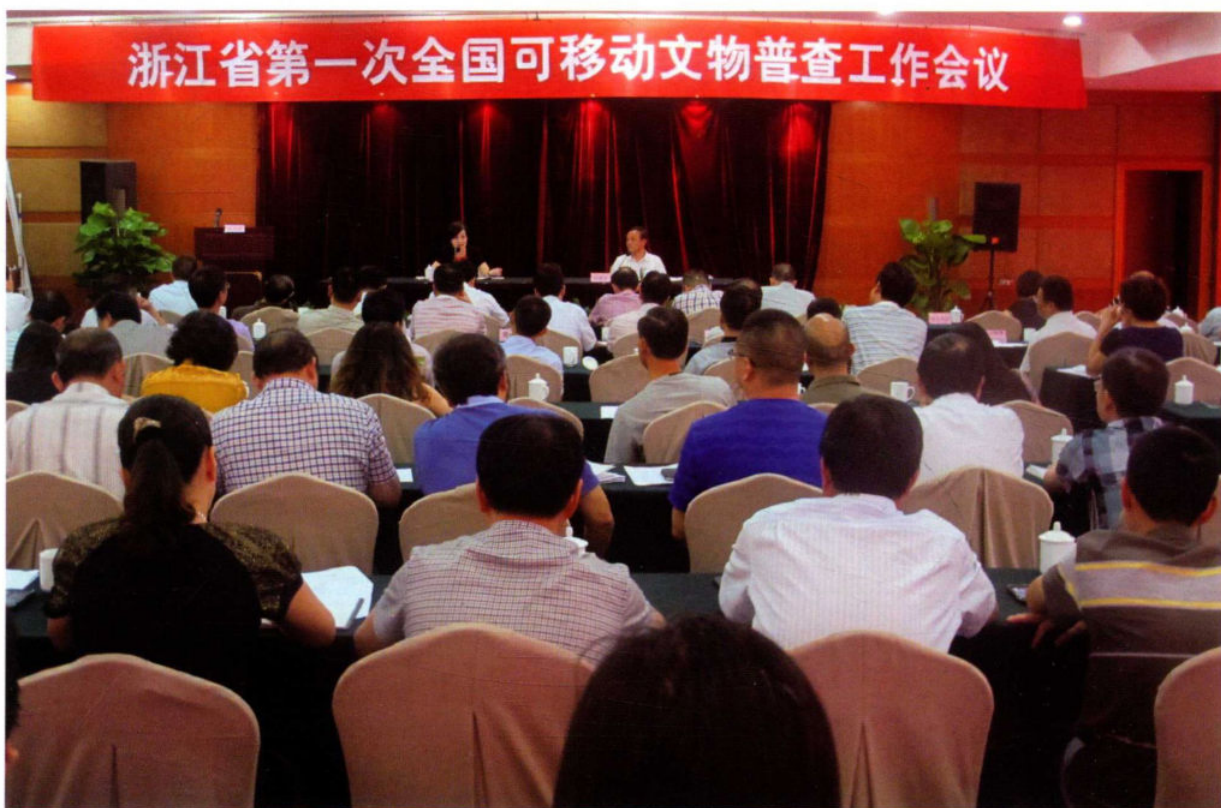
8月13日,浙江省第一次全国可移动文物普查工作会议在杭州召开。