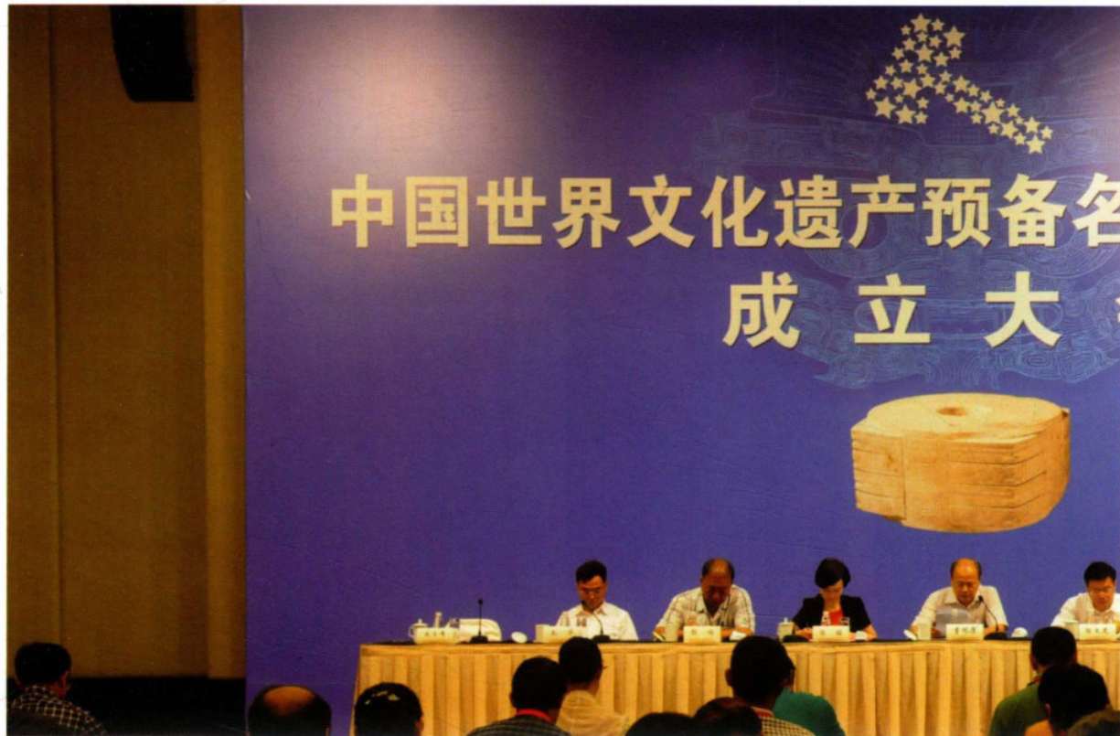
9月2日,中国世界文化遗产预备名单遗产地联盟成立大会在杭州良渚召开。