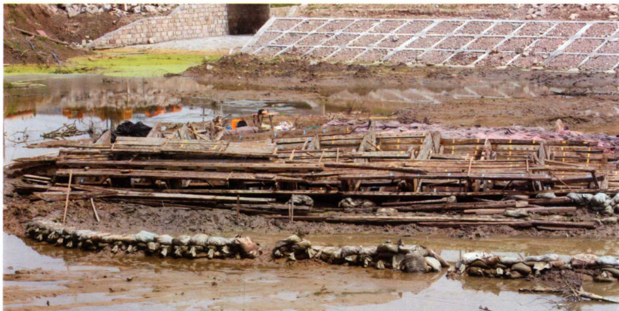
6月10日至7月15日,慈溪潮塘江元代沉船遗址实施野外考古发掘。本次考古所发现的元代沉船填补了我省空白。