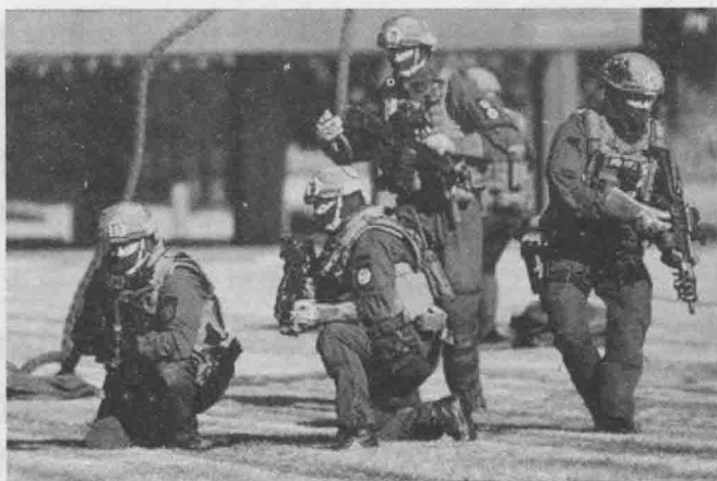
德国 GSG9 反恐特种部队

训练。这之后，苏联、以色列等国也纷纷成立了专门的反恐特种部队。反恐部队，正式作为一个独立的力量登上历史舞台。