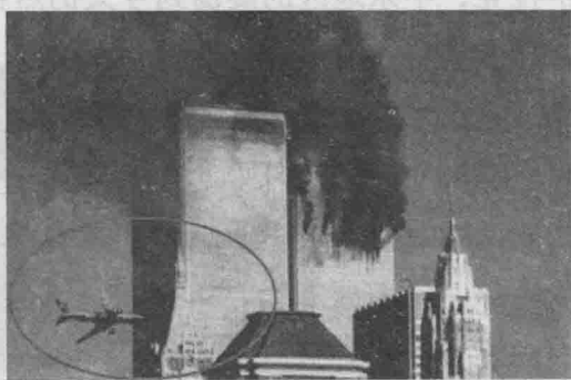
“9·11”事件瞬间，第二架飞机即将撞上大楼