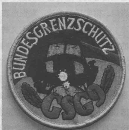
德国 GSG9 反恐特种部队刺绣臂章

事件之后，德国警方痛定思痛，成立了世界上第一支专门应对恐怖袭击的特种部队——GSG9。很快，他们再一次证明了“德国制造必属精品”这句话。这支GSG9成为反恐力量的业界标杆，在几年后就成功地处理了多起劫机事件。直