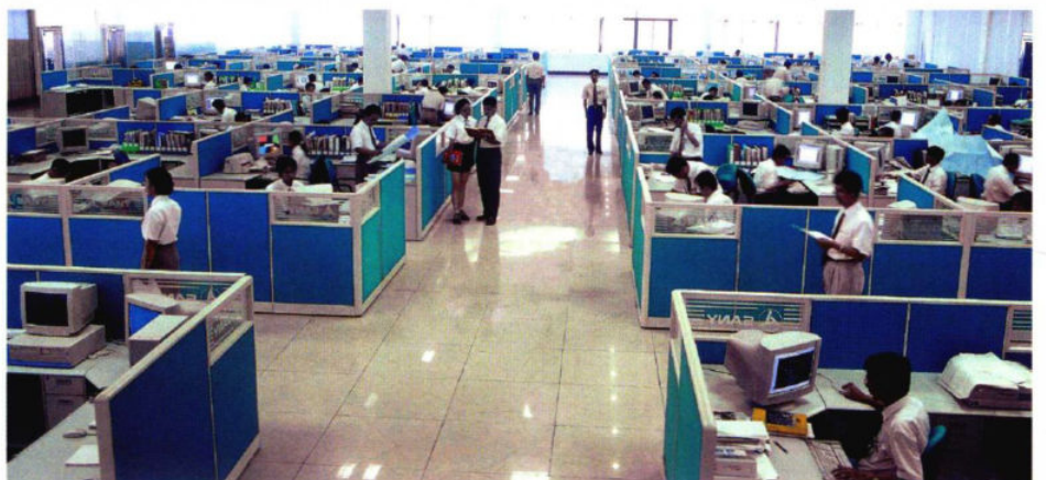
三一重工技术中心