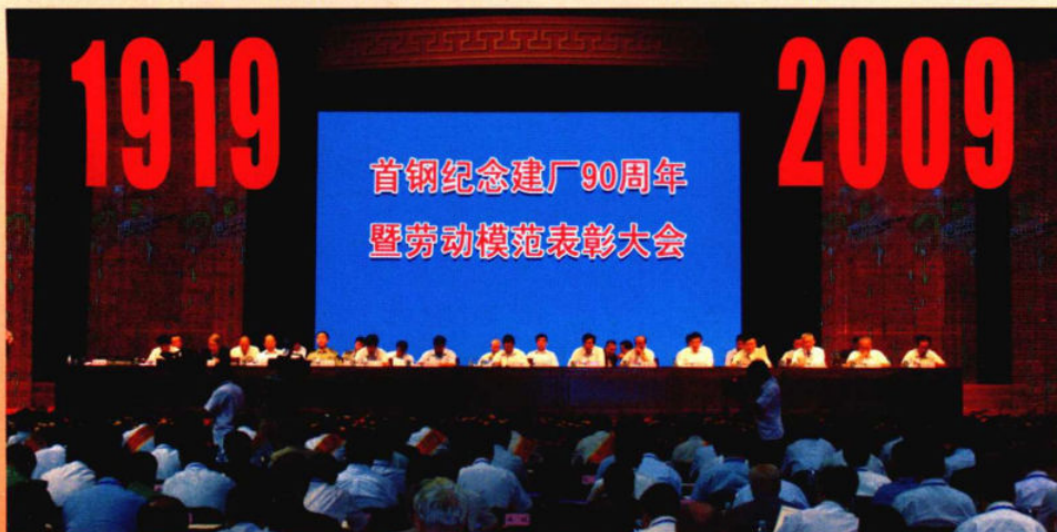
2009年9月2日，首钢纪念建厂90周年暨劳动模范表彰大会