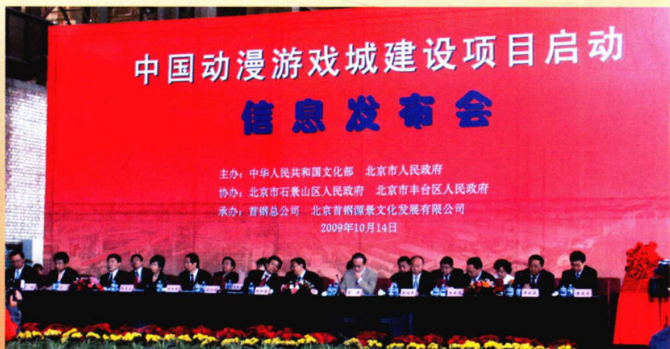
2009年10月14日，中国动漫游戏城建设项目启动信息发布会