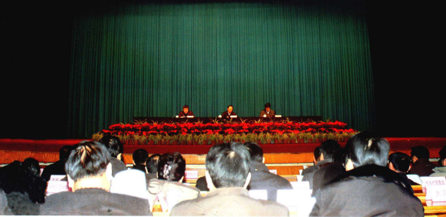
2010年1月8日，2010年北京市经济和信息化工作会议