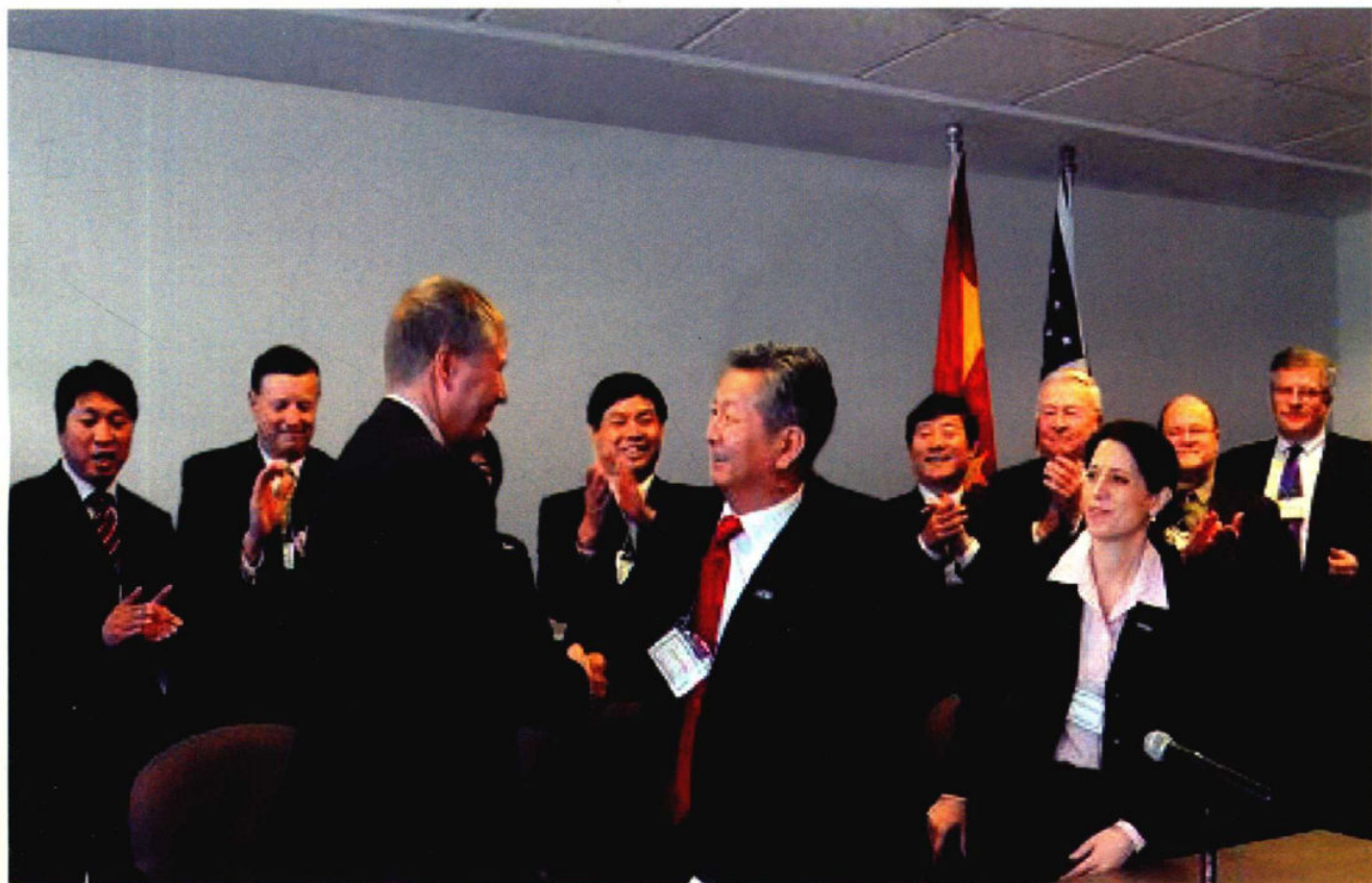
2009年3月30日，京西重工收购德尔福悬架和制动业务签约