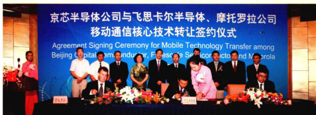
2009年8月7日，京芯半导体公司与飞思卡尔半导体、摩托罗拉公司移动通信核心技术转让签约仪式