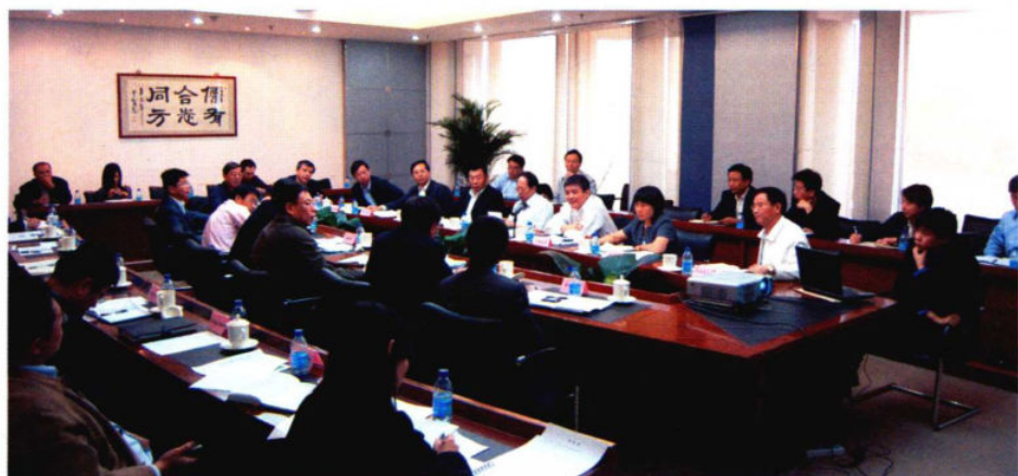
北京市帮扶企业调度会