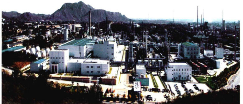
石化新材料科技产业基地