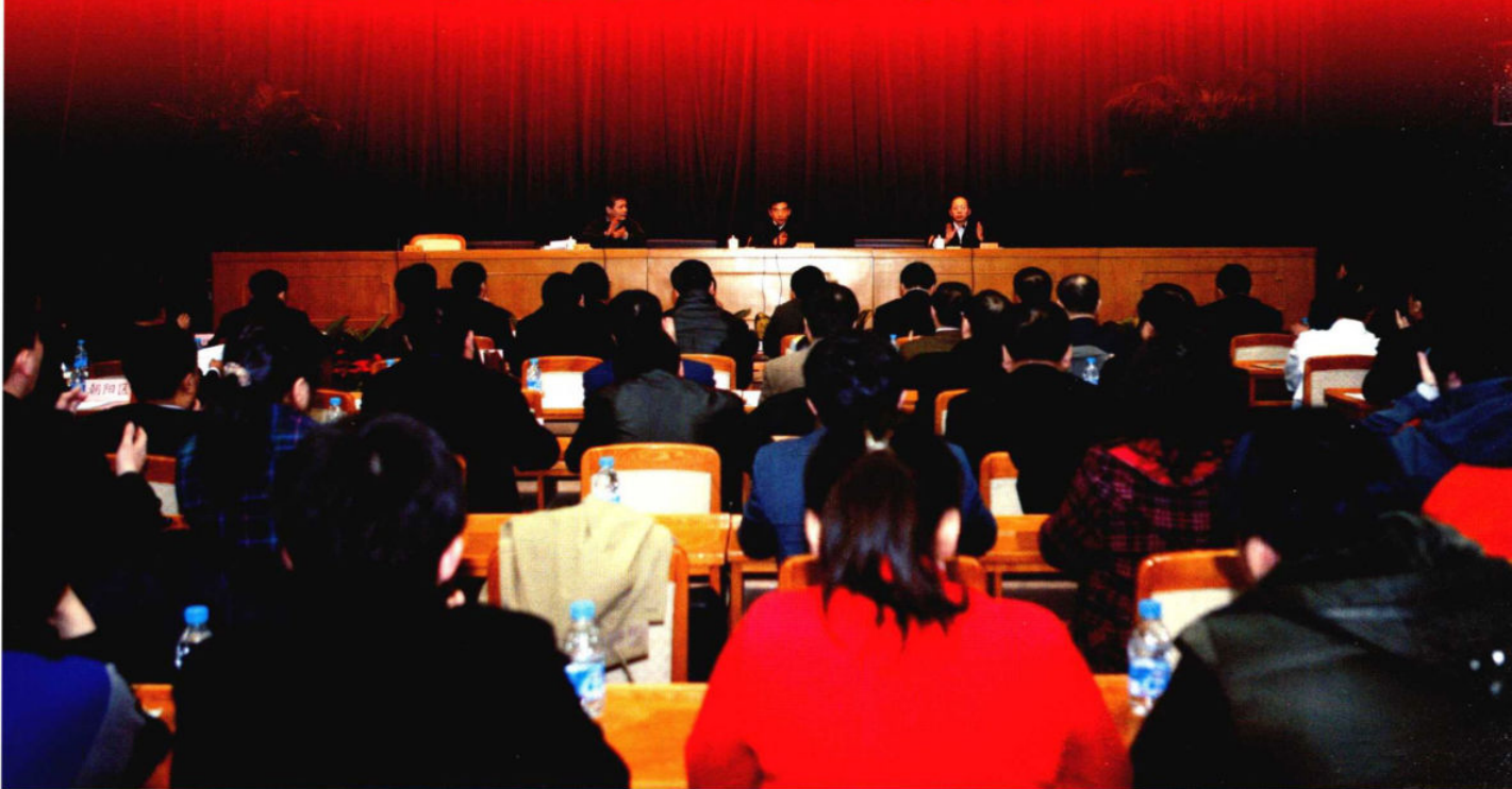
2010年3月4日，北京市帮扶工作表彰大会