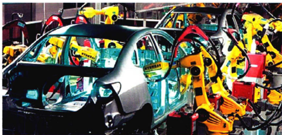
北京现代组装车间