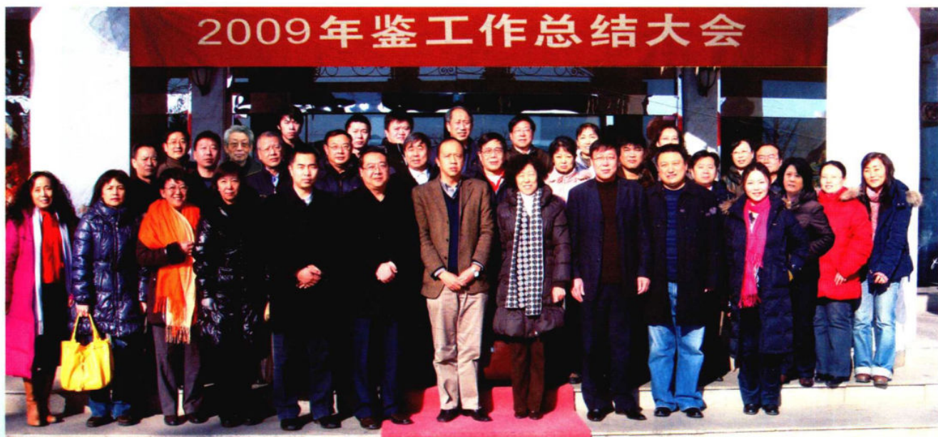
2009年12月18日，《北京工业年鉴》工作总结大会代表合影