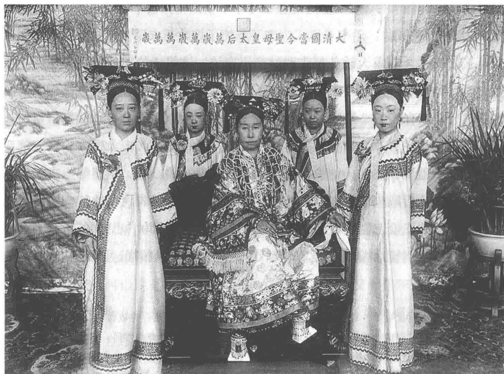
慈禧与德龄、四格格、元大奶奶、容龄合影

子女的房中，到处挂着格言家训，里面有这样一段话：“财也大，产也大，后来子孙祸也大，若问此理是若何？子孙钱多胆也大，天样大事都不怕，不丧身家不肯罢。”其实问题不在钱财，而是怕招灾惹祸。最有意思的是，他在光绪二年写了一个奏折，控告一个没有具体对象的被告，说是将来可能有人由于他的身份，要援引明朝的某些例子，想给他加上什么尊崇；如果有这样的事，就该把倡议人视为小人。他还要求把这奏折存在宫里，以便对付未来的那种小人。过了十几年之后，果然发生了他预料到的事情。光绪十五年，河道总督吴大澂上疏请尊崇皇帝本生父以称号。慈禧见疏大怒，吓得吴大澂忙借母丧为由，在家里待了三年没敢出来。