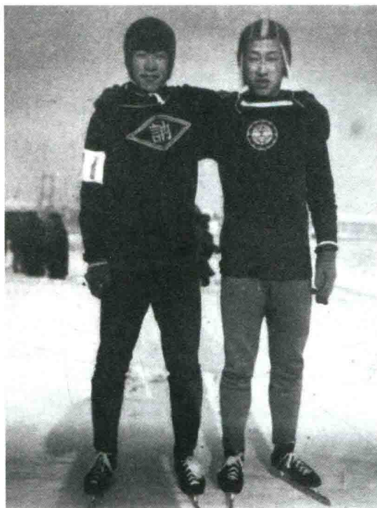
爸爸位于照片的左侧，这是他参加黑龙江省中学生速度滑冰比赛时的留影

五常县（现五常市）居住，那里是黑龙江省盛产优质稻米的地方。那时的东北三省凡是能种植稻米的地方，差不多就会有朝鲜人居住。