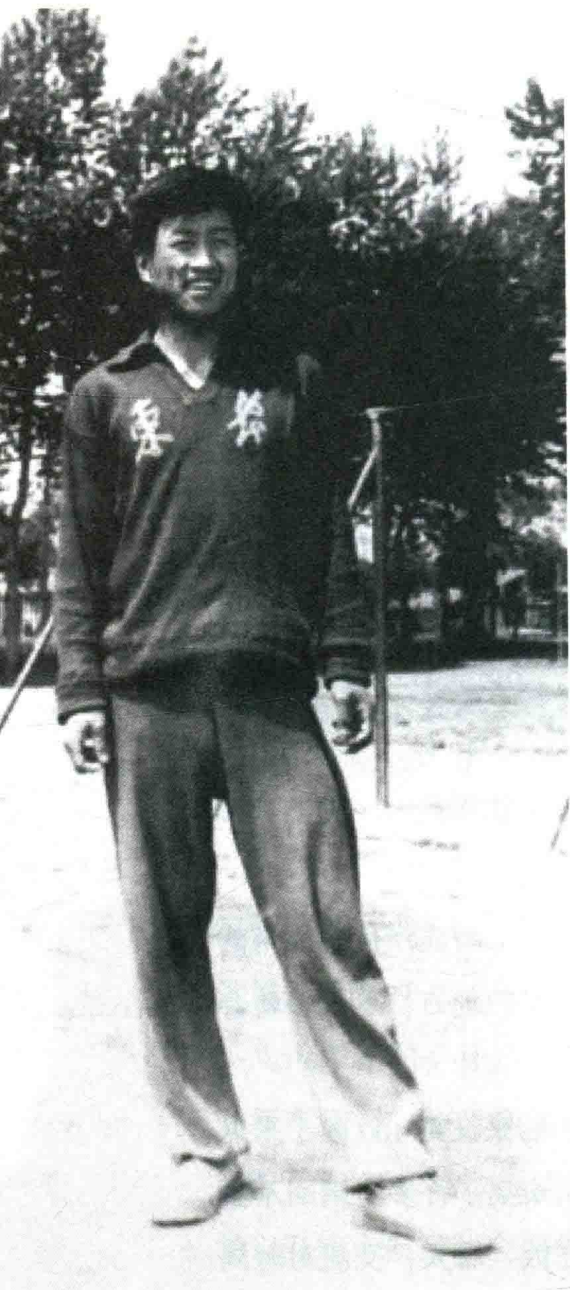
爸爸在东北农学院体育场

一次聚会时，妈妈认识了爸爸，自然而然地，他们就由相识、相知到相爱了。爸爸比妈妈大五岁，年轻的时候相当帅气，有着健壮的体魄和聪明的头脑，又是风华正茂的大学生，以妈妈那倔强的性格肯定会穷追不舍的。