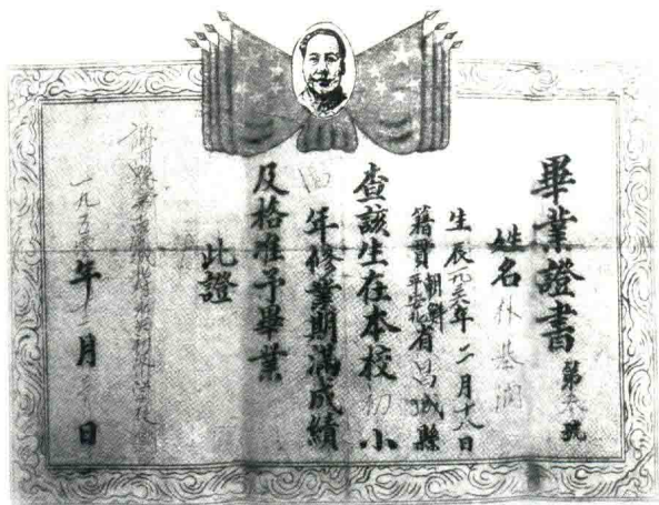
爸爸 1950 年初小四年的毕业证书

高中毕业时，学校要保送他到哈尔滨体育学院学习。可他觉得自己的文化课成绩也很好，希望凭借自己的能力参加高考以期多一些选择。最后爸爸考取了东北农学院（现东北农业大学）食品加工专业。