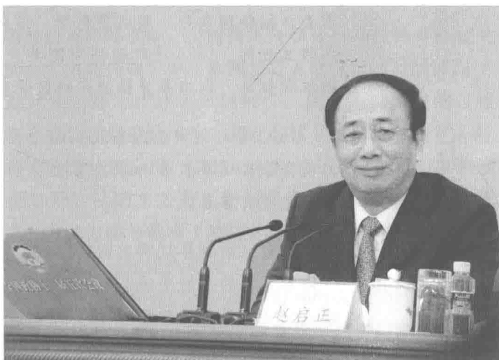
④ 2012年3月2日下午，赵启正在全国政协十一届五次会议新闻发布会上。