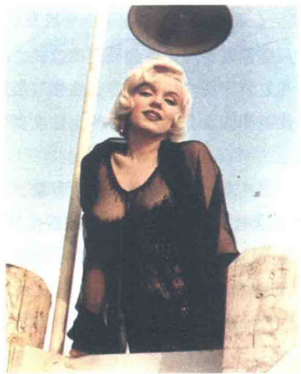
图1-8 美国女星玛丽莲·梦露在《热情似火》中的剧照

(2) 发型。西方女性依旧延续战后的女性化形象，并在款式上有了较多的变化，另受美国大众文化的影响，一种用缎带把头发在后脑处扎成一束再自然下垂的马尾发式成为欧美流行的款式；新中国女性前期在发型上继续流行烫发和梳髻，普通女性还是保持着最朴素的短发和梳辮，后期就不再有烫发、梳髻的发式，港台地区的女性继续流行烫发和梳髻，以及较为简洁的西方发式。