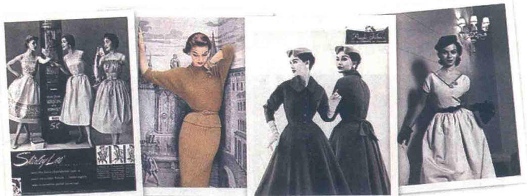
图1-7 19世纪四五十年代的时尚