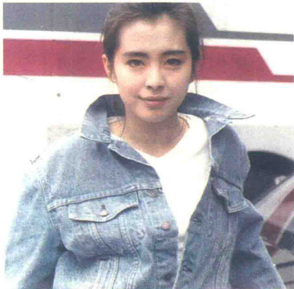
图1-11 王祖贤的牛仔装

(3) 服装。西方女性所追求的是理想美,以纤细高挑的身材为主,在戏剧般浪漫主义倾向影响下条纹图案和海员服大行其道,使人联想起16世纪的航海者,职业女性的流行色中几乎排除了大红大紫,而以中性色为主,款式上内长外短、层叠穿法、针织类与棉制品互为配搭、功能错落互替,使服饰呈现无序、丰富的视觉效果,高级晚装中豪华的巴洛克风格纷纷亮相,与此相反,一些前卫的年轻人却在强烈的自我表现欲的驱使下,完全不顾品牌,只凭自己的喜好打扮自己,这一时期甚至出现了故意把下摆裁斜、把毛衣做出破洞、露着毛茬的“乞丐装”;中国女性的时髦装束是各式各样的红、黄裙子,以及乞丐衫、巴拿马裤、蝙蝠衫、牛仔装(图1-11)、喇叭裤。