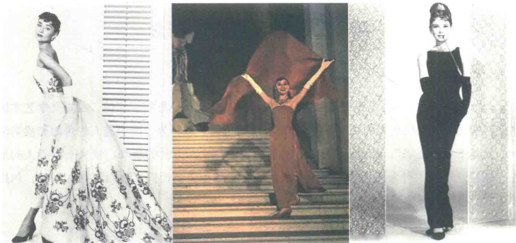
图1-1 纪梵希为奥黛丽·赫本设计的经典银幕造型

早期的优秀形象设计师不是化妆师或美容师,而是服装设计师,这是因为在人的外观和造型中,服饰占据了大部分的比例。设计大师纪梵希以独特的优雅格调,打造出好莱坞影星奥黛丽·赫本的经典形象(图1-1),这就是一个成功的案例。随着社会经济、文化的发展和人们审美水平的不断提高,形象设计已从一种艺术创造手段演变为人们的一种生活模式,并发展成一种新的文化形态。由此来看,形象设计不仅丰富、美化了人们的日常生活,更扩展了艺术创造的空间。