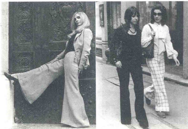
图1-9 风靡一时的喇叭裤

(3) 服装。西方女性为了追求年轻青春的体态美，色彩单纯、式样简洁、轻便、年轻化而富于机能性的迷你短裙、喇叭裤成为这时的流行（图1-9），晚礼服则是紧身的上装如小背心似的非常适体，突出胸部和腰部；中国女性前期在蓝、灰、黑的列宁装、制服的主流中，出现了各种花样裙装，旗袍也开始复归，后期军装成为最时髦的装束，格子、小花布衬衫，配上毛巾和草帽则流露出当时女知青的秀丽和娇美。