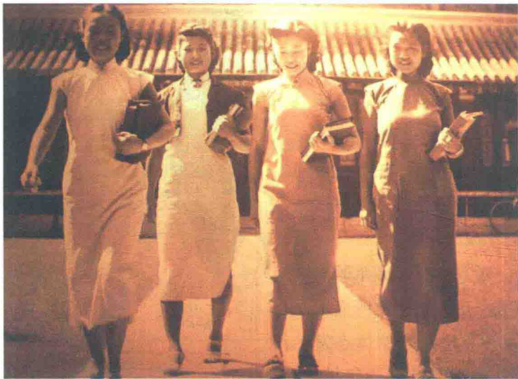
图1-5 1926年广州穿旗袍的女学生

也出现“西班牙风情服装”“俄罗斯舞蹈服装”等；中国女性除西式裙装外，最流行旗袍，紧腰大开衩旗袍，佩项链、胸花、手套，腿上套透明高筒丝袜，足蹬高跟鞋，成为这一时期中西结合较为成功的女性服饰形象（图1-5）。