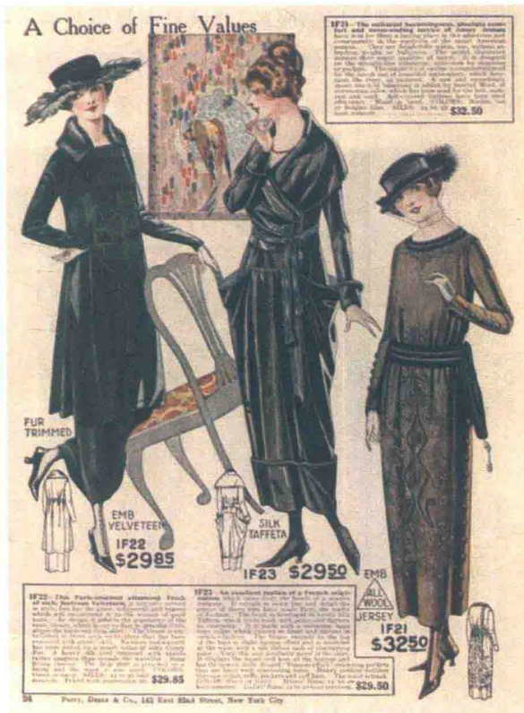
图1-4 1919年秋冬纽约女性服装

(3) 服装。西方女性受文艺复兴时期服装及各历史时代的风情影响, 在体态上出现一种追求“利落、直线、简洁”及“不强调曲线变化”的长条形, 苗条纤细的身材更成为 19 世纪 20 年代最具美感的理想体态, 形成了“中世纪服装”“维多利亚时期服装”等流派,