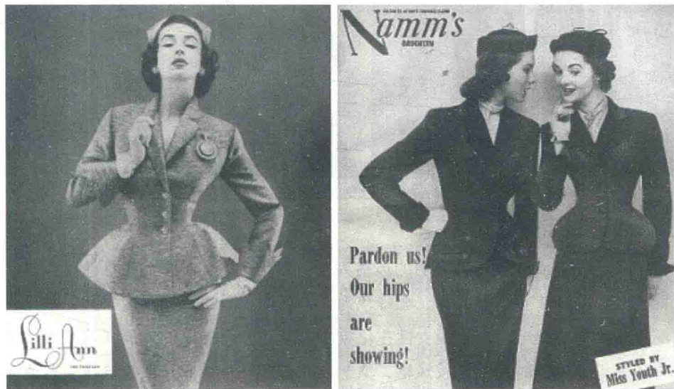
图1-6 1940年, Christian Dior设计出第一款铅笔裙

1-6); 中国女性则围绕思想潮流的此消彼长, 旗袍在长短、宽窄、开衩高低及袖长袖短、领高领低等方面展开“较量”, 一款款曲线玲珑的旗袍成为当时的标志性装束, 更有令人目不暇接的、几乎与欧美同步流行的各式时装。