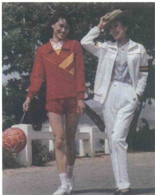
图1-10 改革开放初期中国的时尚女性

民族风、运动休闲等多种风格同时出现，令当时的世界时尚舞台呈现出前所未有的多元化，中期牛仔服装盛行，并从此风靡全世界，多姿多彩的套头衫也成为最时尚的日常服装，后期逐渐以回归自然，寻求安宁、舒适为主题，由此结束了喧嚣的嬉皮士风潮；中国内地女性前期在蓝、灰、黑的世界里看到的只有格子、花布衬衫，江青裙也曾昙花一现，后期赤、橙、黄、绿、青、蓝、紫代替了单调沉闷的蓝、灰、黑，色彩鲜艳的裙装和羊毛衫是最为流行的款式，港台地区的女性则开始流行迷你裙、热裤、喇叭裤和象征年轻、休闲的牛仔裤，以及露背装和宽大领型的衬衫（图1-10）。