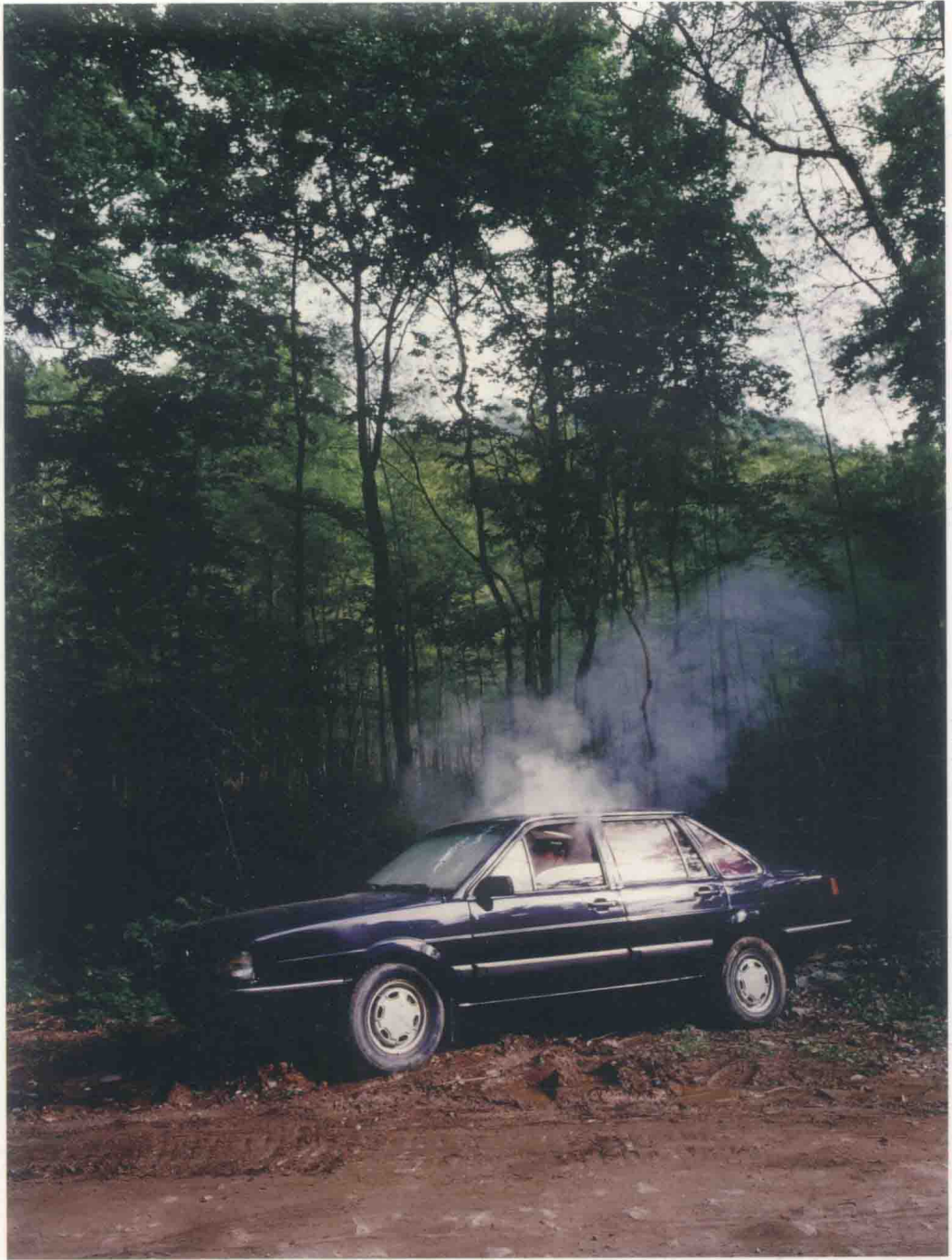
泥浆 | Mud No.1, 2006, 100cm×75cm, 收藏级艺术微喷 | Archival Inkjet Print