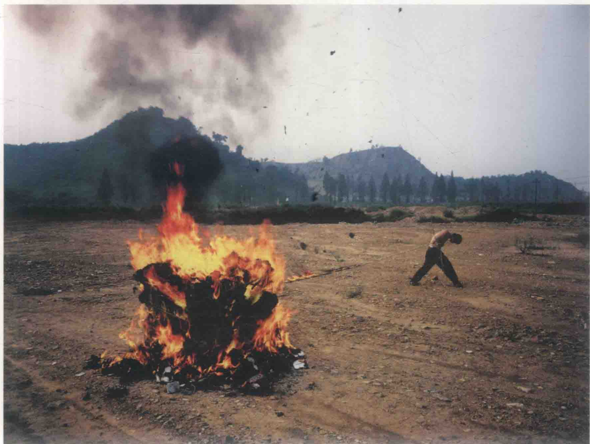
拉火 | Pulling Fire, 2007, 120cm×160cm, 收藏级艺术微喷 | Archival Inkjet Print