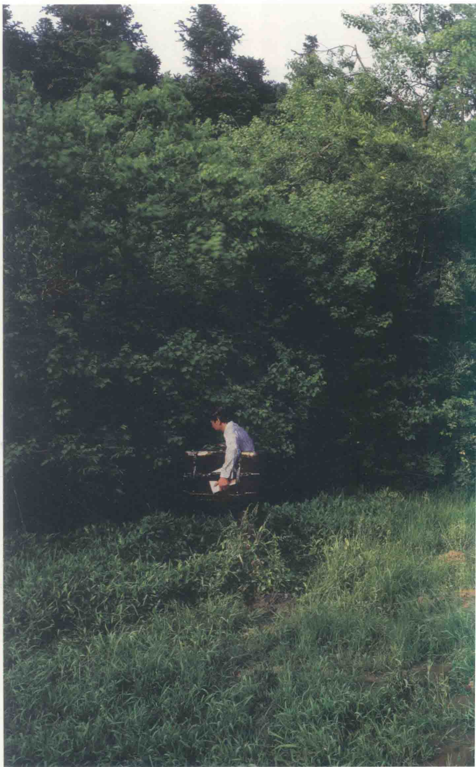
寓言家的小径 | The Fabulist's Path™ 2007 | 120cm x 175cm | 收藏级之木微喷 | Archival Inkjet Print