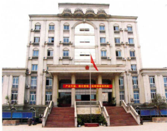
现遗址被镇政府政府大楼覆盖