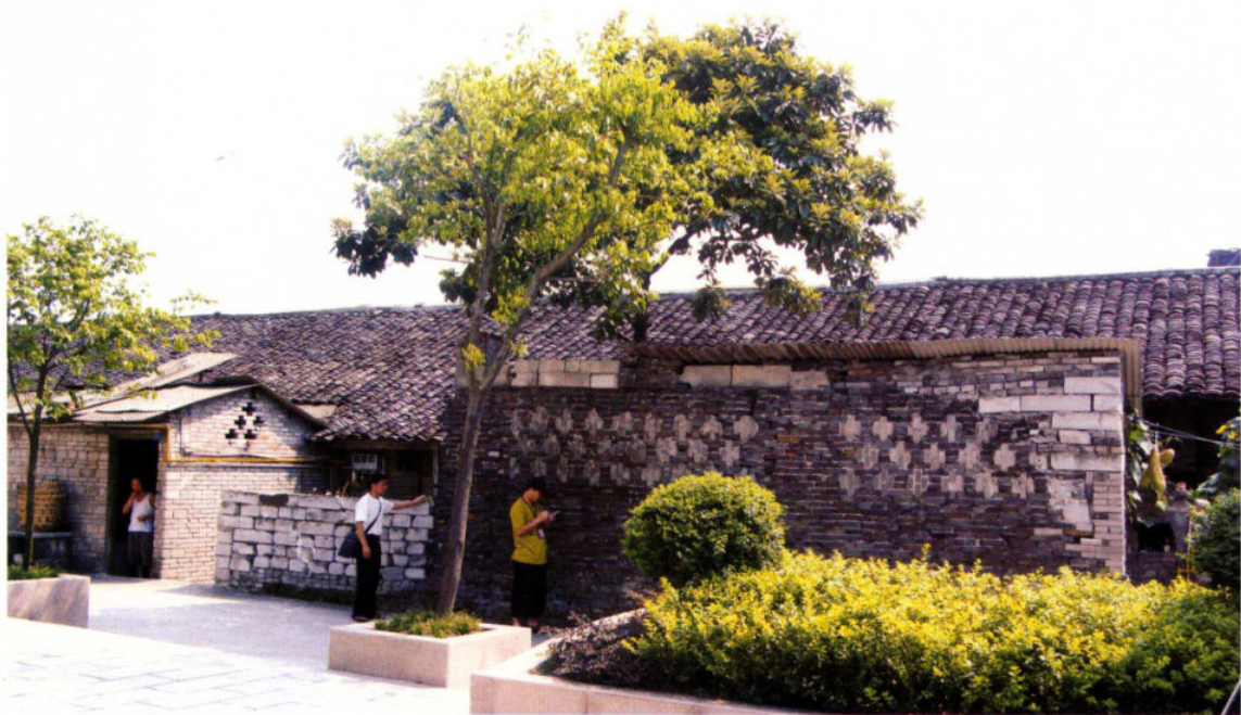
巴人船棺遗址已被居民住房覆盖

巴人船棺遗址位于重庆市九龙坡区铜罐驿镇2社区冬笋坝，该遗址年代为战国至西汉，占地面积约9957平方米。1954年，由重庆第一机制砖瓦厂建厂房挖地基时发现。西南博物馆（今重庆博物馆前身）对该遗址进行了大规模的考古发掘。在众多发掘的墓葬中，船棺葬独具特色。十七座排列整齐的墓葬，头部均正对长江。墓坑均为土坑竖穴，葬具为长约5米，直径1米以上的楠木剝成的舟形棺材。棺材上部约成半圆型，底部稍削平，两端底部斜削，使其翘起成船形，首尾两端各凿一大孔，以便系绳下葬之用。墓葬中出土了兵器、容器，铁器等一系列巴人当年使用器物，冬笋坝巴人船棺葬的发掘、出土为我们了解巴国历史提供了重要的资料，对进一步研究巴人文化具有较高的史料价值。