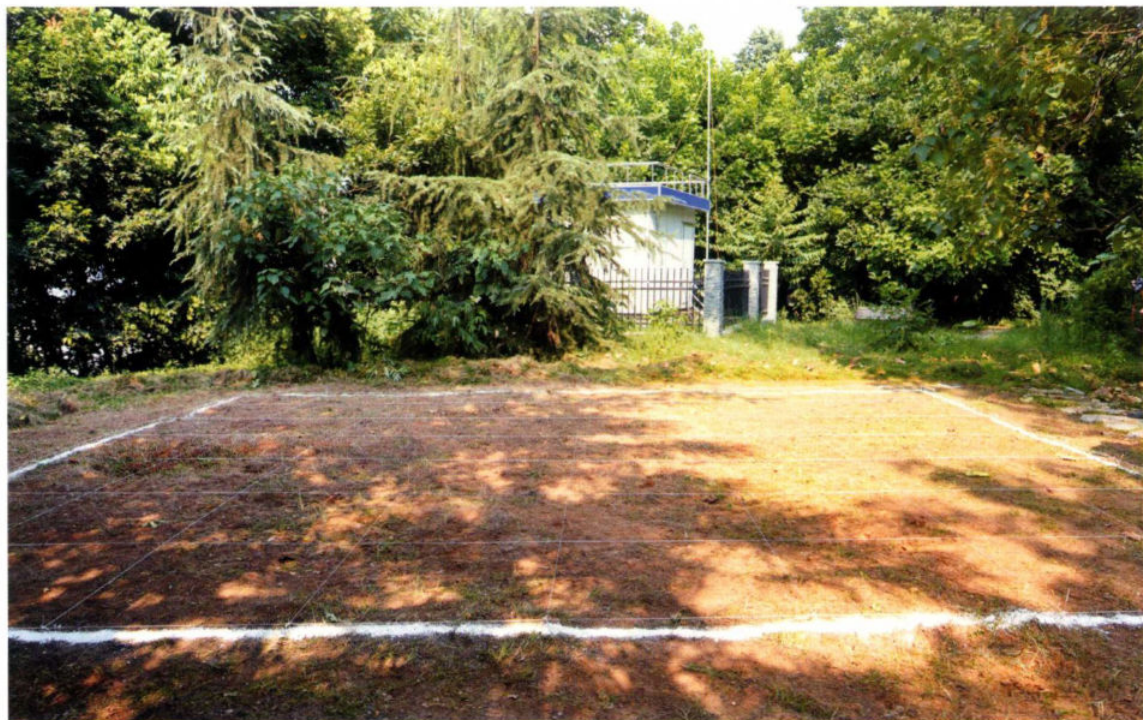
玉龙公园旧石器遗址发掘前全景照

玉龙公园旧石器遗址位于九龙坡区九龙镇九龙村广厦城小区玉龙公园内，临长江北岸，地处长江的第五级阶地。1985年，文物部门在九龙坡区沿江一带地表采集到石制品，2009年，重庆三峡古人类研究所文物工作者在玉龙公园内东侧一自然砾石层剖面上采集到有人工打击的石制品，并于2010年底对该遗址进行了正式发掘，发掘面积56平方米。此次发掘有石器172件（其中采集27件，出土145件）。该遗址的石制品原料为就地取材，石制品的原料较为单一，有明显倾向性，基本为石英斑岩。器型多为砍砸器，少量石核、刮削器、尖状器和手镐等。石制品个体大小组合以大型和中型为主，少量小型和矩形。石制品加工主要是块状毛坯，少有片状毛坯，对毛坯的原始形态改变较少，锤击法剥片和修理，加工方式较为简单，正向加工居多，少量交互加工和错向加工。从石制品组合和加工技术来看，体现出很强的实用性。经过重庆三峡博物馆、重庆三峡古人类研究所与我区共同发掘，并送澳大利亚做地质年代测定后，确定其时间为距今100万年左右。这刷新了重庆主城区有人类活动的历史。此遗址的发现不仅具有重要的科学研究价值，对提升我区知名度和影响力有不可替代的作用。