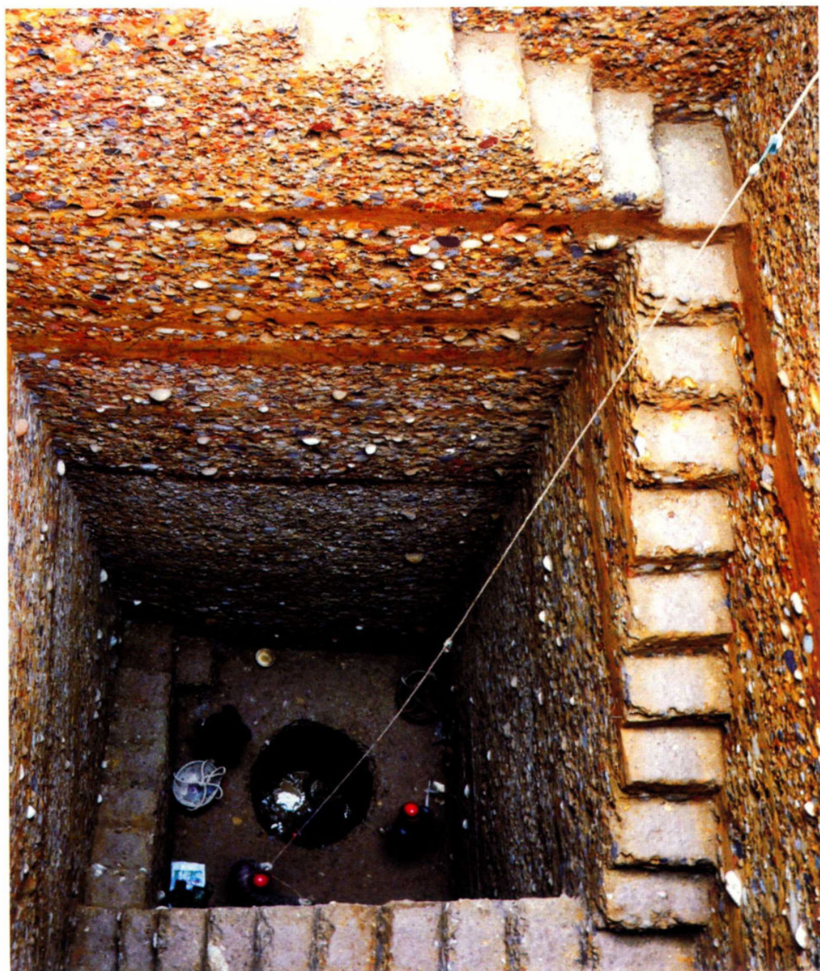
玉龙公园旧石器遗址发掘现场