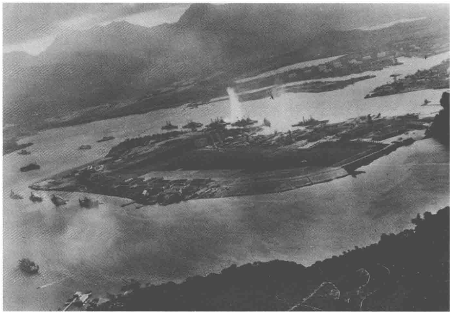
珍珠港内停泊的美国军舰遭到攻击

12月8日（夏威夷时间12月7日）黎明，太平洋上波涛汹涌，一支庞大的舰队正迅速向南驶去。这就是在海上航行了12天的南云机动舰队，此刻它在珍珠港以北230海里。不久，飞机起飞的轰鸣声打破了黎明的寂静，日本的俯冲轰炸机、鱼雷机、战斗机一架接一架地从航空母舰上起飞，直扑珍珠港。此刻，美军舰艇仍静静地停泊在珍珠港内。7时50分，日机飞临珍珠港上空，顷刻之间，爆炸声震耳欲聋，火光闪闪，浓烟冲天，仓促应战的美军损失惨重，8艘战列舰有4艘被击沉，1艘搁浅，其余都受重创；6艘巡洋舰和3艘辅助舰艇被击伤，188架飞机被击毁，数千官兵伤亡。