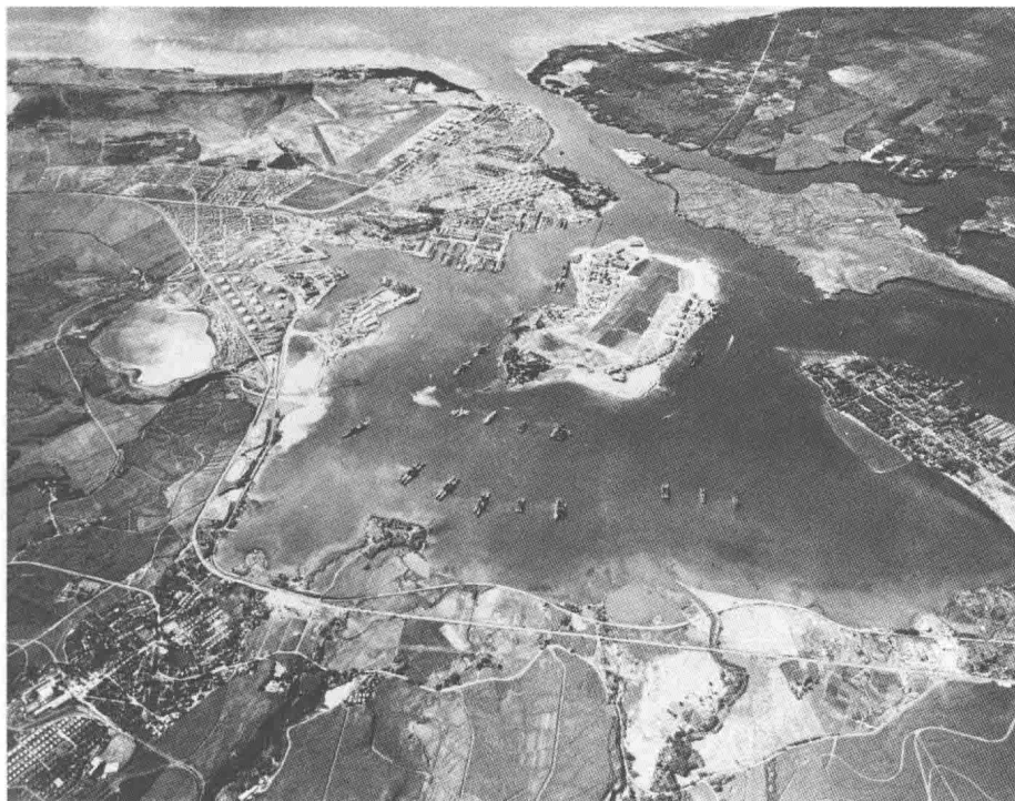
珍珠港俯视图（1941年10月30日）

有很多争论和疑虑，其中有一条就是日本庞大的南云机动舰队是怎样用障眼法瞒过美军的？20世纪的太平洋虽然没有现在这样繁忙，可是主要航线上也是商船、军舰来往不断。南云机动舰队拥有6艘航空母舰、2艘战列舰、3艘巡洋舰、9艘驱逐舰、3艘油船和1艘给养船，这支总计24艘舰只的庞大舰队是如何穿越广袤的太平洋，最终给美军致命一击的呢？