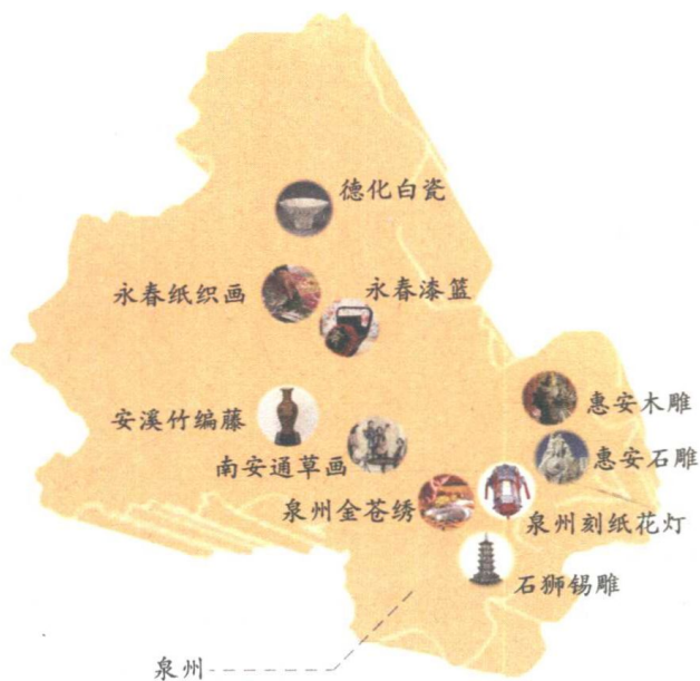
泉州地区传统手工艺品类分布示意图