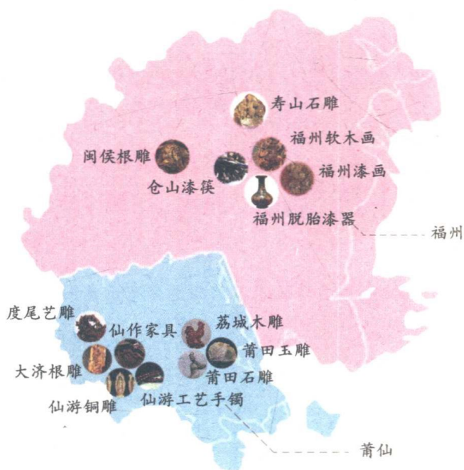
福州、莆田仙游地区传统手工艺品类分布示意图