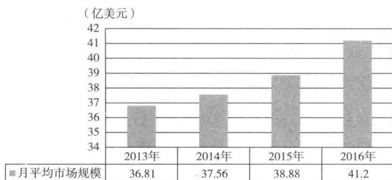
图2 2013~2016年上半年全球地毯市场规模变动情况

以中国、日本为代表的亚太地区已经成长为全球最大的地毯消费市场，2015年度该区域地毯消费规模达到180亿美元，占全球消费市场总量的38.5%，2016年达190亿美元。欧盟市场虽然受区域经济疲软的影响，但作为传统的地毯主要消费地，地毯消费量仍然持续增长，2015年为122亿美元，占到全球地毯市场份额的26.2%；到2016年已经发展为130亿美元。2006年以来美国地毯行业规模年均增速在4%左右，2012年行业收入达到72.5亿美元，2013年为76.4亿美元，年增速为5.3%（见图2、图3）；北美地区2016年地毯消费规模达90亿美元。